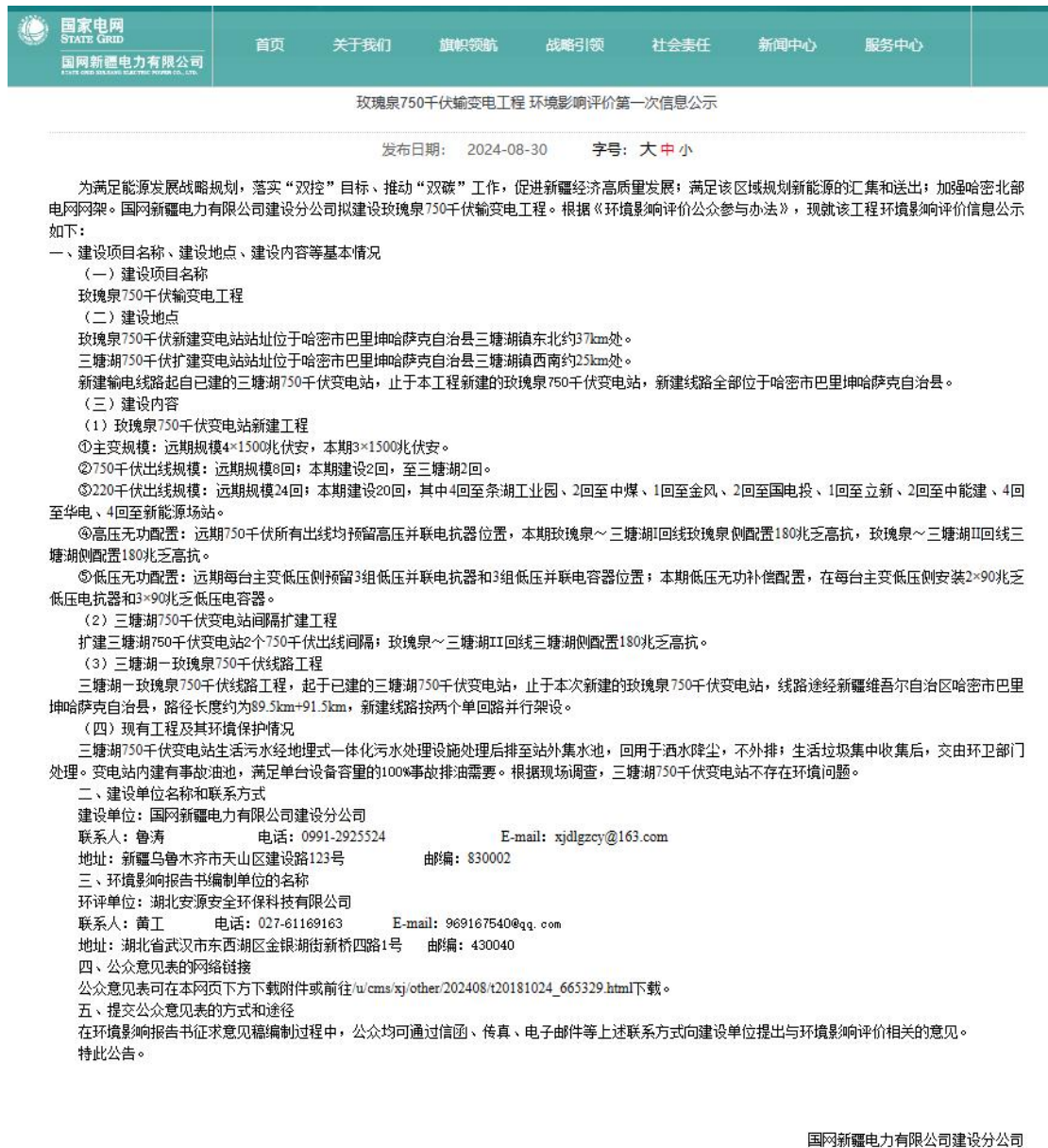
图 1 第一次公众参与网络公示截图