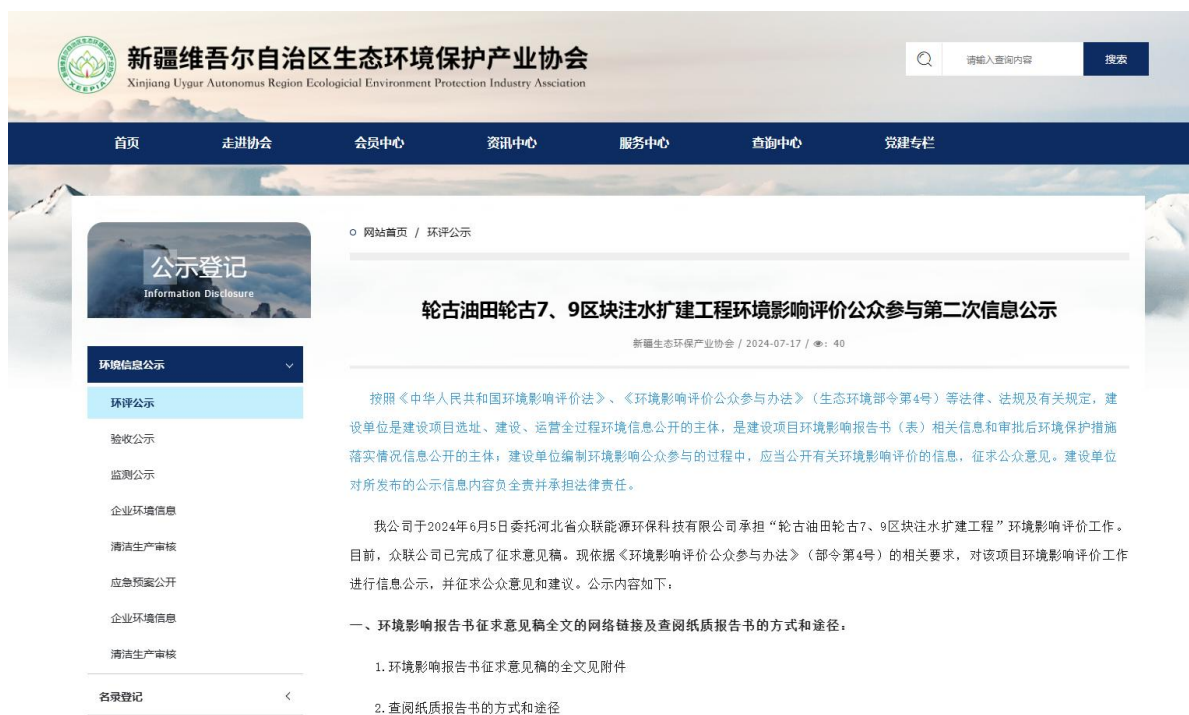
图 3-1 第二次信息公示情况

我公司在新疆维吾尔自治区生态环境保护产业协会网站( http://www.xjhbcy.cn/articles/show/13750 )上发布了征求意见稿公示信息，对环境影响报告书征求意见稿全文进行公开，公示时限为10个工作日，网站第二次公告截图见图3-1。