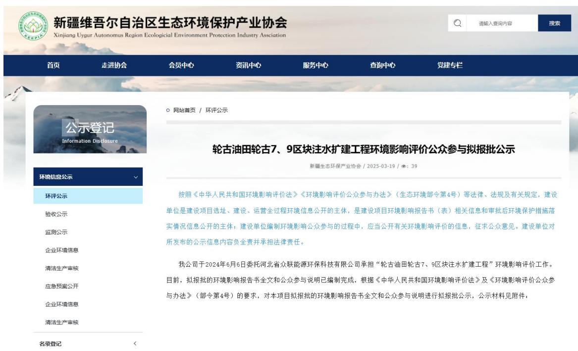
图 6-1 报批前网络公示截图

本次报批前公开方式为网络公开，公开时间为2025年3月19日，公开网站为新疆维吾尔自治区生态环境保护产业协会网站( http://www.xjhbcy.cn )，该网站可以上传并公开项目环境影响报告书全本，选择该网站进行公示符合《环境影响评价公众参与办法》要求。报批前网络公示截图见图6-1。