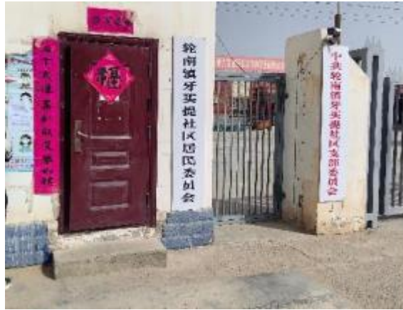
图 3-4 2024 年 7 月 24 日村庄张贴公示情况

我公司于 2024 年 7 月 24 日在周边村庄张贴了项目环境影响报告书公示信息，现场公示照片见图 3-4。