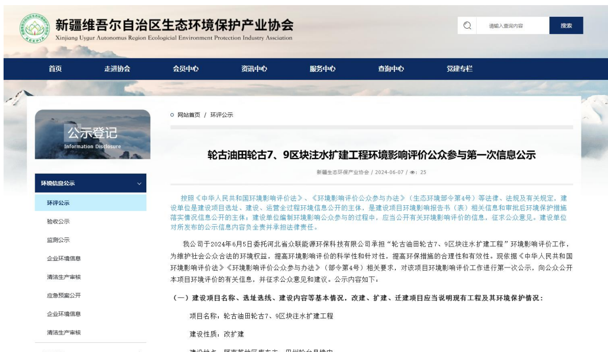
图 2-1 第一次信息公示情况

2024 年 6 月 7 日，我公司在新疆维吾尔自治区生态环境保护产业协会网站 ( http://www.xjhbcy.cn/articles/show/13588 ) 上发布了第一次公示信息。首次公示网络截图见图 2-1。