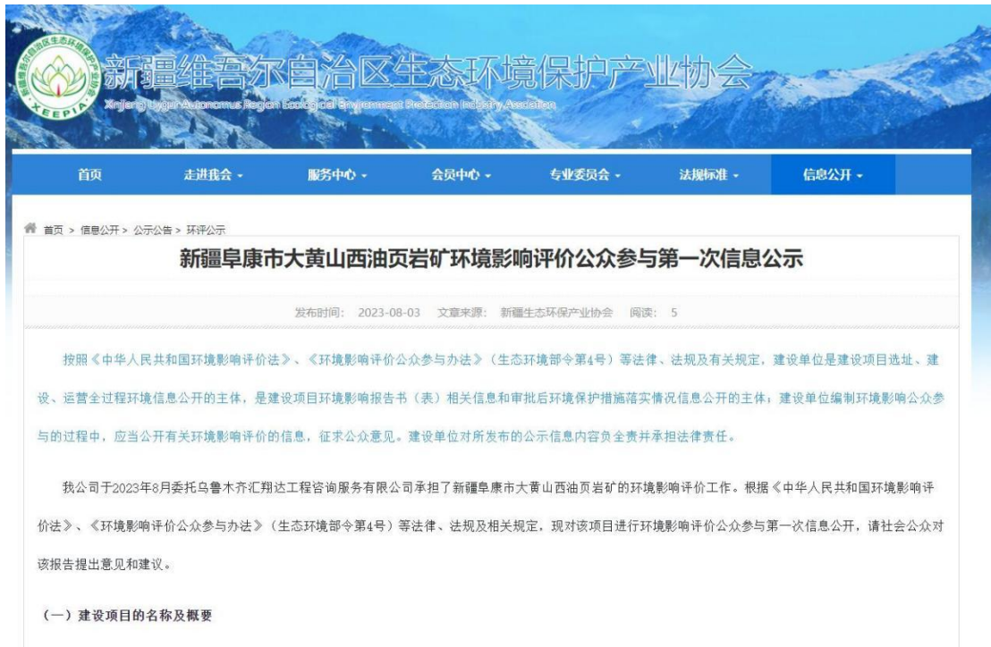
图 2-1 本项目第一次网络公示截图