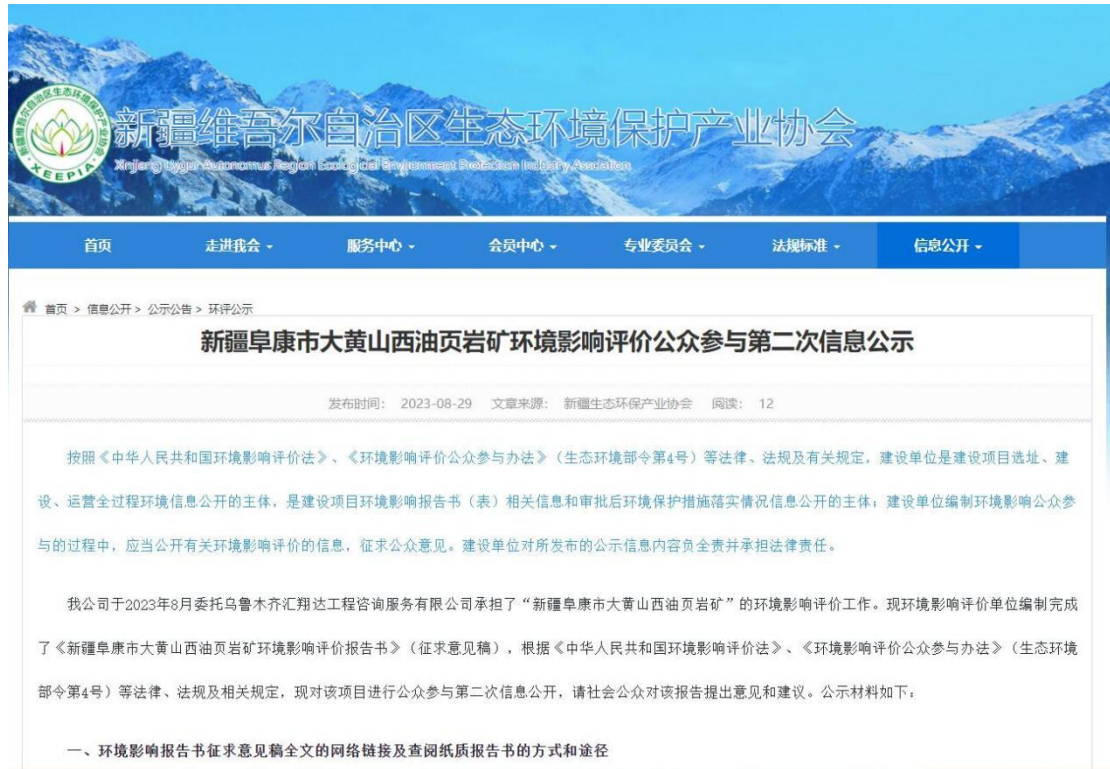
图 3-1 本项目征求意见稿网络公示截图

( http://www.xjhbcy.cn/blog/article/11966 ), 载体选择符合《环境影响评价公众参与办法》要求。公示截图请见图 3-1。