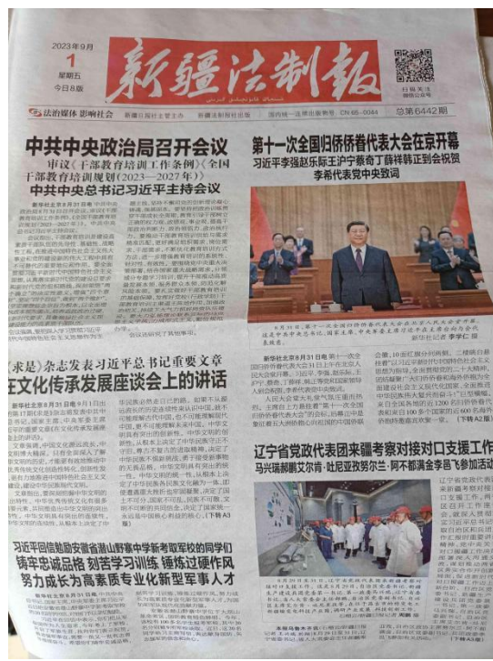
本项目第二次报纸公示截图

阜康市华泽科技发展有限公司于2023年8月31日，在项目区周边张贴了项目公众参与公示信息。持续公开日期大于10个工作日。张贴区域的选择符合《环境影响评价公众参与办法》要求。张贴照片见图3-4。