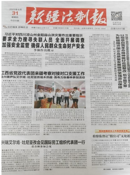
本项目第一次报纸公示截图