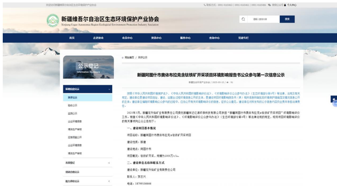
图2-1 第一次信息公示（新疆维吾尔自治区生态环境保护产业协会网站）