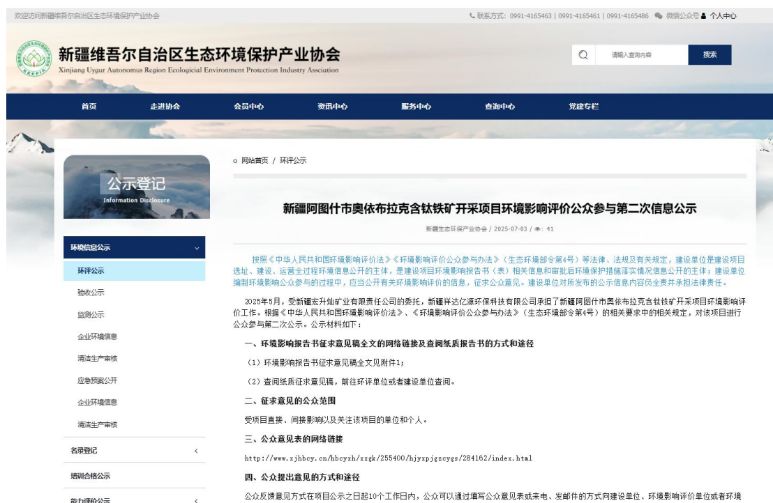
图3-1 第二次公示征求意见稿网络公示图