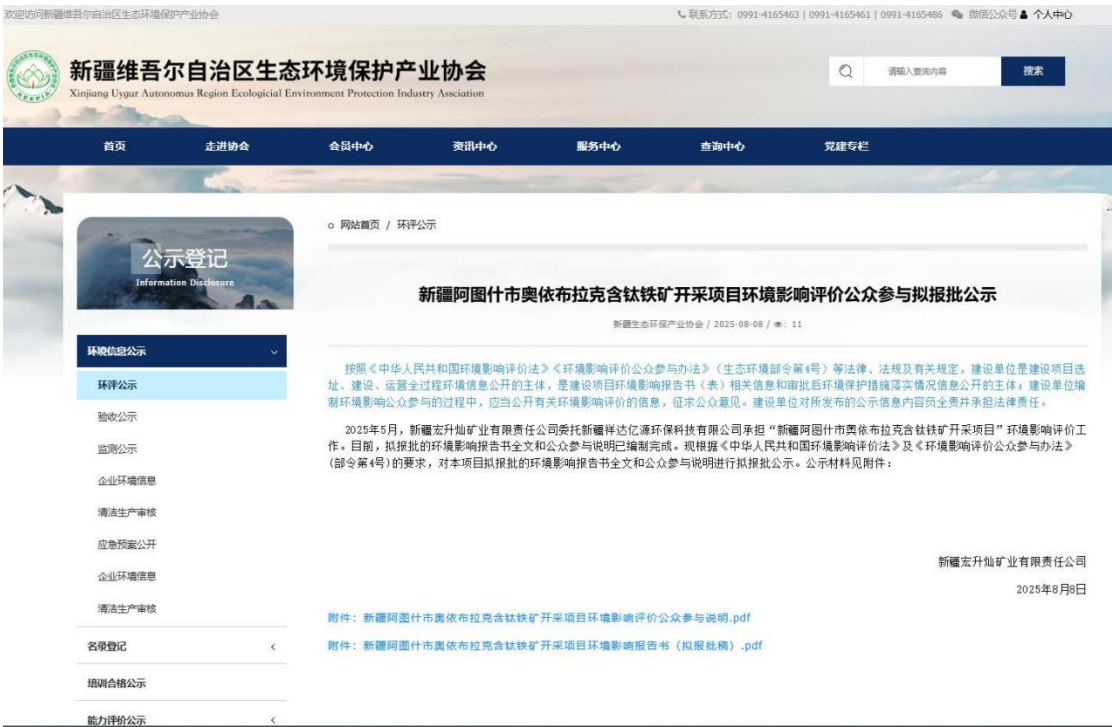
图6-1 第三次公示拟报批稿