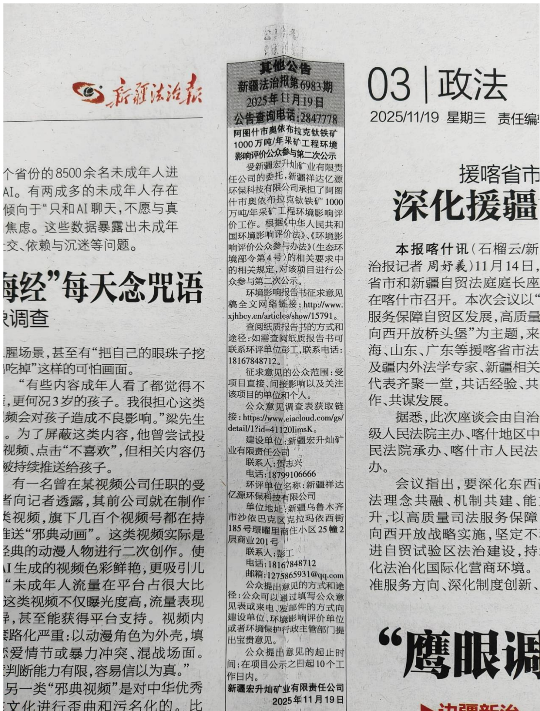
图3-2 第二次公示-征求意见稿报纸发布（2025年11月19日）