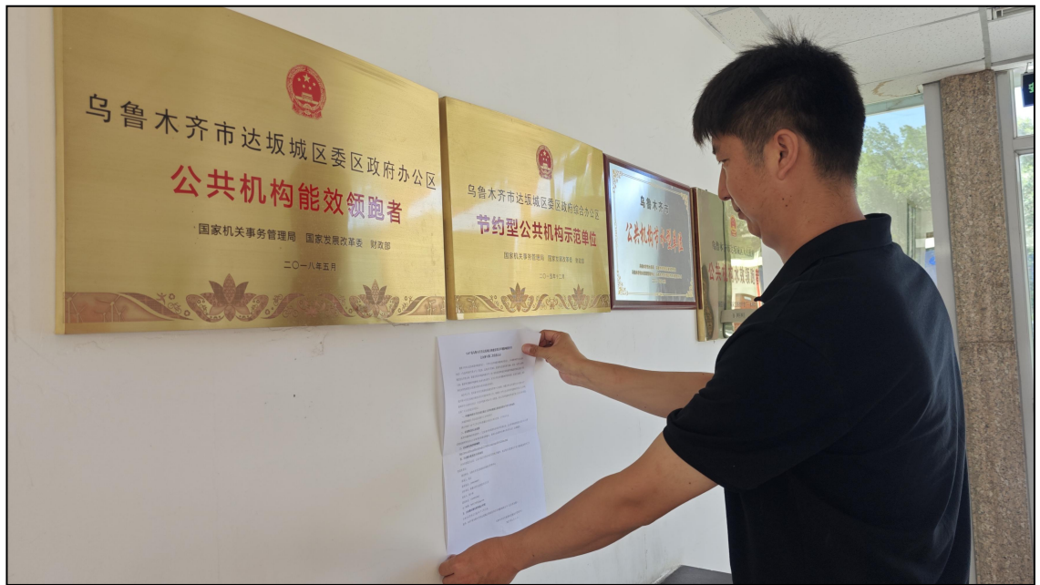
图 3-4 本项目张贴公告照片