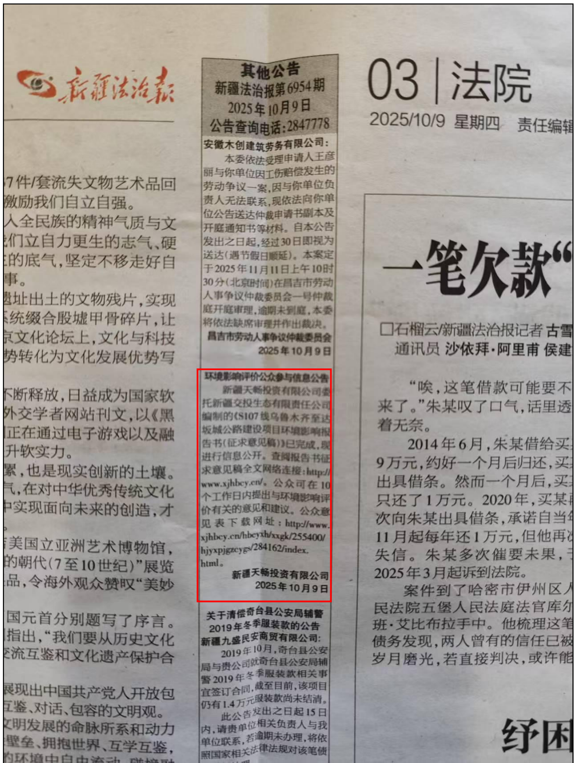
图 3-2 本项目第一次报纸公示照片