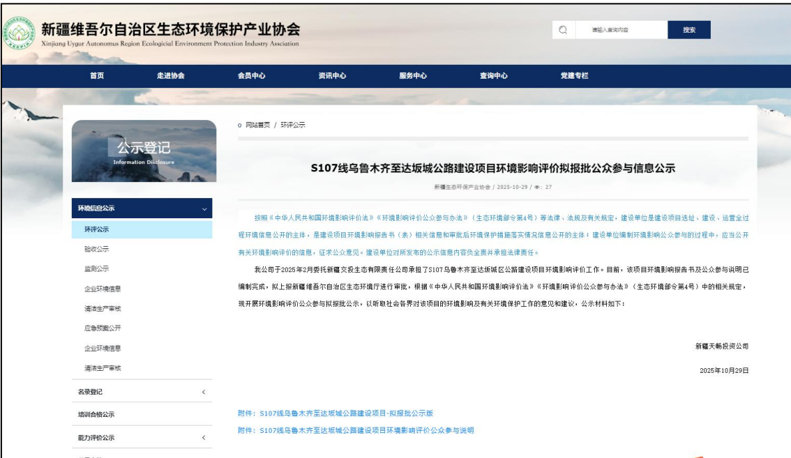
图 6-1 拟报批稿网络公示截图

新疆天畅投资有限公司于 2025 年 10 月 29 日在新疆维吾尔自治区生态环境保护产业协会网（ http://www.xjhbcy.cn ）上开展环境影响评价拟报批公示，向公众告知拟报批稿及其网络公众意见调查表的相关信息。公告网址： http://www.xjhbcy.cn/articles/show/16384 。载体选择符合《环境影响评价公众参与办法》要求。拟报批稿网络公示截图见图 6-1。