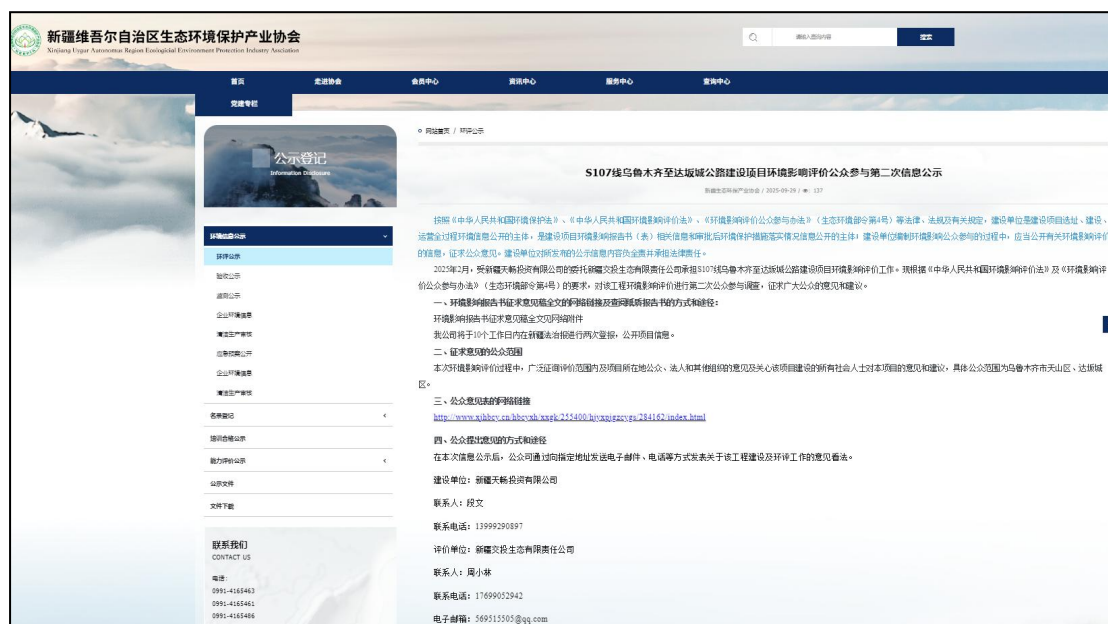
图 3-1 第二次网上公示