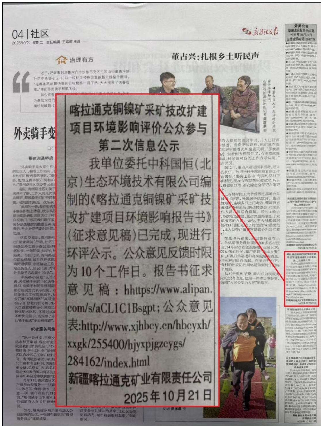
图 4 本项目第二次报纸公示照片