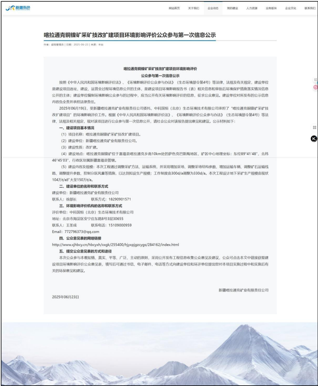
图 1 本项目第一次网络公示截图