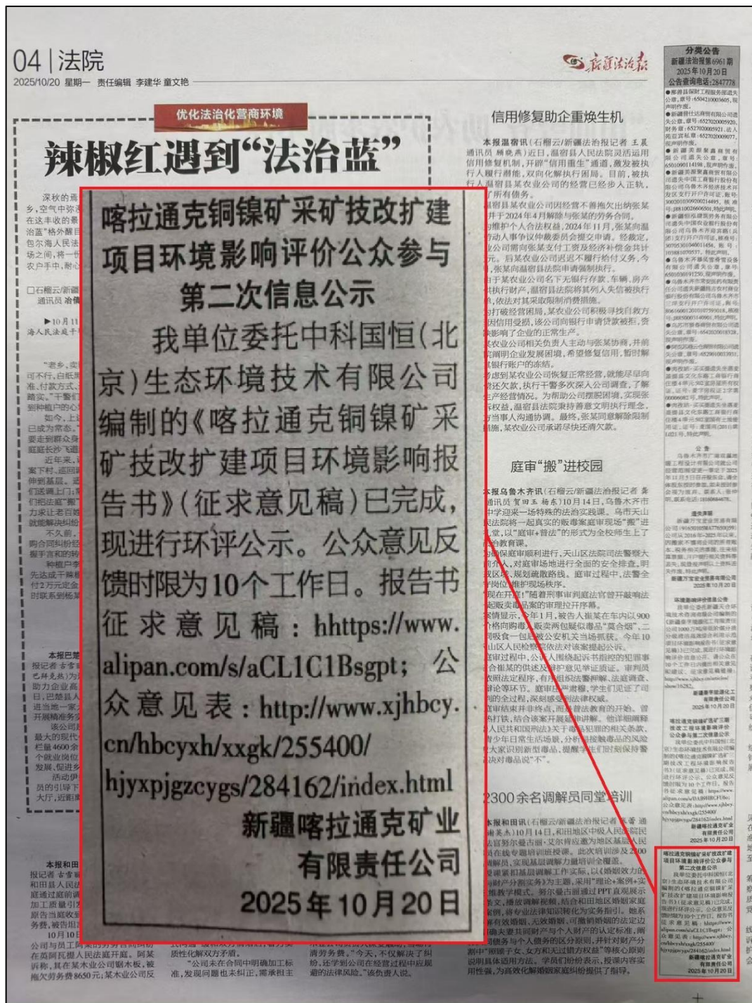
图 3 本项目第一次报纸公示照片