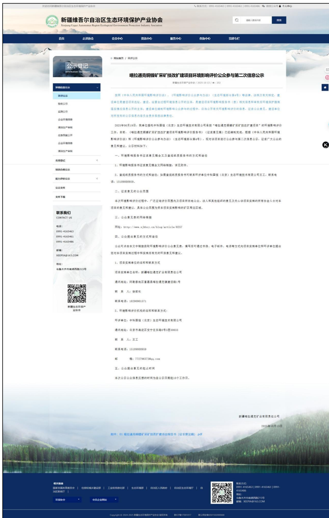
图2 本项目征求意见稿网络公示截图