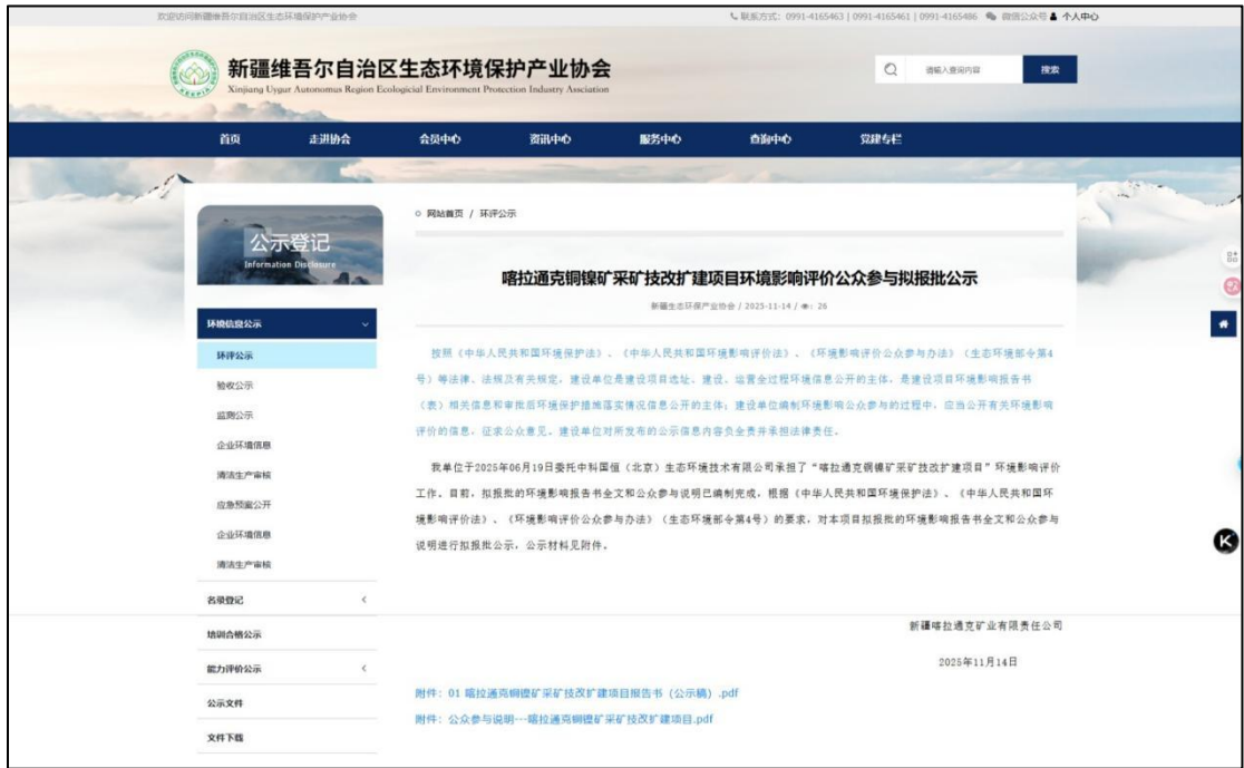
图 6 本项目拟报批前公开网络截图