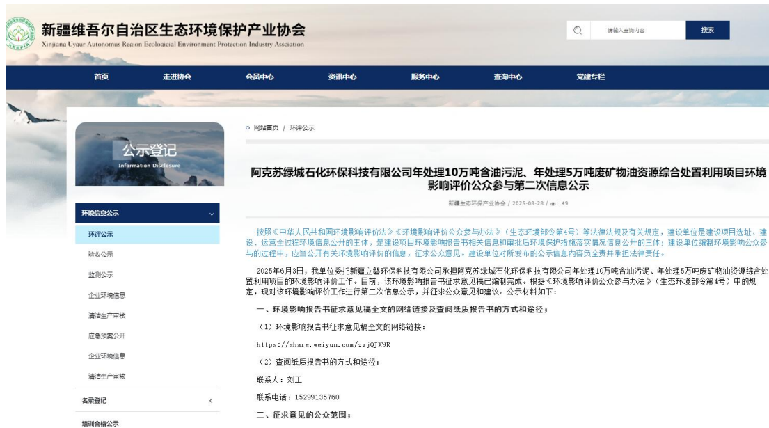
图2 本项目征求意见稿网络公示截图