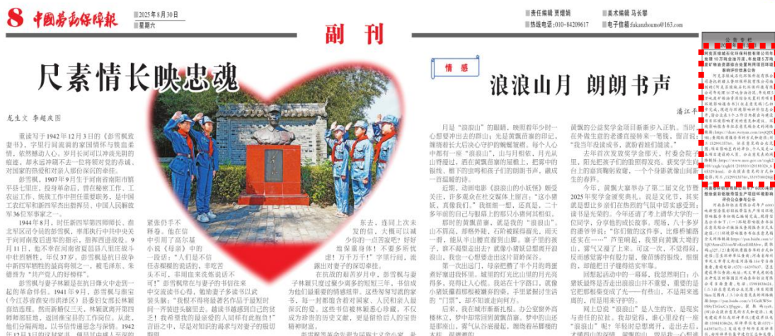
图3 本项目第一次报纸公示照片