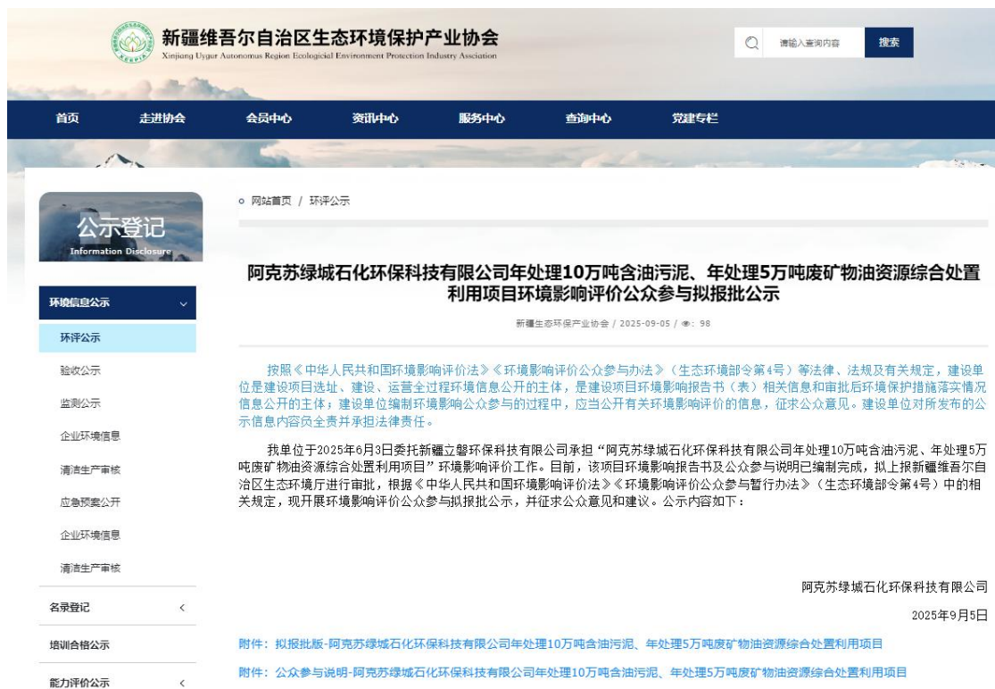
图 6 本项目拟报批前网络公示截图