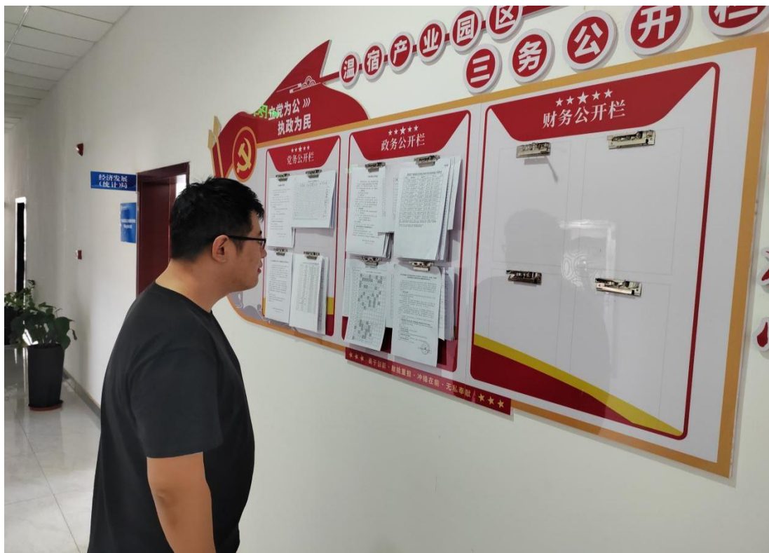
图 5 公示现场照片

根据《环境影响评价公众参与办法》，建设单位于 2025 年 8 月 28 日在温宿产业园区三务公开栏张贴了公告，公示现场照片见图 5。