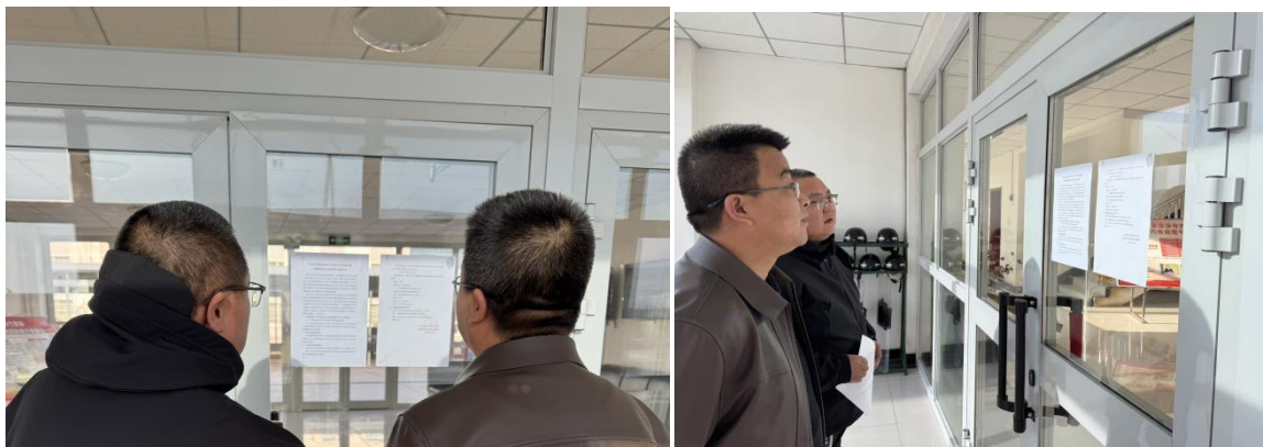
图 3.2-5 公告照片