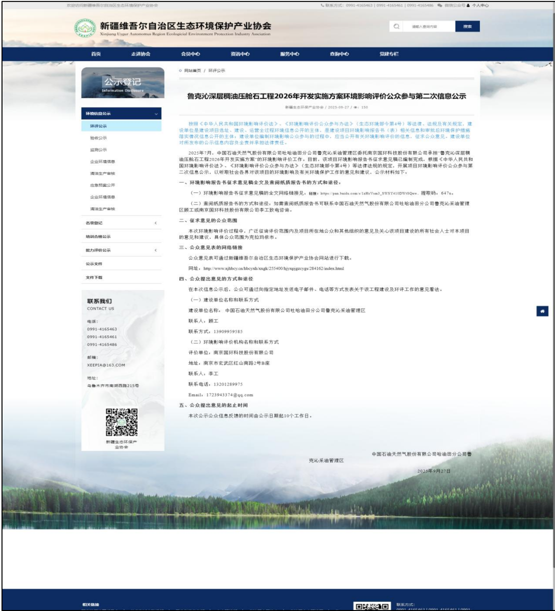
图 3.2-1 环境影响评价第二次公示（新疆维吾尔自治区生态环境保护产业协会网站）