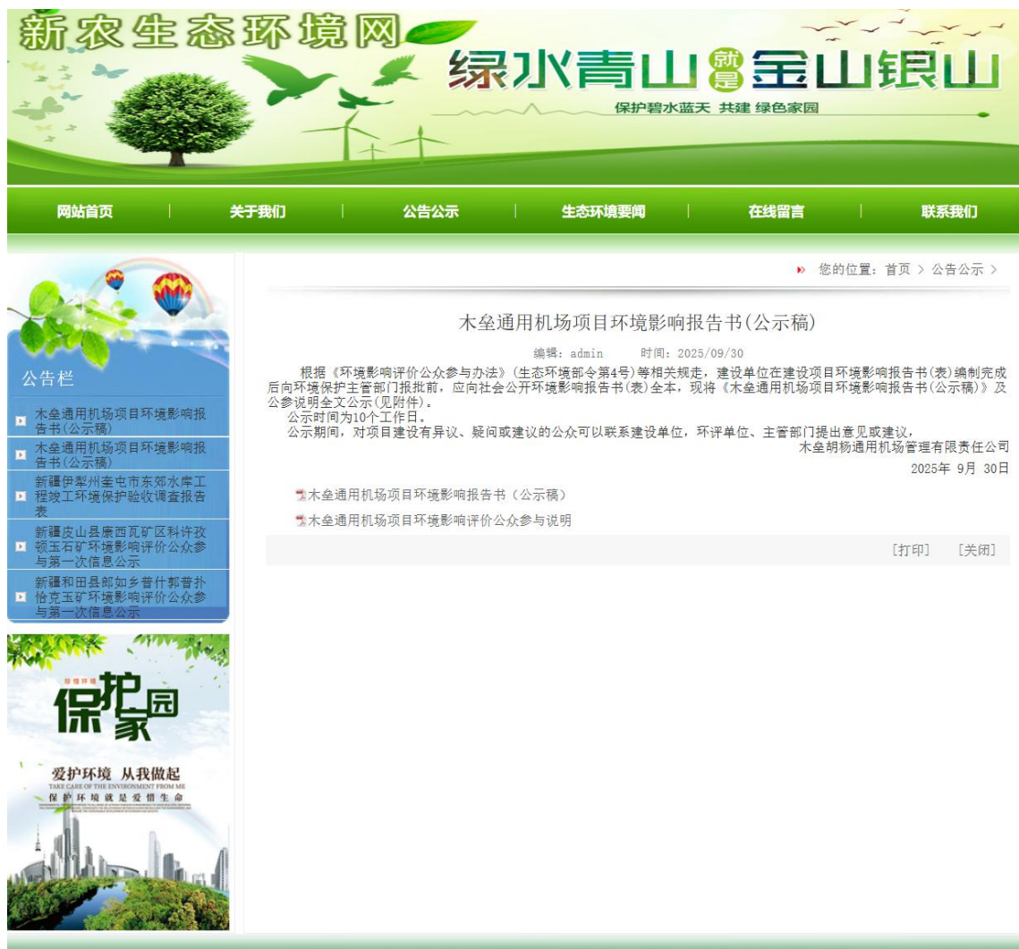
图 5-1 项目拟报批公众参与网络公示截图