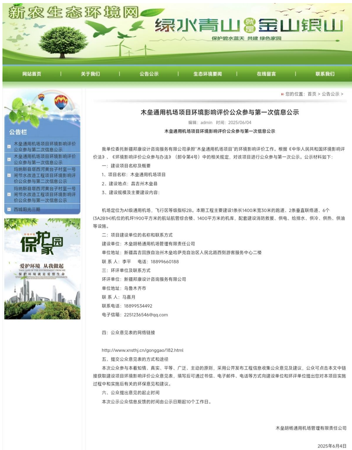
图 2.2-1 第一次公示（网络）截图