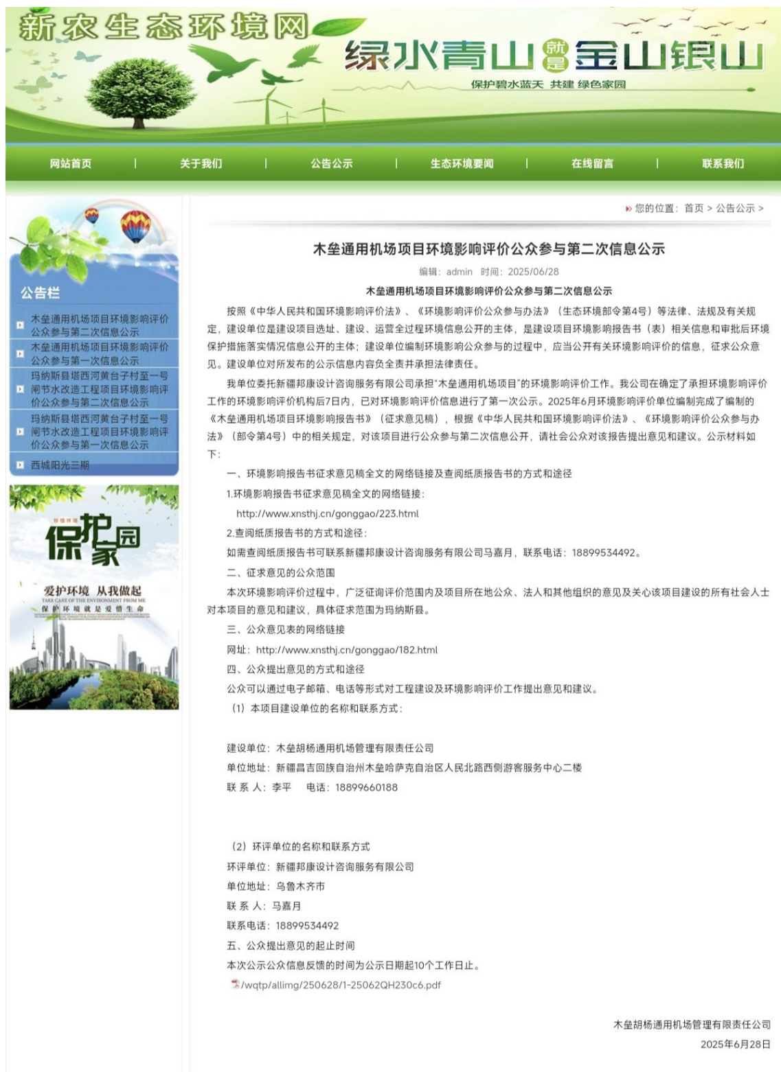
图 3.2-1 第二次公示（网络）截图