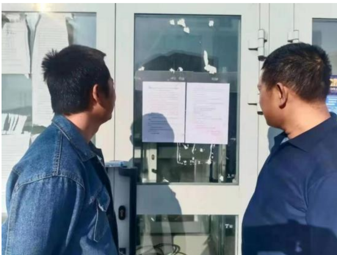
图 3.2-4 张贴公告照片