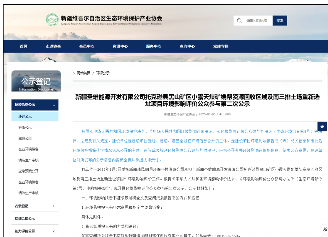
图 3.2.1 征求意见稿信息网络公开截图