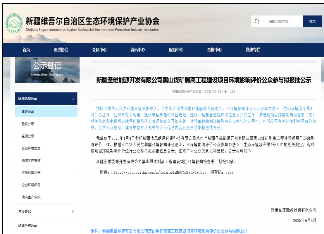
图 6.2.1 网络公开截图