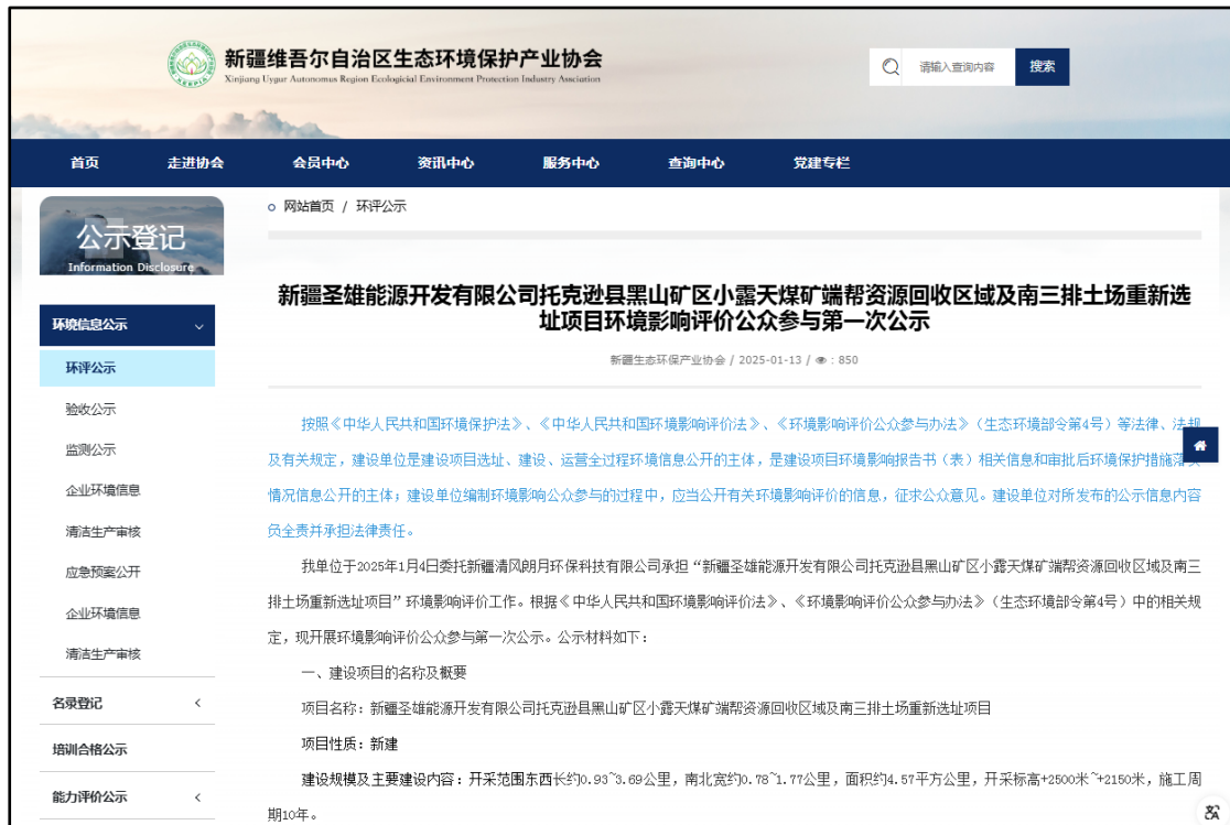
图 2.2.1 首次环境影响评价信息网上公示截图