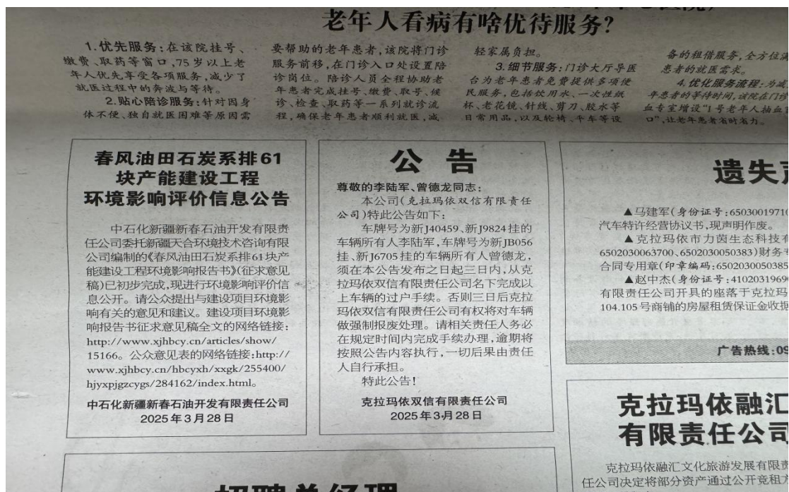
图 3.2-2 本项目第一次报纸公示照片