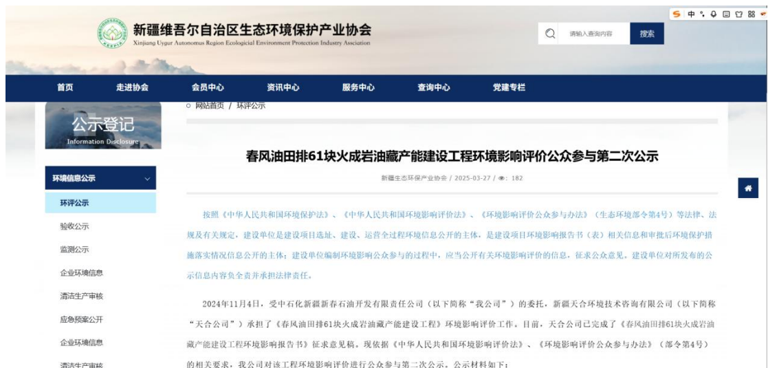
图 3.2-1 本项目征求意见稿网络公示截图