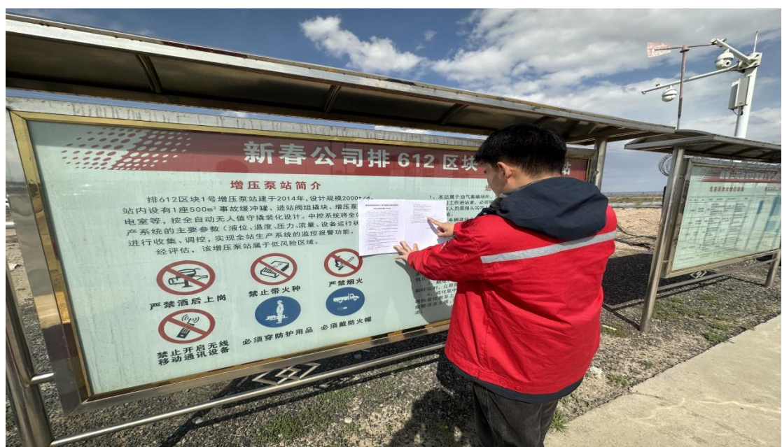
图 3.2-4 本项目张贴公示栏照片

在第二次公示期间，本项目在项目所在地公示栏进行了张贴公示，载体选择符合《环境影响评价公众参与办法》要求。张贴公示照片见图 3.2-4。