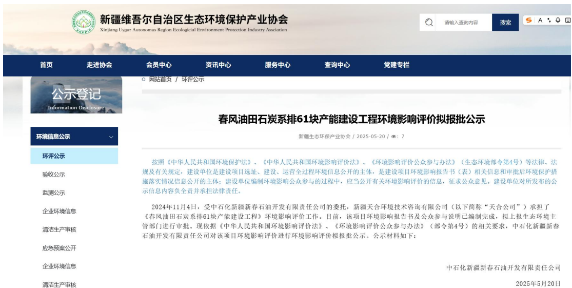
图 6.2-1 拟报批公示网页截图