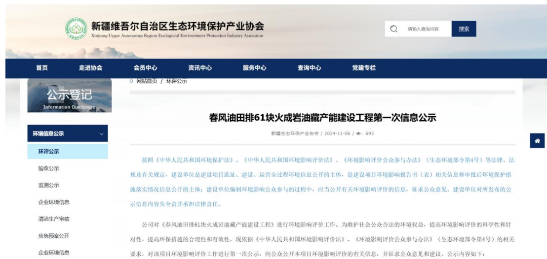
图 2.2-1 本项目第一次网络公示截图

中石化新疆新春石油开发有限责任公司在新疆维吾尔自治区生态环境保护产业协会网站开展网络公示，载体选择符合《环境影响评价公众参与办法》要求。公示链接： http://www.xjhbcy.cn/articles/show/14263 ，网络公示截图见图 2.2-1。