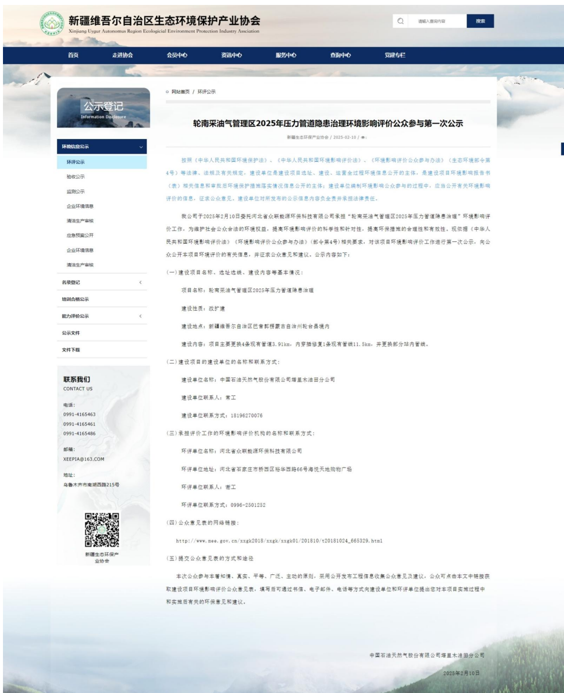
图 2-1 第一次信息公示情况