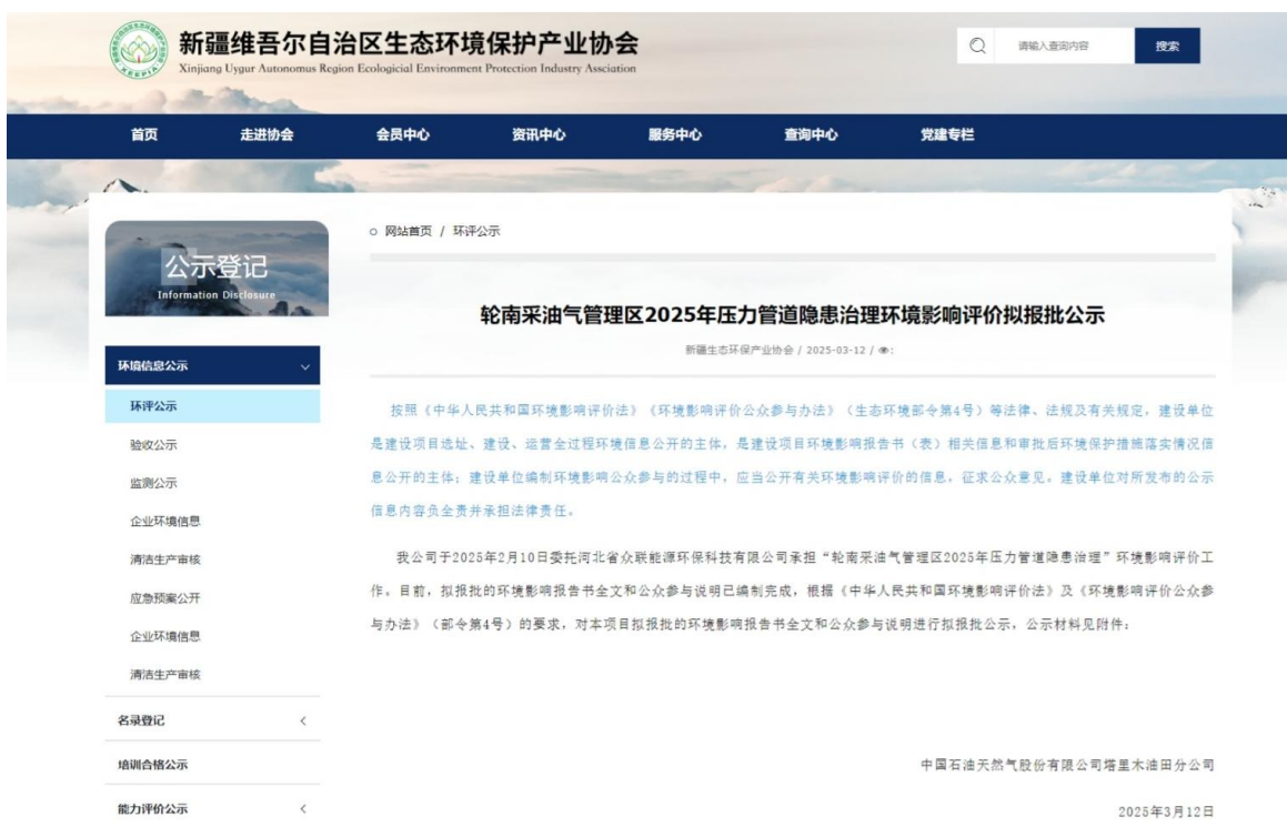
图 6-1 报批前网络公示截图

本次报批前公开方式为网络公开，公开时间为2025年3月12日，公开网站为《新疆维吾尔自治区生态环境保护产业协会网站》，该网站可以上传并公开项目环境影响报告书全本，选择该网站进行公示符合《环境影响评价公众参与办法》要求。报批前网络公示截图见图6-1。