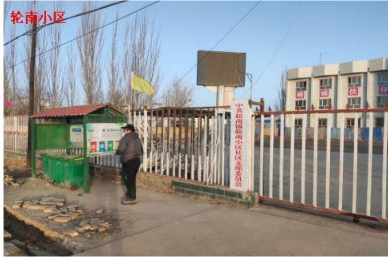
图 3-4 2025 年 2 月 28 日轮南小区张贴公示情况

我公司于 2025 年 2 月 28 日在轮南小区张贴了项目环境影响报告书公示信息，现场公示照片见图 3-4。