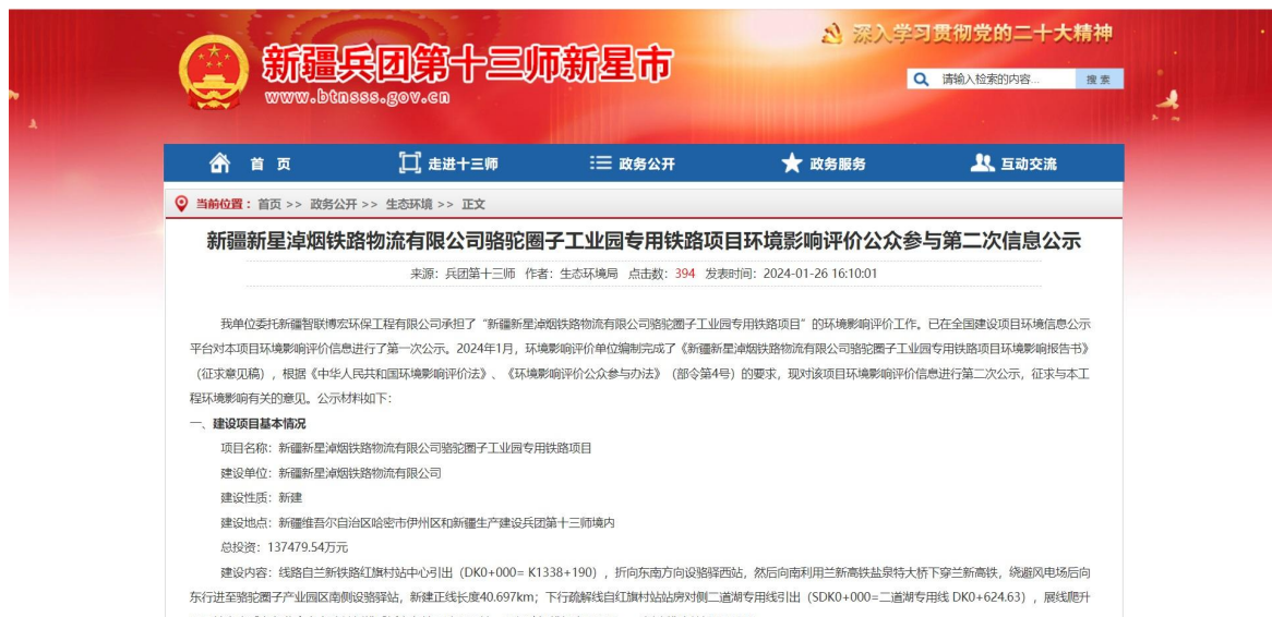
图 3-1 第二次网络公示截图