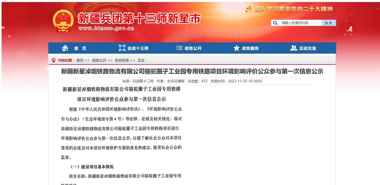
图 2-1 第一次网络公示截图