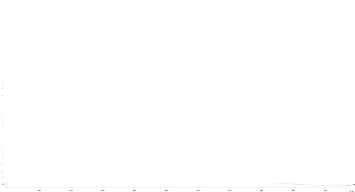
图 4.1-1 区域水文地质图

孔隙水和基岩裂隙水。就区域角度而言，从南部基岩山区～山前倾斜平原～车尔臣河～塔克拉玛干沙漠的整个流域属于一个统一的水文地质单元。区域水文地质见图 4.1-1。