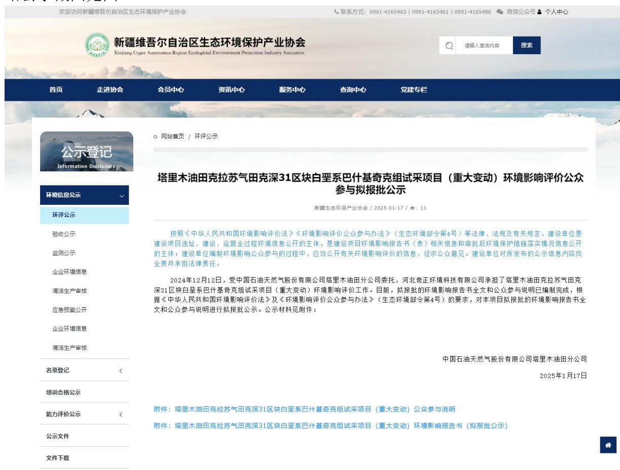
图4-1 报批前网络公示截图

本次报批前公开方式为网络公开，公开时间为2025年1月17日，公开网站为新疆维吾尔自治区生态环境保护产业协会网站（ http://www.xjhbcy.cn/blog/article/13455 ），该网站是新疆维吾尔自治区生态环境保护协会指定官方网站，且可以上传并公开项目环境影响报告书全本，选择该网站进行公示符合《环境影响评价公众参与办法》要求。报批前网络公示截图见图4-1。