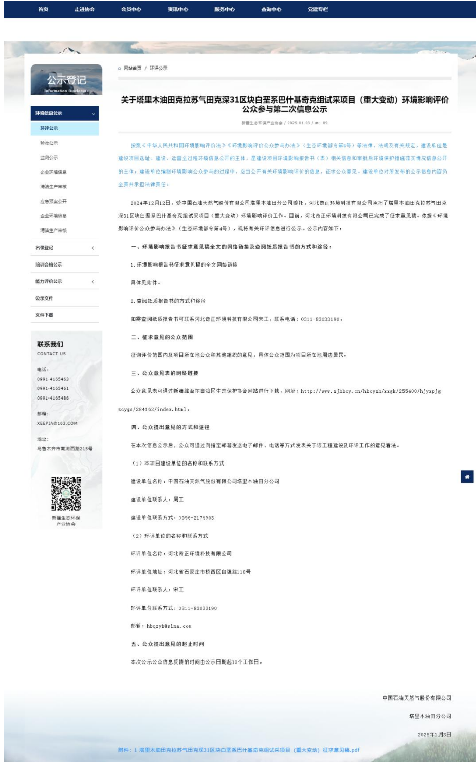
图3-1 第二次信息公示情况