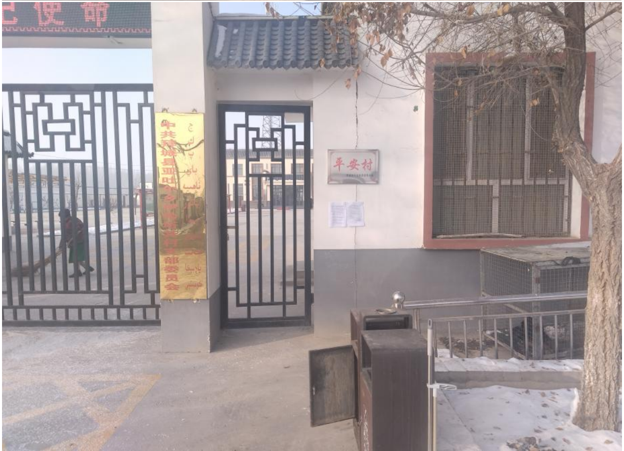
图3-1 第二次公示信息公示张贴情况