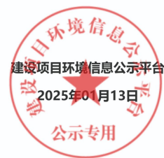
图2 征求意见稿公示截图