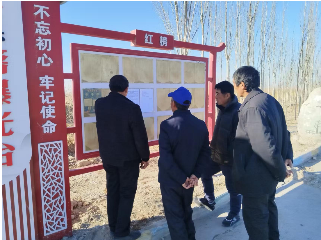
图 5-2 张贴公告公示照片