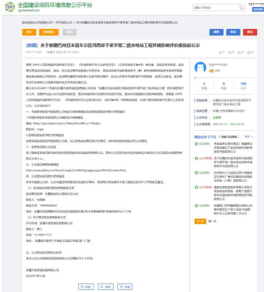
图 6 报批前公开截图

建设单位选择环评论坛网站进行信息公开，符合《环境影响评价公众参与办法》要求。建设单位于 2025 年 1 月 15 日采取网络方式进行公示，公示网址： https://www.eiacloud.com/gs/detail/1?id=50115dcUZ2 ，公示截图见图 6。