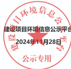
图1 第一次环境影响评价信息公开截图