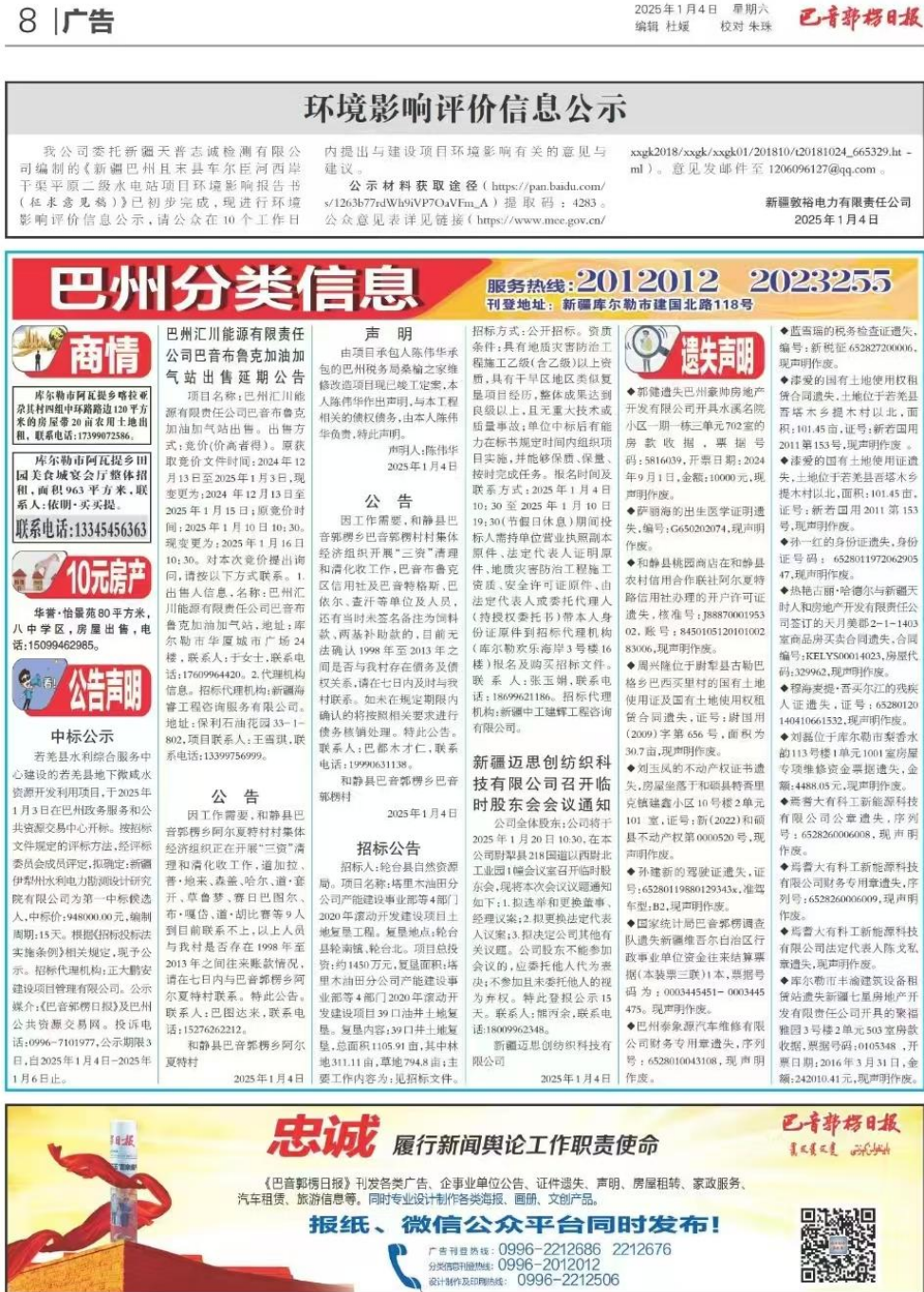
图3 第一次报纸公示照片

的10个工作日内(2024年12月23日至2025年1月7日)公开信息2次。分别为2025年1月4日、2025年1月6日。报纸公示照片见图3、图4。