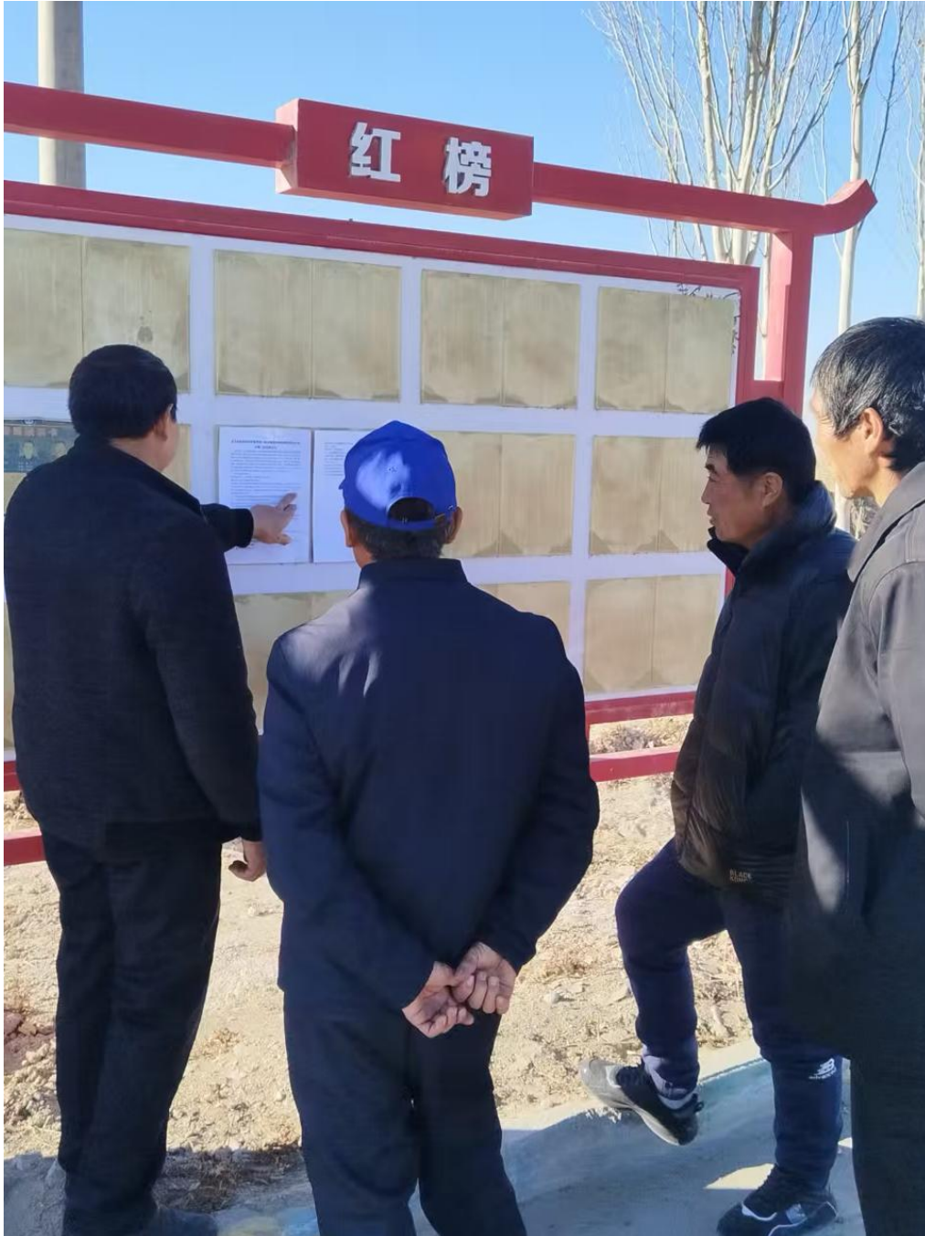
图 5-1 张贴公告公示照片

本项目位于巴音郭楞蒙古自治州且末县境内的车尔臣河中下游河段，本项目北四周均为空地。按照《环境影响评价公众参与办法》规定，建设项目应通过在建设项目所在地公众易于知悉的场所张贴公告的方式公开，且持续公开期限不得少于 10 个工作日。因此本项目于 2024 年 12 月 23 日在库拉木勒克乡公告栏处张贴公告，公开不少于 10 个工作日。详见图 5。