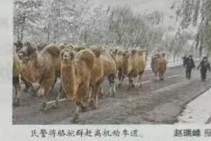
民警将骆驼群赶回机动车道。

本报乌鲁木齐讯(通讯员 袁利娟)11月25日,乌鲁木齐市公安米东区分局古牧地派出所民警驾车巡逻至绿地广场时,发现一群骆驼正在机动车道上悠闲地“漫步”,过往车辆纷纷刹车,十分危险。