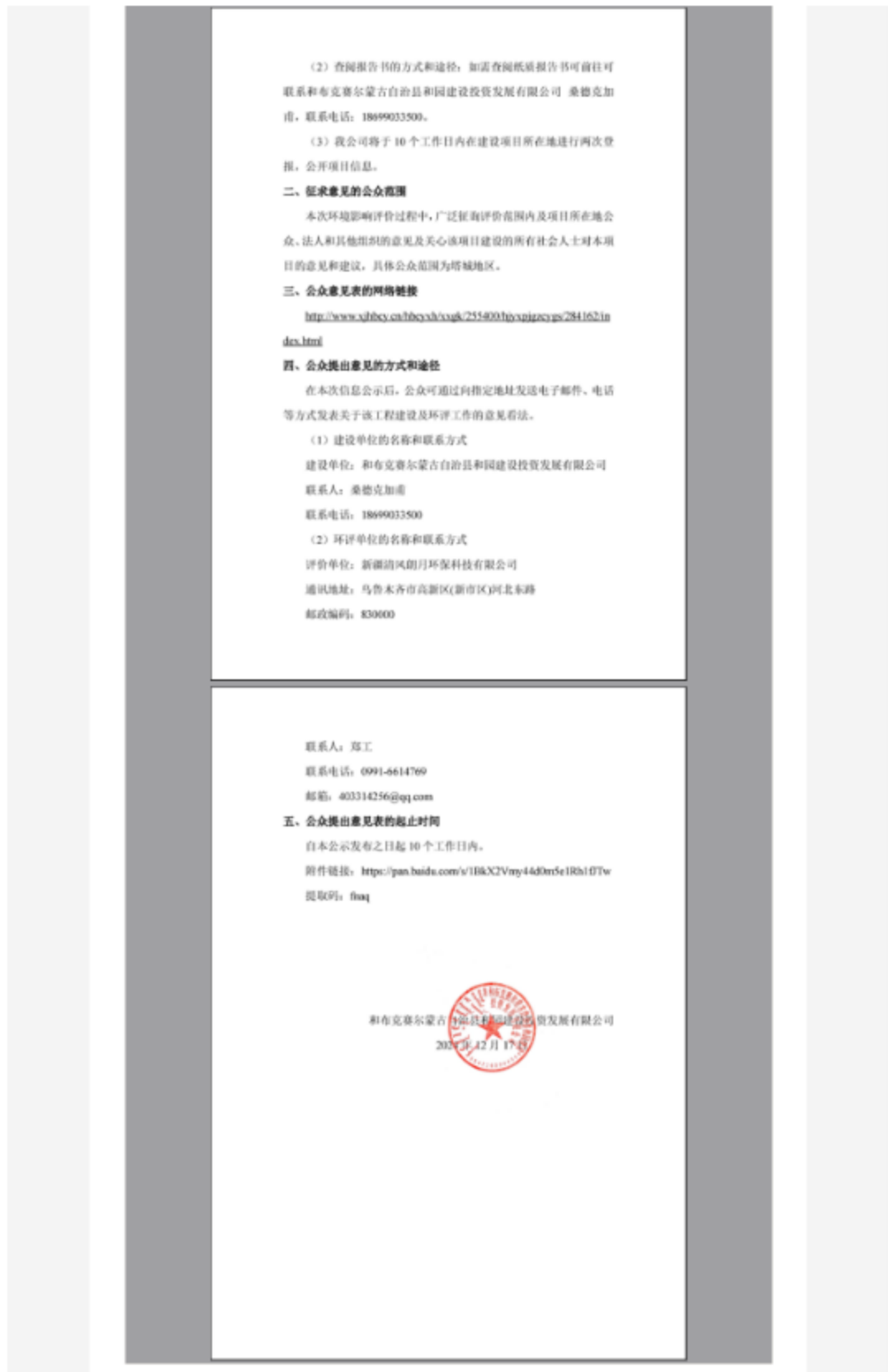
图 3.2.1 征求意见稿信息网络公开截图