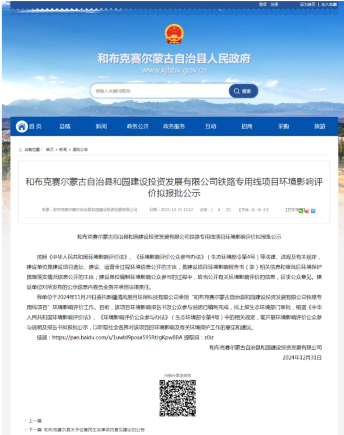
图 6.2.1 网上公示截图