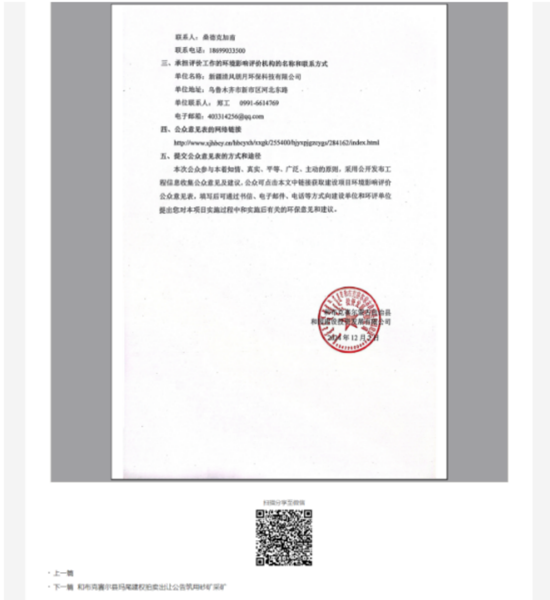
图 2.2.1 首次环境影响评价信息网上公示截图