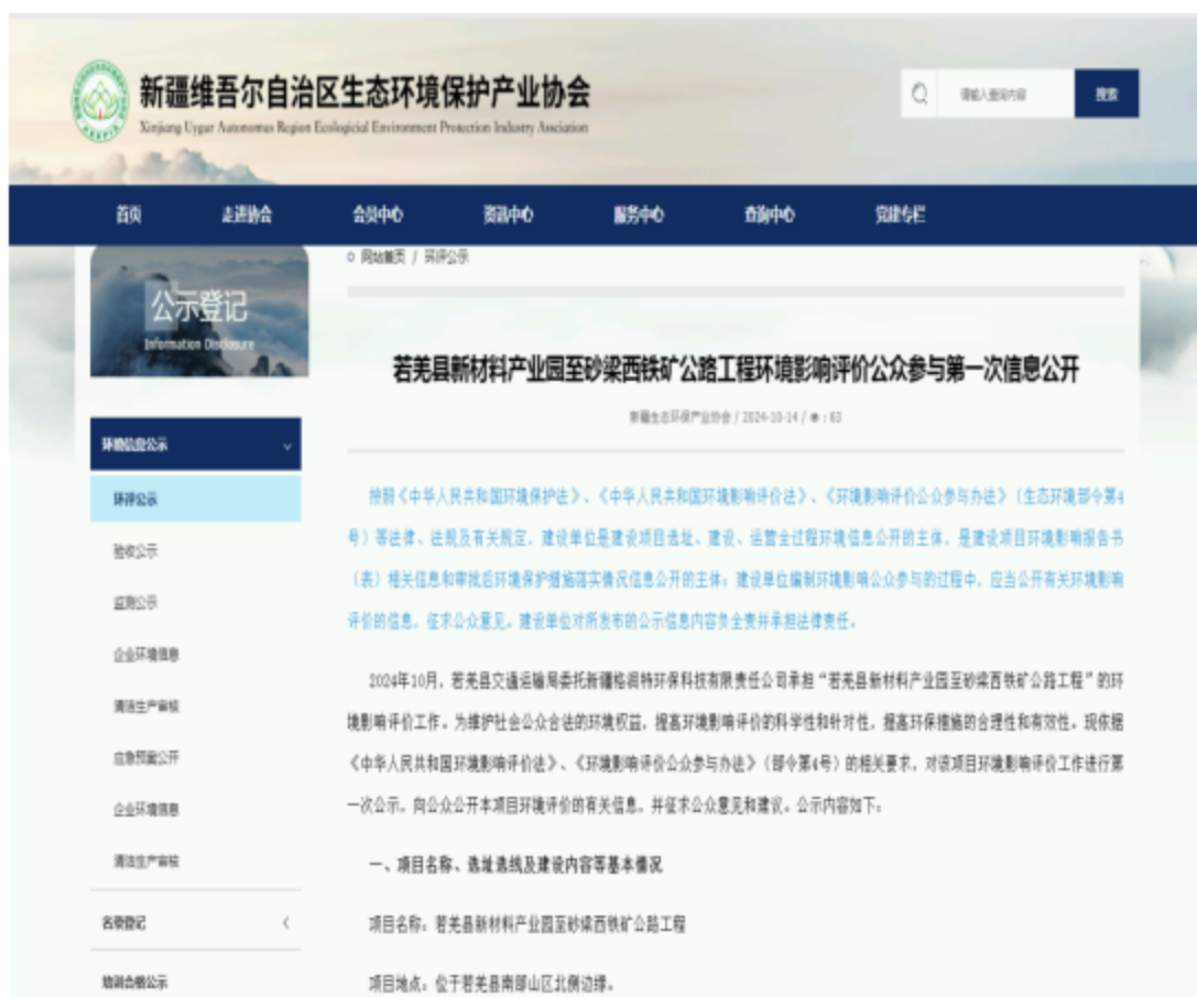
图1 公众参与第一次信息公告网络公示截图