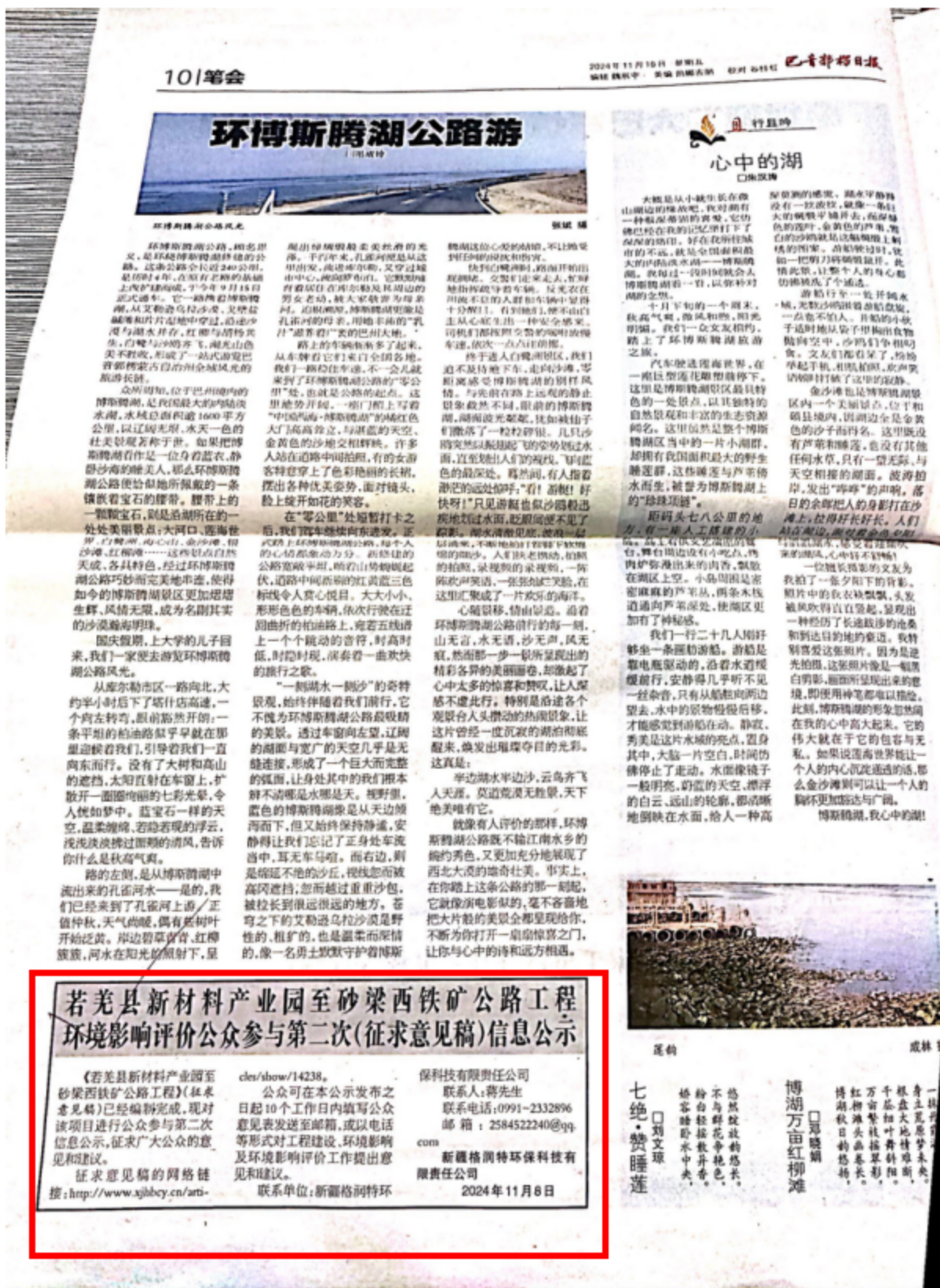
图5 公众参与第二次信息公告二次登报