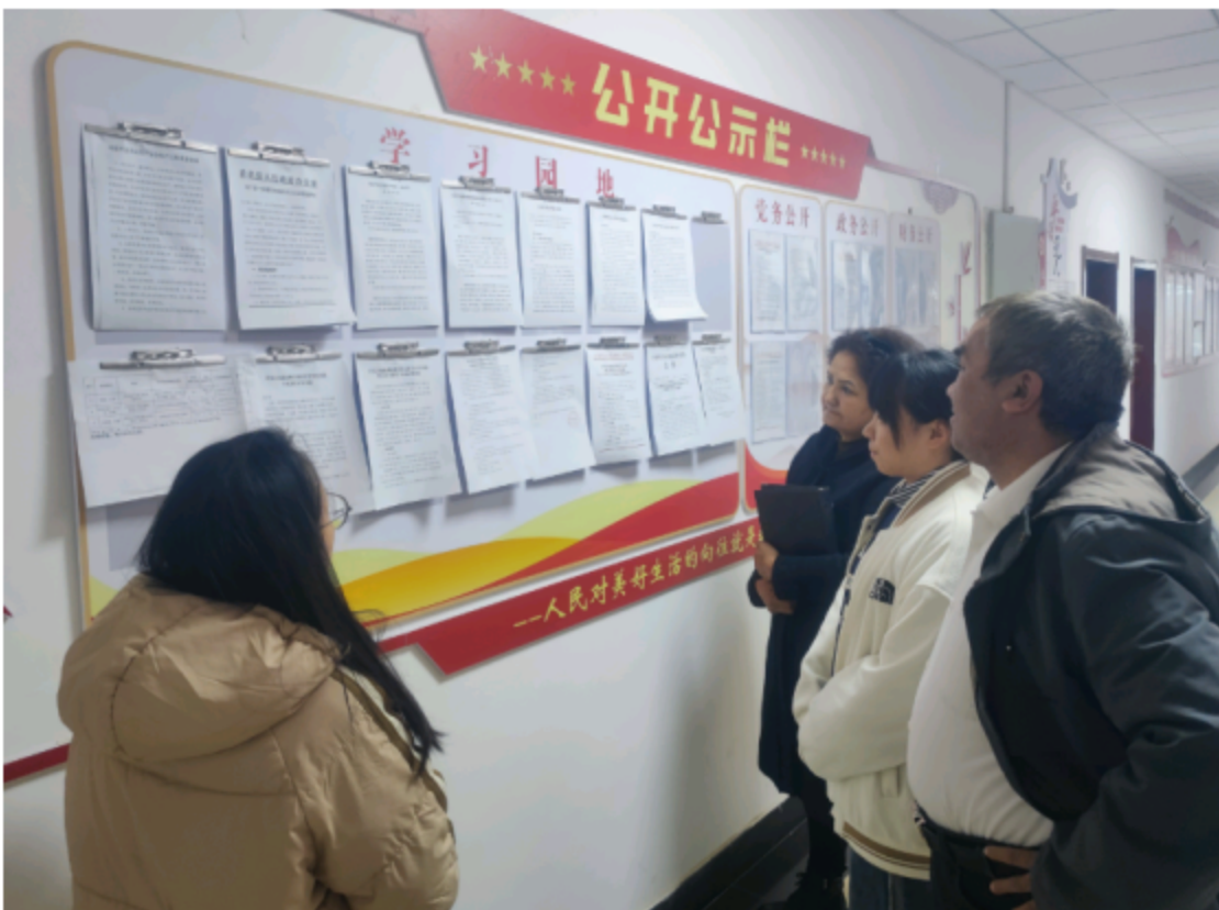
图2 公众参与第二次信息公告张贴现场照片