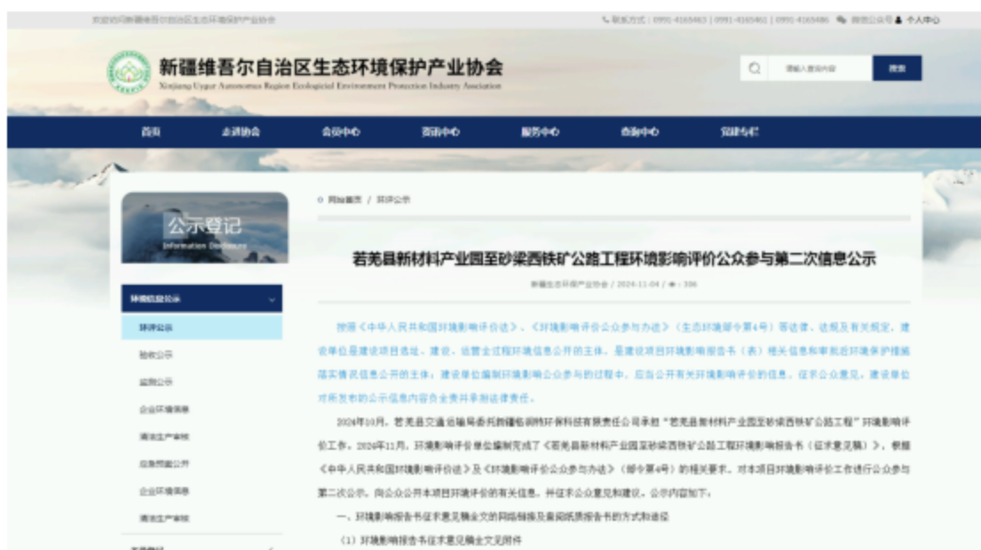
图3 公众参与第二次信息公告网络公示截图

网络公开选择的载体、公示内容、格式和公开时间均符合《环境影响评价公众参与办法》的相关要求，第二次信息公告网络公示截图见图3。