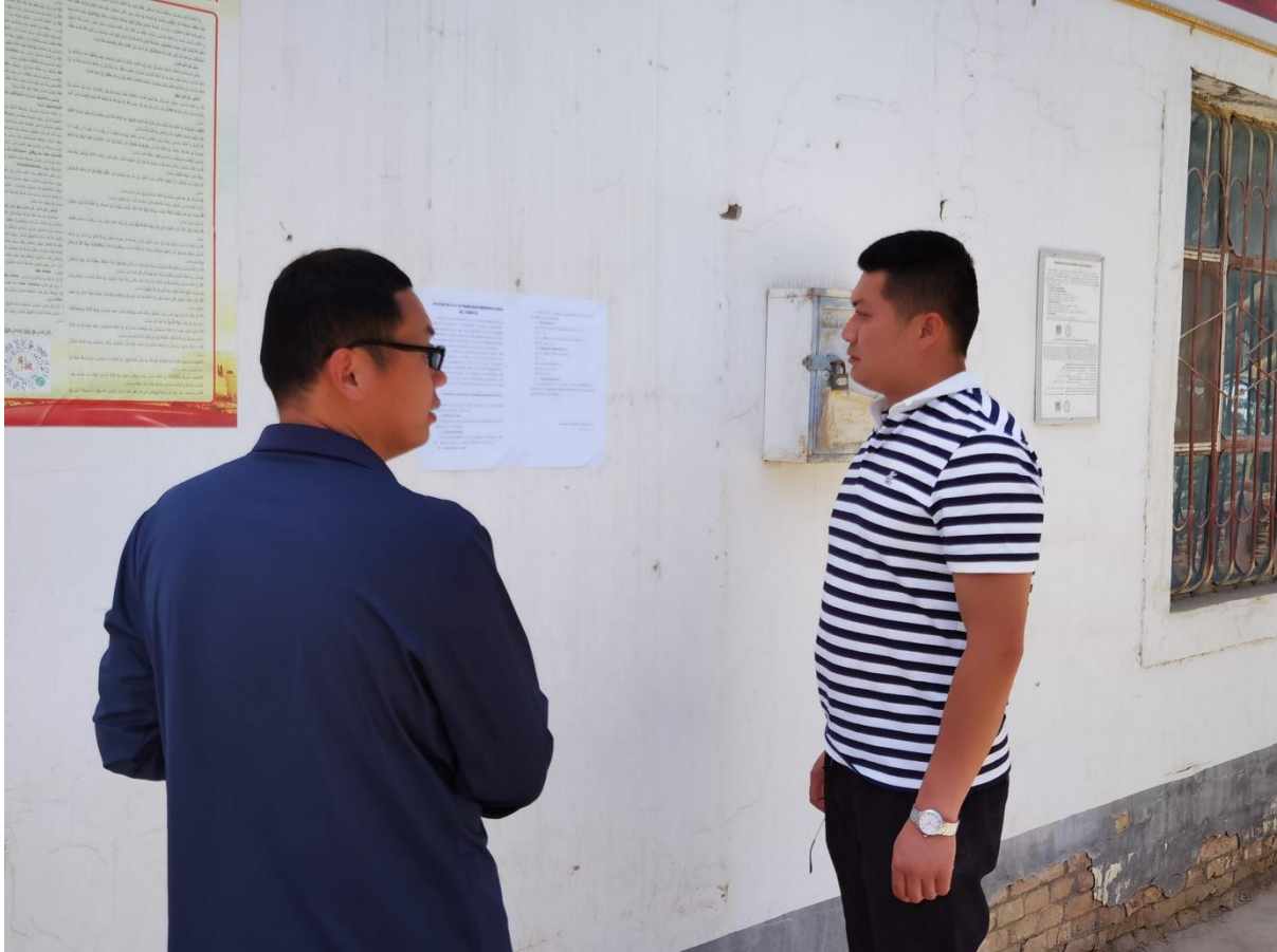
图 5 本项目张贴公示栏照片

在第二次公示期间，本项目在项目所在地公示栏进行了张贴公示，载体选择符合《环境影响评价公众参与办法》要求。张贴公示照片见图 5。