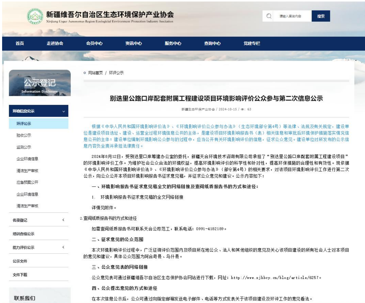
图 2 本项目征求意见稿网络公示截图