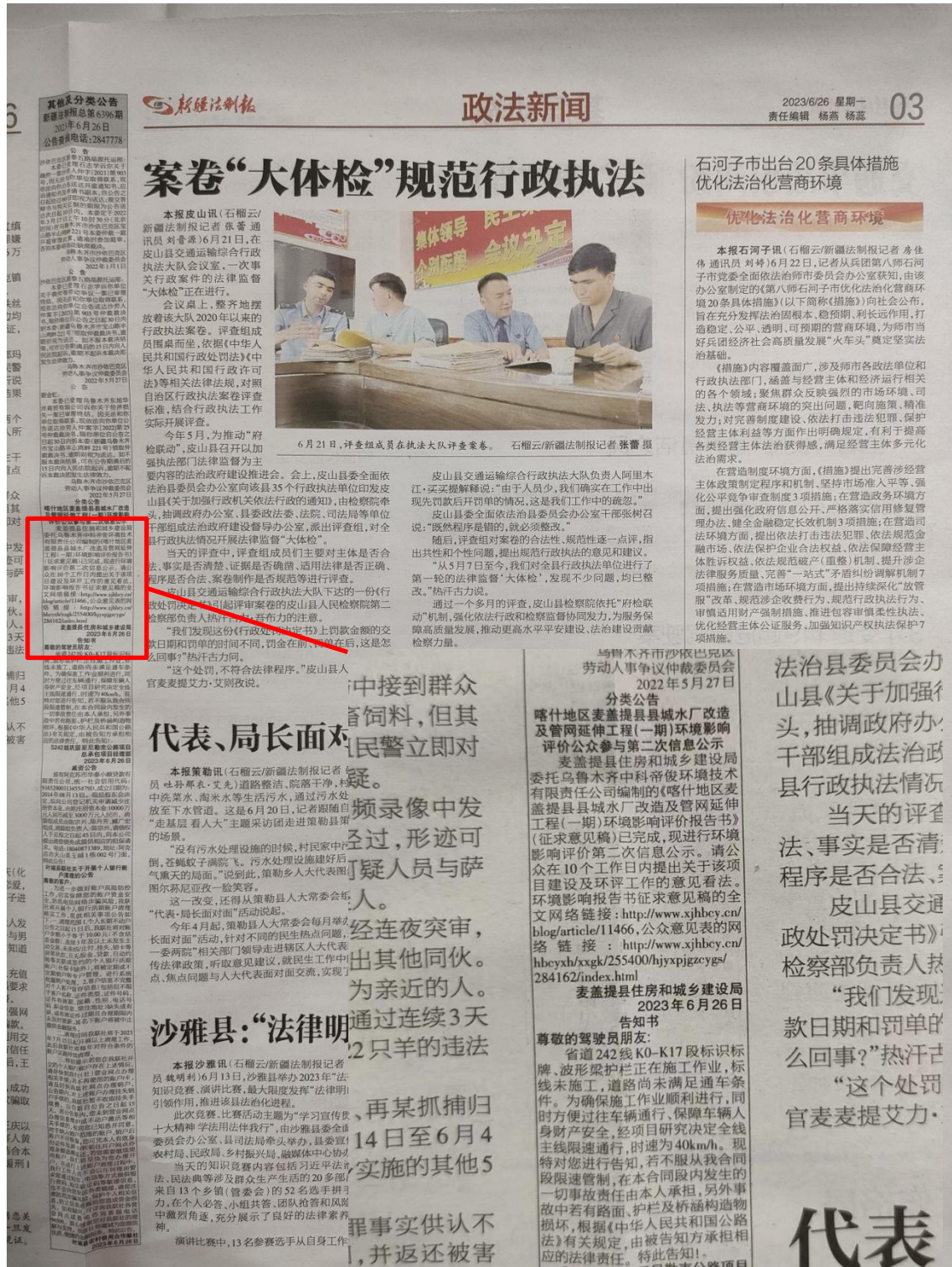
图3 2023年6月26日报纸公示（新疆法治报）

在网络公示的同时，麦盖提县住房和城乡建设局在新疆法治报（2023年6月26日和2023年6月27日）发布了项目环境影响报告书公示信息，报纸公示照片见图3、图4。