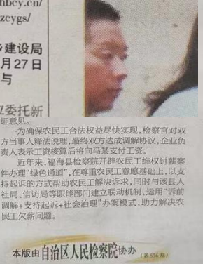
图4 2023年6月27日报纸公示(新疆法制报)