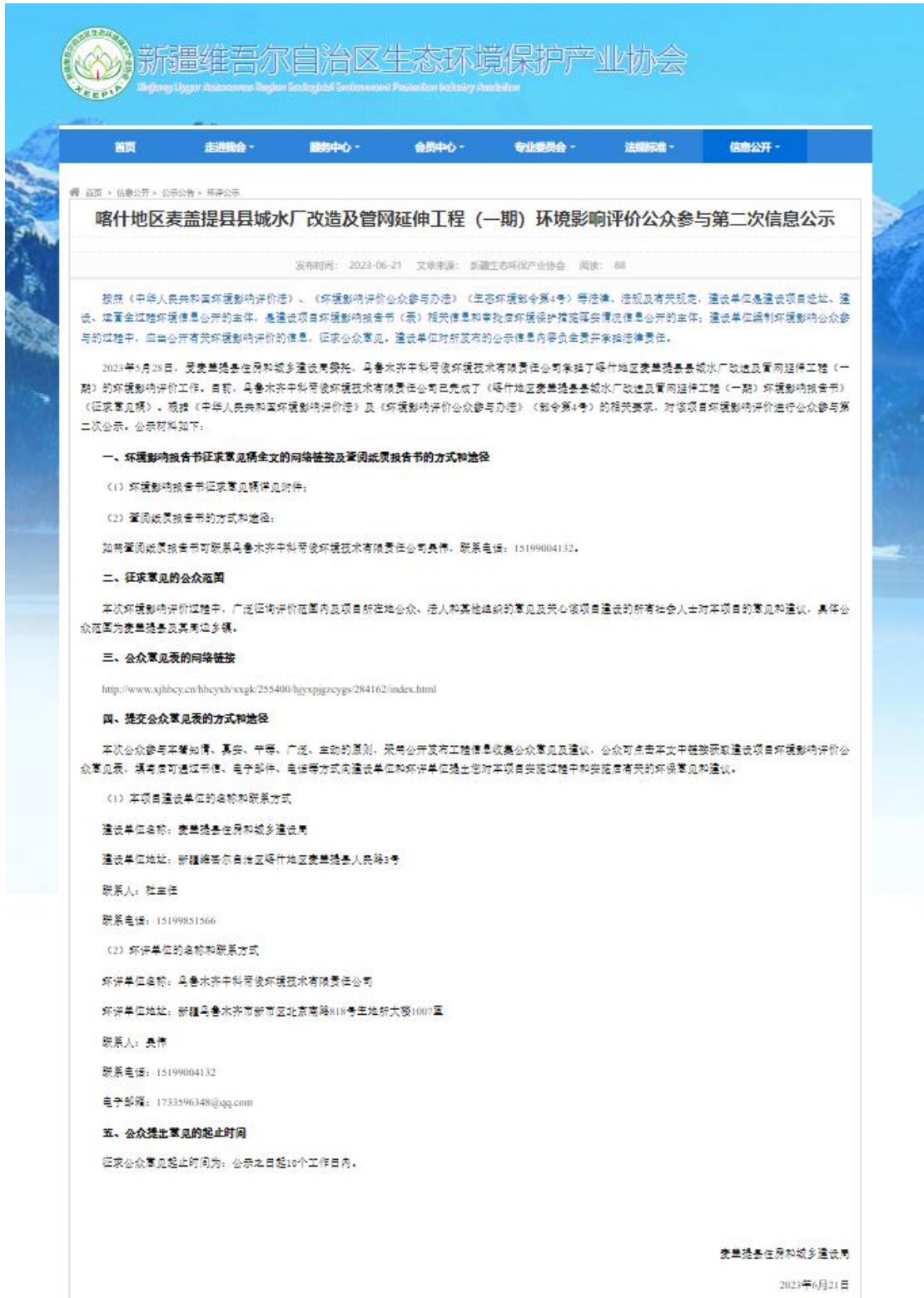
图2 第二次网络公示截图（新疆维吾尔自治区生态环境保护产业协会网站）