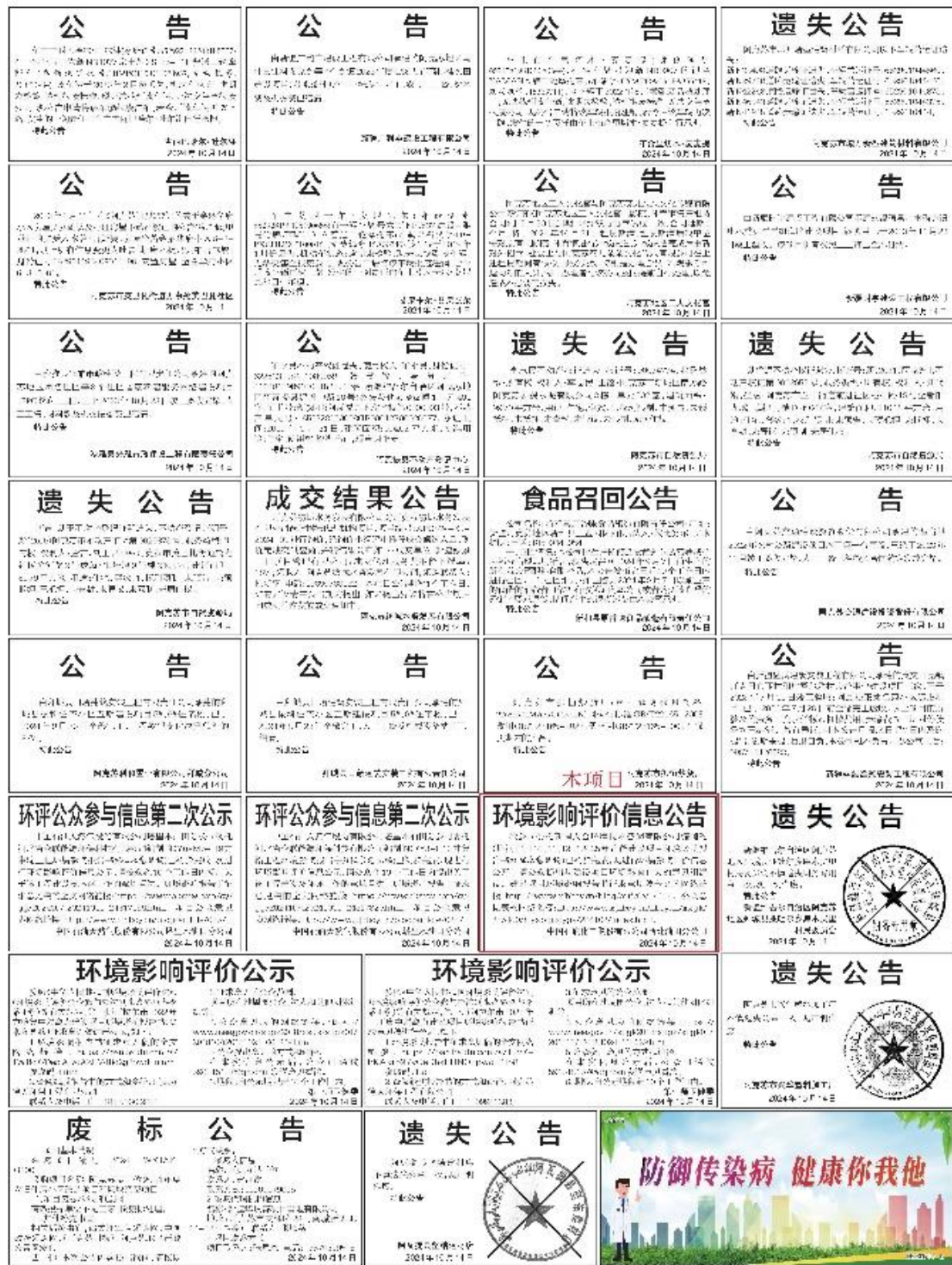
图 3.2-2 本项目第一次报纸公示照片