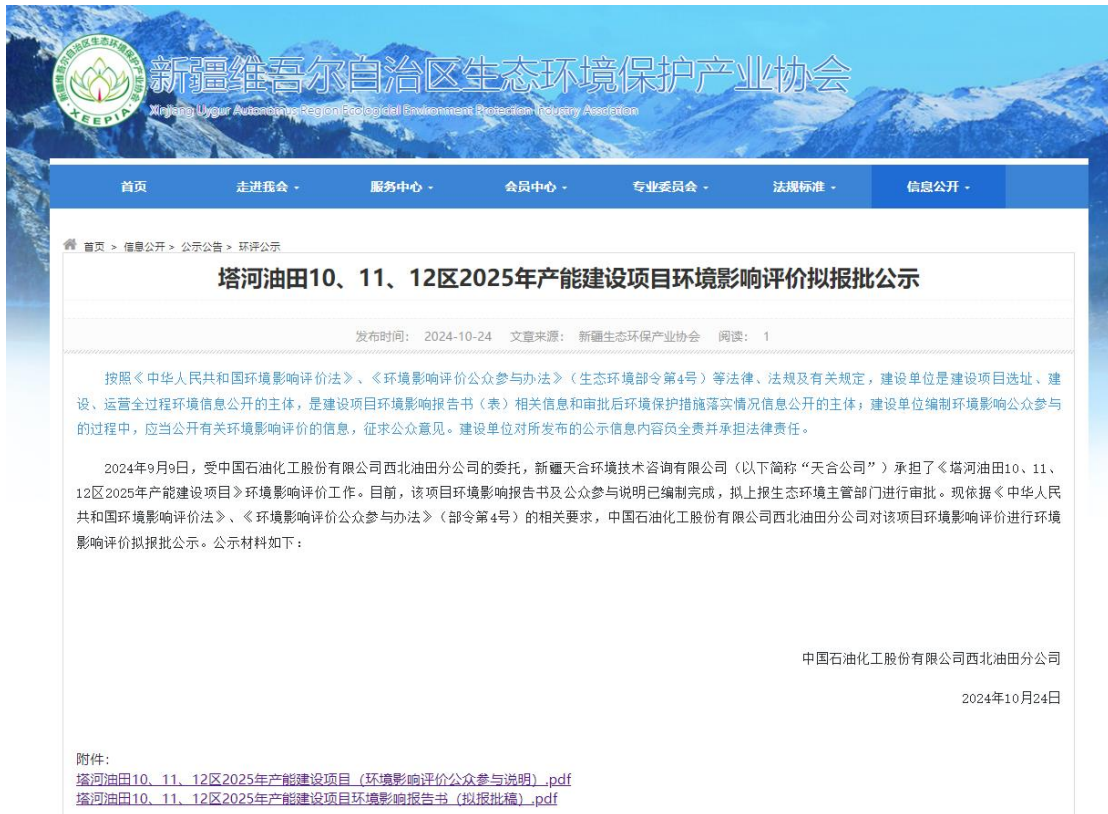
图 6.2-1 拟报批公示网页截图