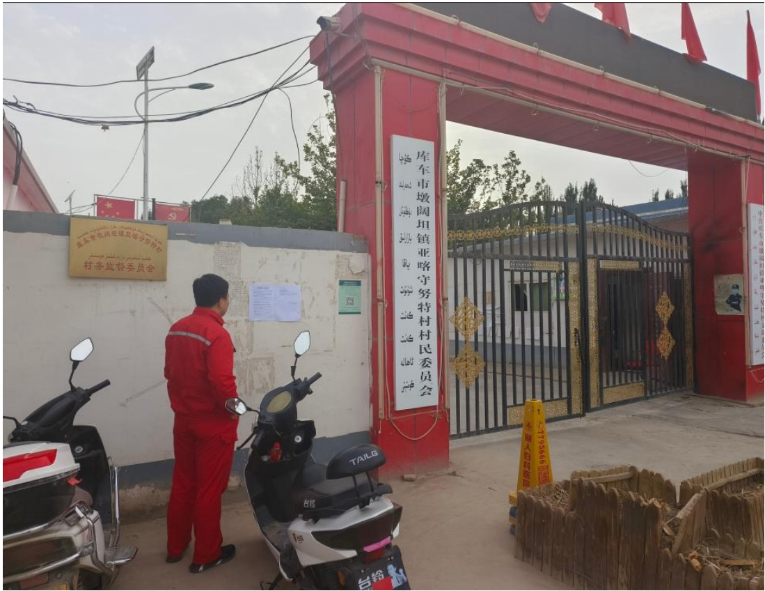
图 3.2-4 本项目张贴公示照片