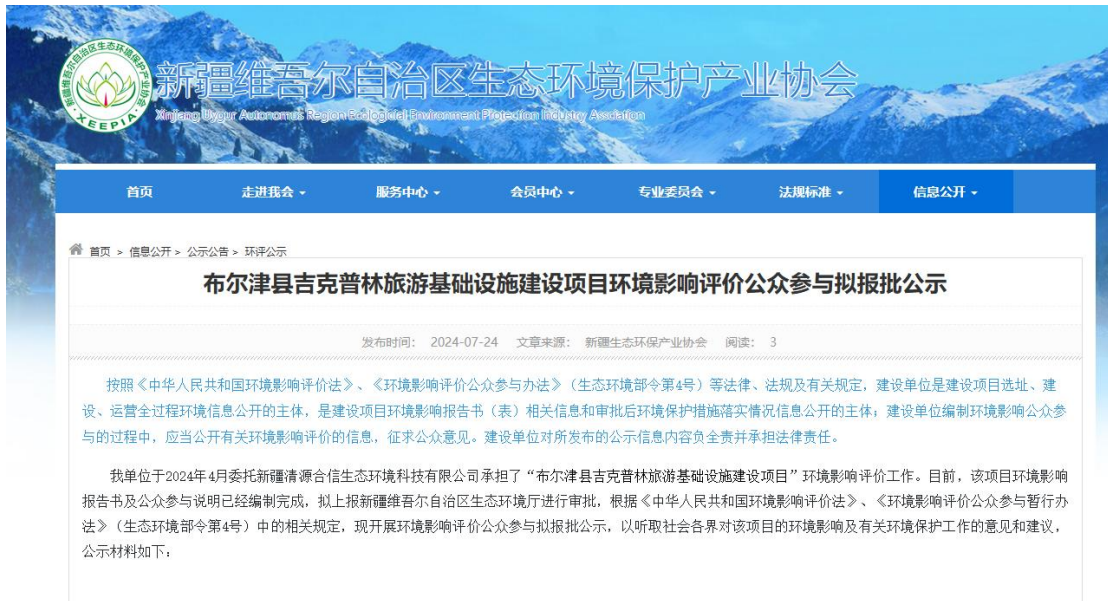
图 6 本项目拟报批网络公示截图