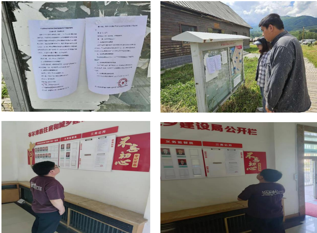
图5 本项目第二次公告照片