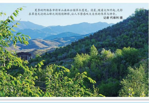
夏季的阿勒泰市将军山森林公园草木葱茏。清晨,随着太阳升起,光影在翠意无边的高峰之间悄悄挪移,让人不禁感叹大自然的伟岸与神奇。