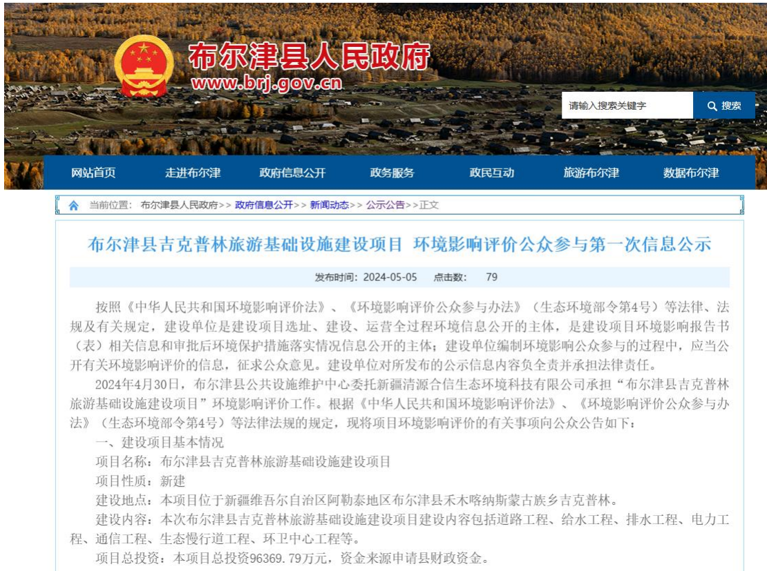
图 1 本项目第一次公告照片