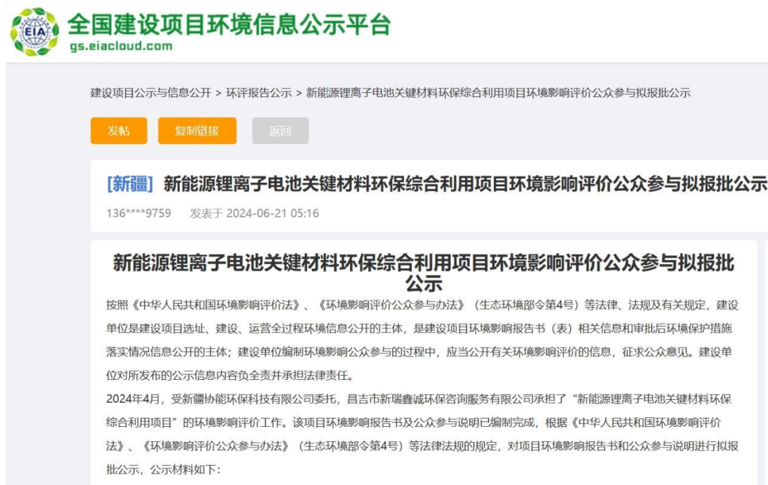
图6 本项目拟报批稿网络公示截图