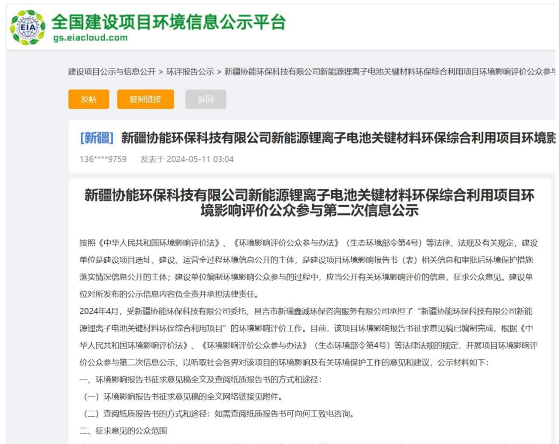
图2 本项目征求意见稿网络公示截图