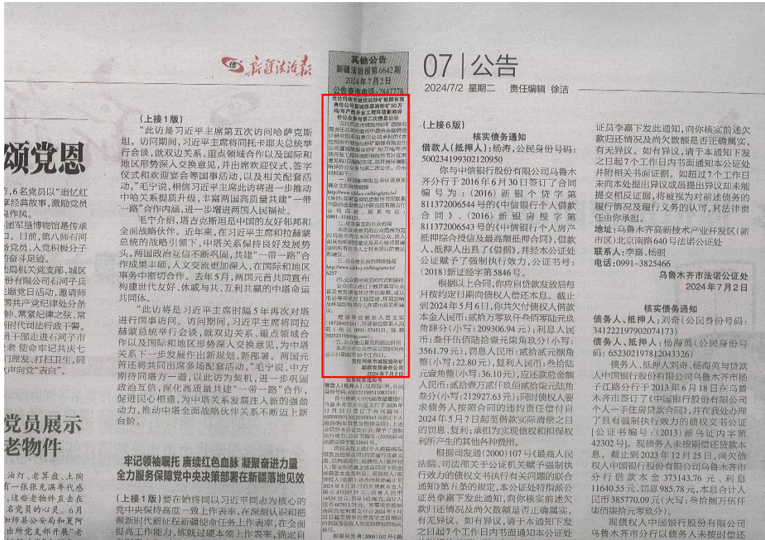
图 3-2 征求意见稿第一次报纸公示截图

克拉玛依市城投油砂矿勘探有限责任公司分别于2024年07月02日及2024年07月03日，在新疆法制报上对本项目的环境影响评价信息进行了两次公示，载体选择和公示时间符合《环境影响评价公众参与办法》要求。征求意见稿两次报纸公示截图见图3-2及图3-3。