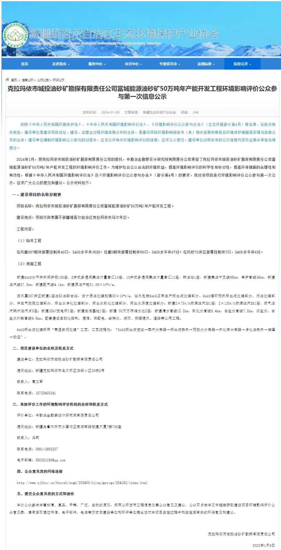
图 2-1 项目公众参与第一次信息公示截图