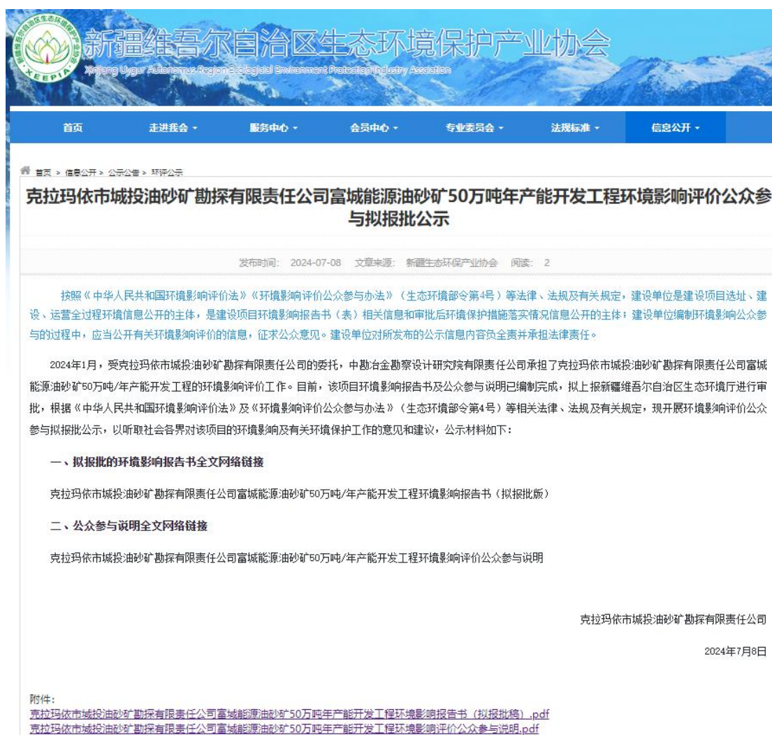
图 6-1 拟报批稿第三次网络公示截图

克拉玛依市城投油砂矿勘探有限责任公司于2024年07月08日在新疆维吾尔自治区生态环境保护产业协会网站刊登了项目第三次公众参与公示信息 ( http://www.xjhbcy.cn/blog/article/13703 ), 载体选择符合《环境影响评价公众参与办法》要求。公示截图详见图6-1。