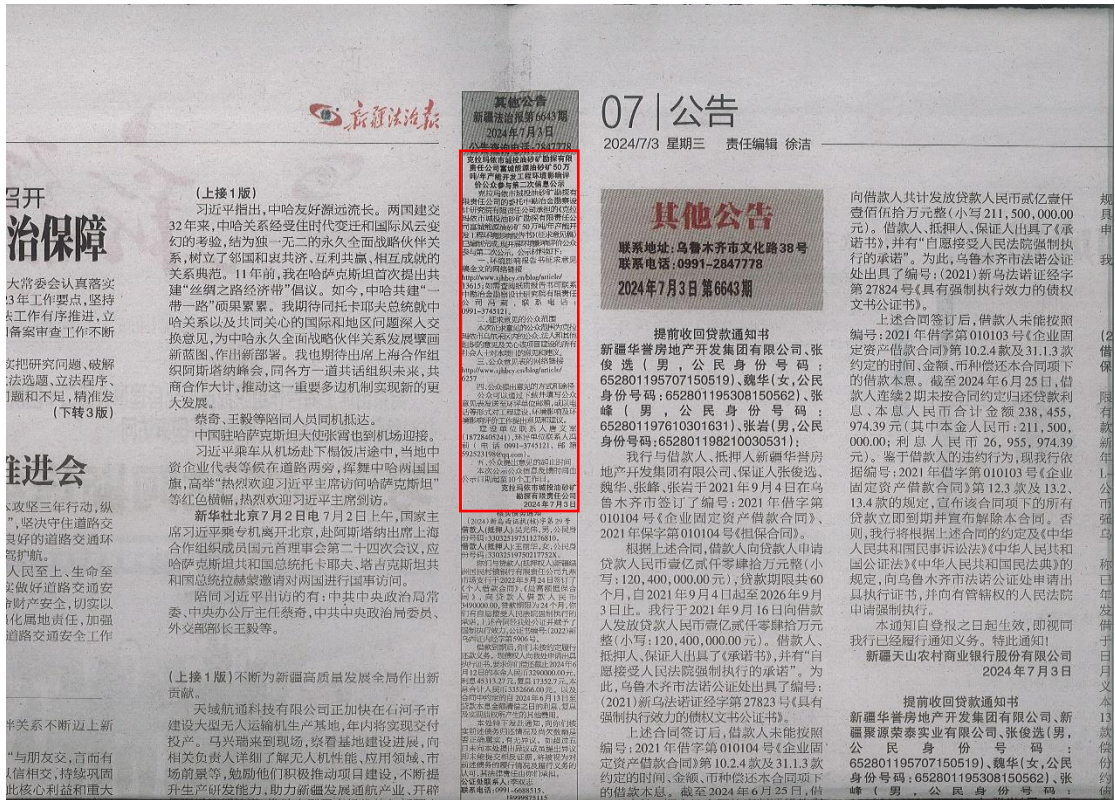
图 3-3 征求意见稿第二次报纸公示截图