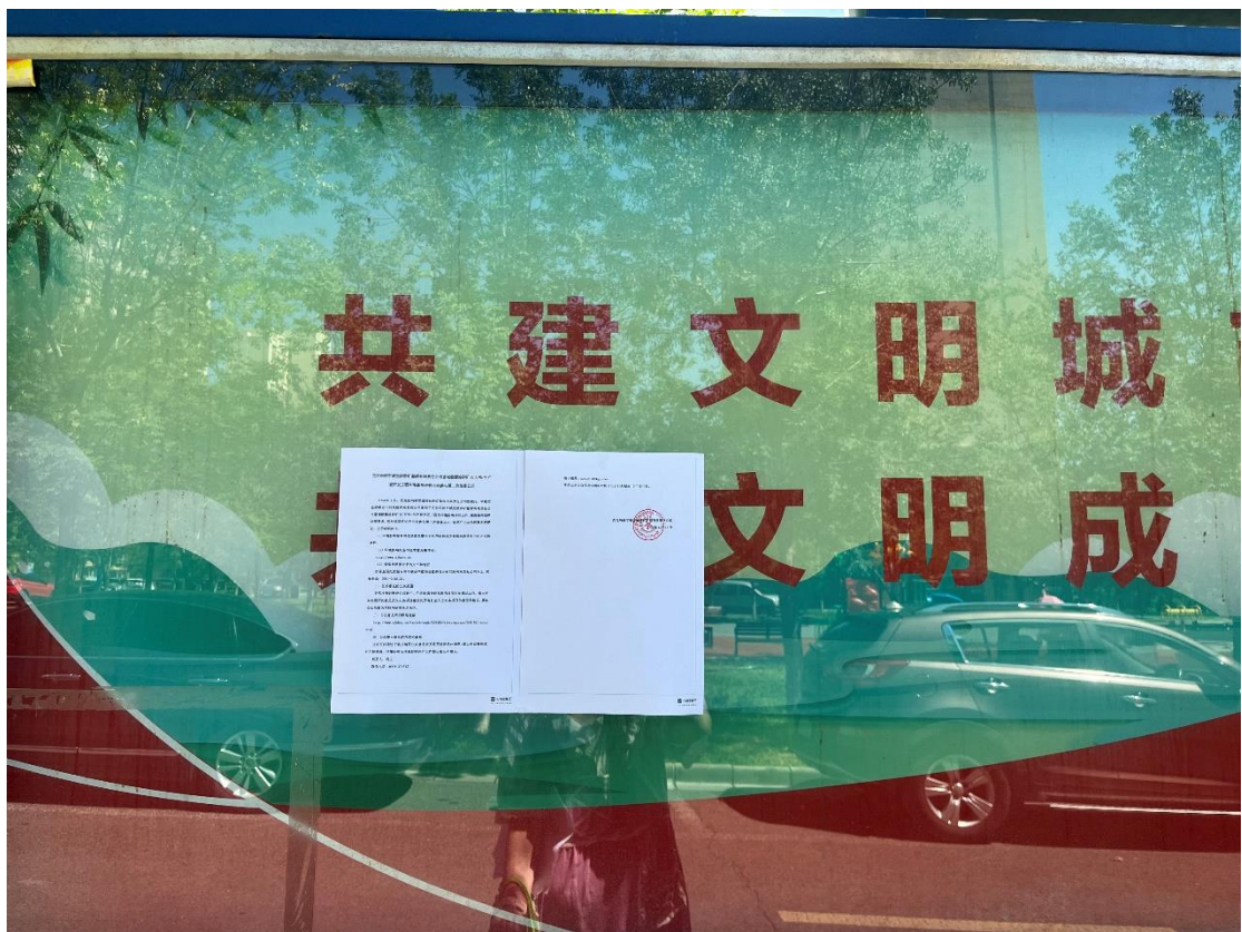
图 3-4 征求意见稿张贴公告公示截图 (b)