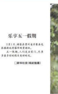
乐享五一假期 5月1日,游客在贵州丹寨苗寨民族村村寨游玩观瀑。五一假期,人们走出家门,尽享多彩的假日美好时光。

一是提升监测网络覆盖面。二是提升监测数据质量。三是提升监测技术支撑能力。四是提升监测数据应用能力。五是提升监测体系建设水平。