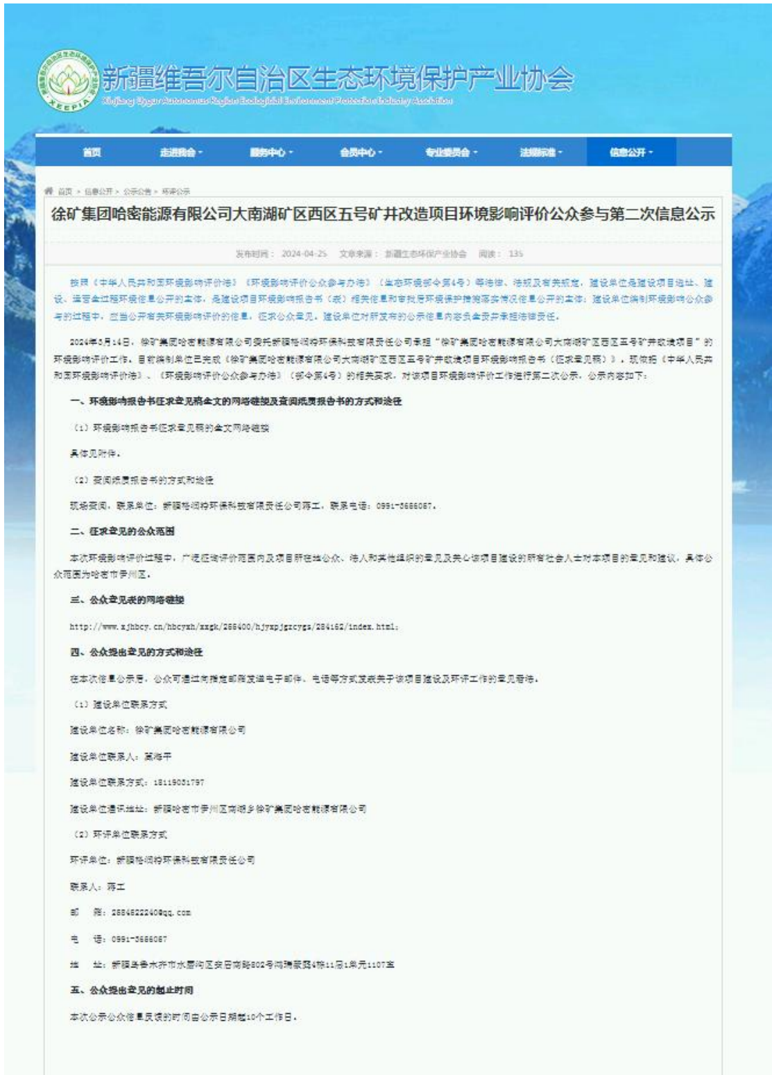
图 2 本项目征求意见稿网络公示截图