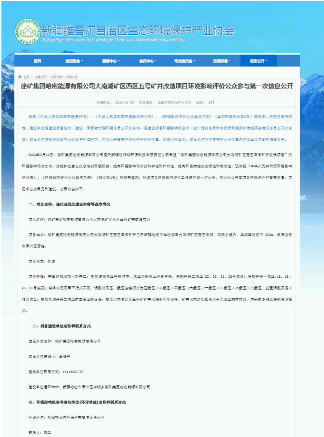
图 1 本项目第一次网络公示截图