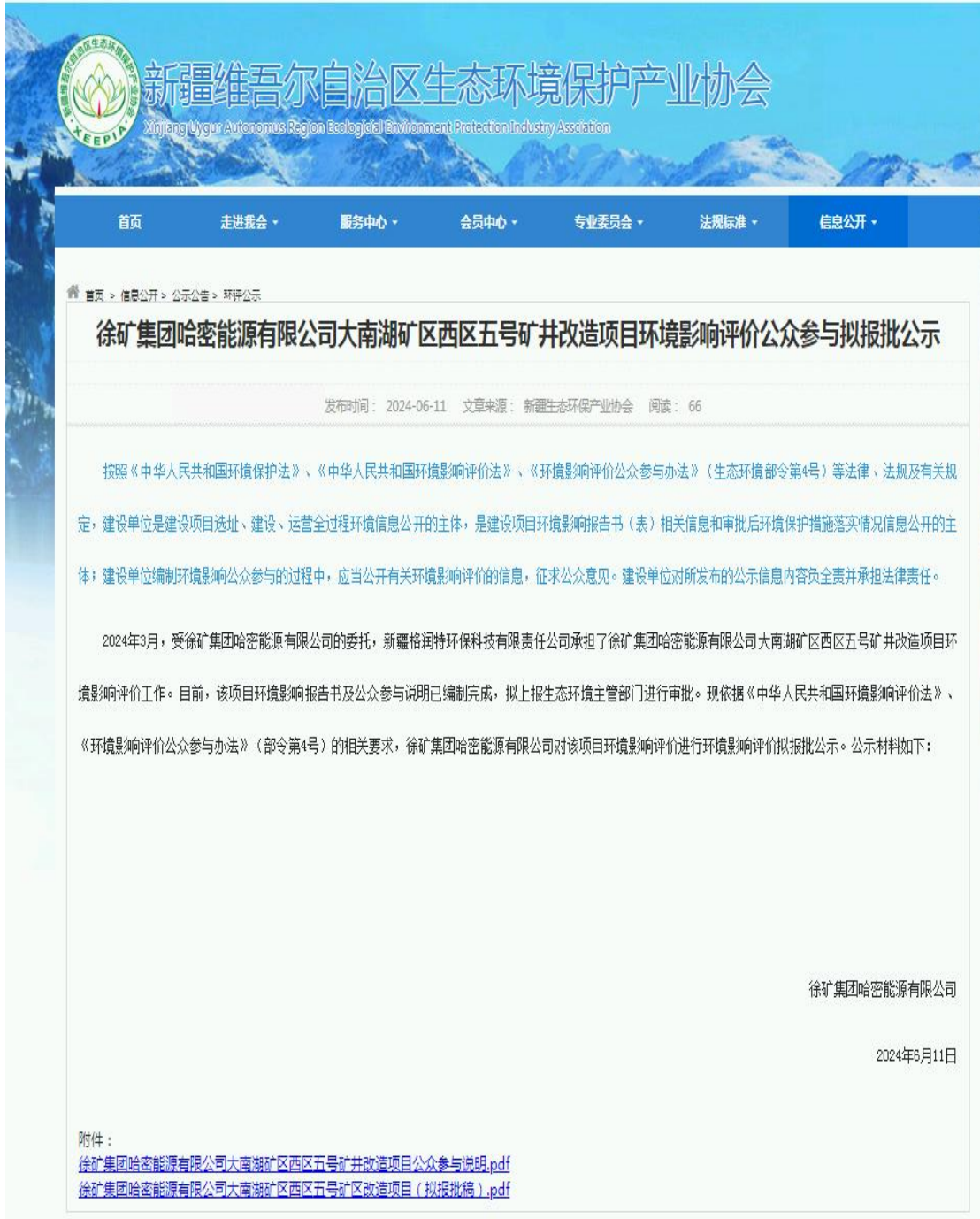
图 6 本项目征求意见稿网络公示截图