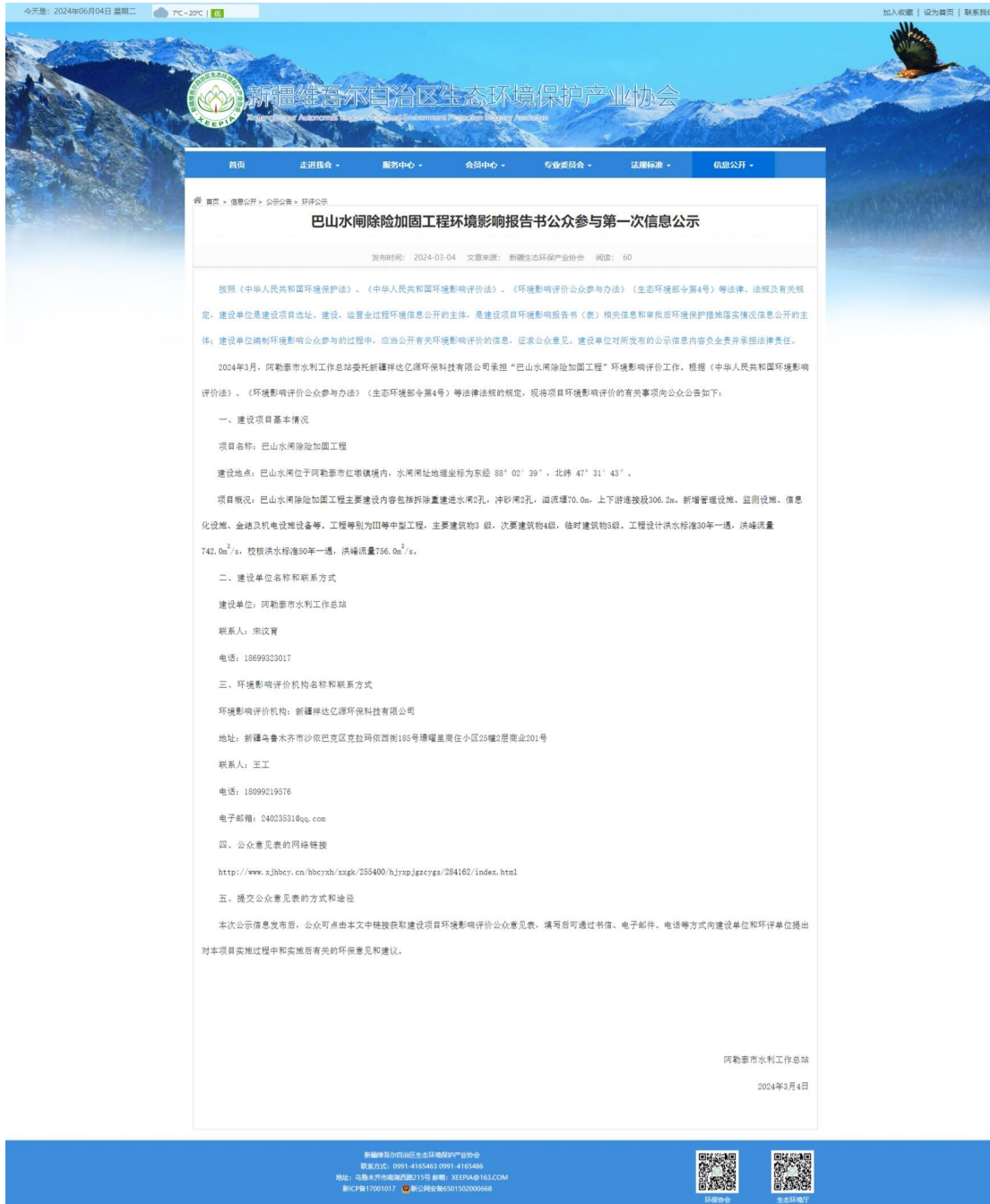
图 2.2-1 一次公示网络截图

本项目的首次公示是在新疆维吾尔自治区生态环境保护产业协会 ( http://www.xjhbcy.cn/blog/article/13030 ) 上进行的, 网页页面截图见图 2.2-1。