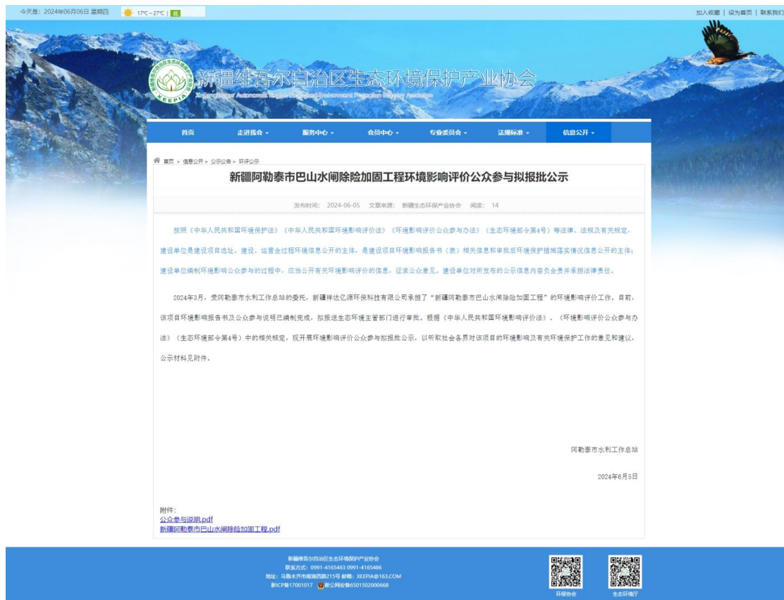
图 6.2-1 拟报批公示截图