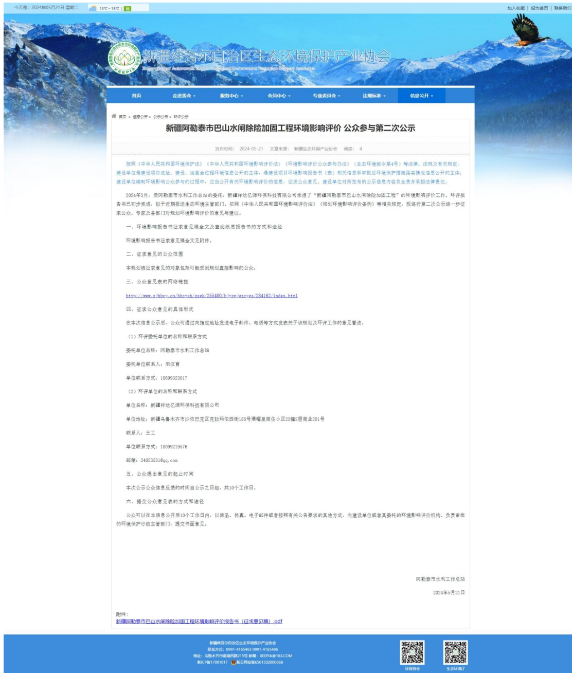
图 3.2-1 征求意见稿网上公示截图