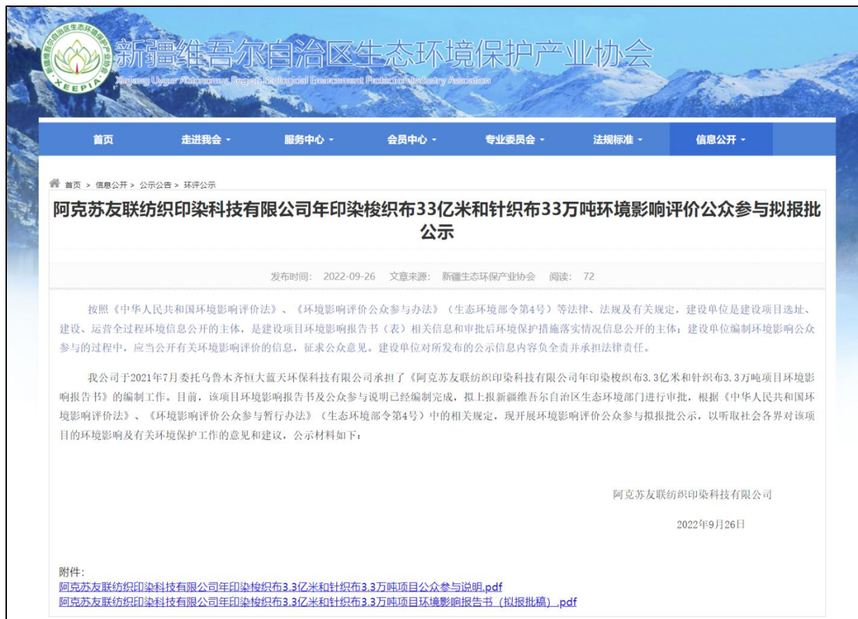
图 6 项目报批前网络公示截图

本次报批前公开方式为网络公开，公开时间为2022年9月26日，公开网站为新疆维吾尔自治区生态环境保护产业协会网站，选择该网站进行公示符合《环境影响评价公众参与办法》要求。报批前网络公示截图如下：