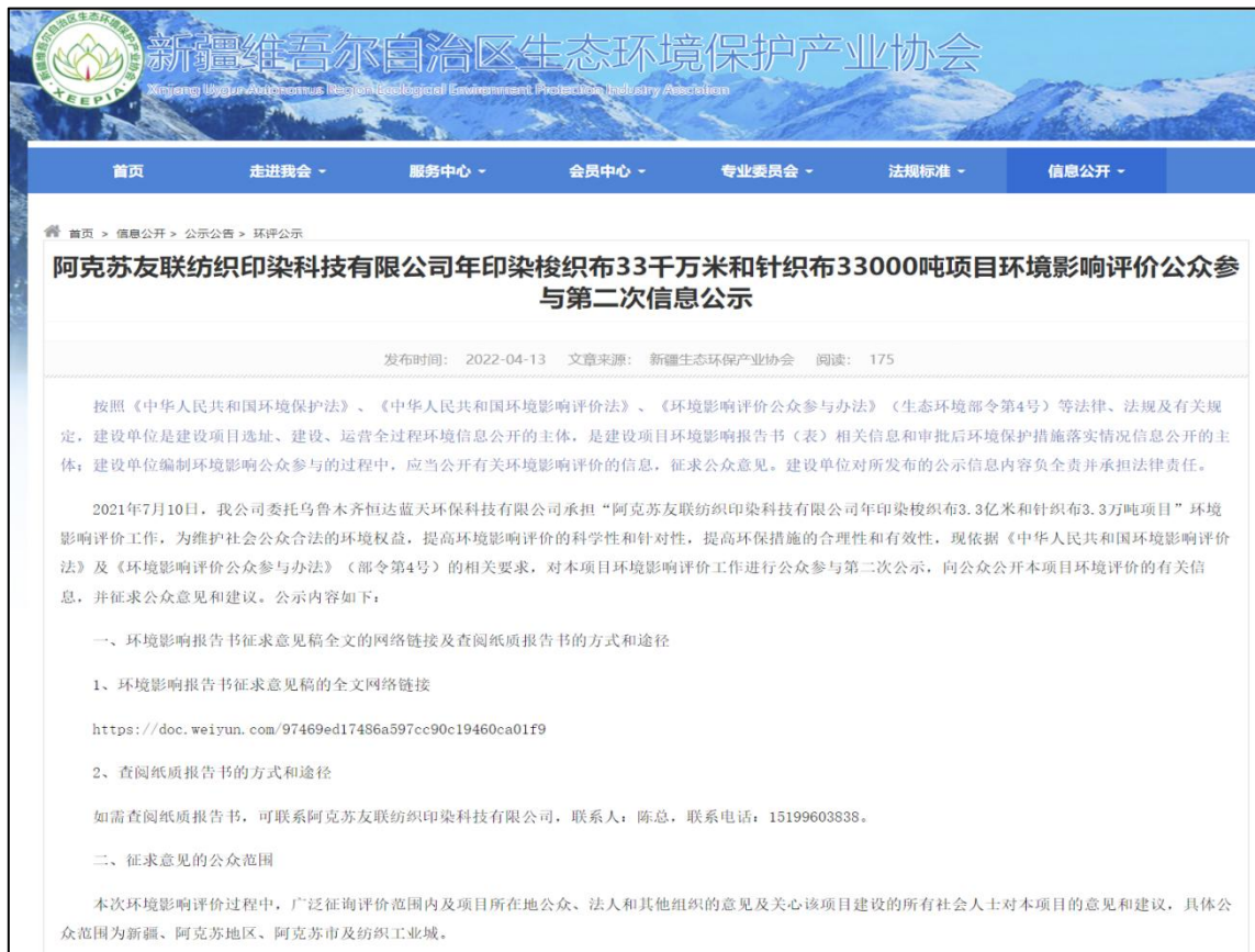
图 2 项目第二次公众参与公示截图

阿克苏友联纺织印染科技有限公司于 2022 年 4 月 13 日新疆维吾尔自治区生态环境保护产业协会（ http://www.xjhbcy.cn/blog/article/9246 ）开展环境影响评价信息公告，向公众告知征求意见稿及其网络公众意见调查表的相关信息。，载体选择符合《环境影响评价公众参与办法》要求。公示截图详见下图 2。