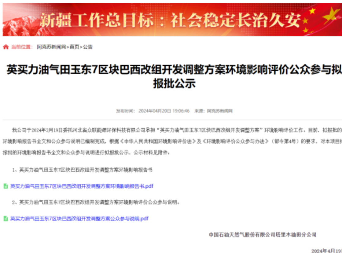
图 6-1 报批前网络公示截图

本次报批前公开方式为网络公开，公开时间为2024年4月19日( http://www.aksxw.com/sy/gg/202404/t20240420_20505121.html )，公开网站为《阿克苏新闻网》，该网站访问流量较大，且可以上传并公开项目环境影响报告书全本，选择该网站进行公示符合《环境影响评价公众参与办法》要求。报批前网络公示截图见图6-1。