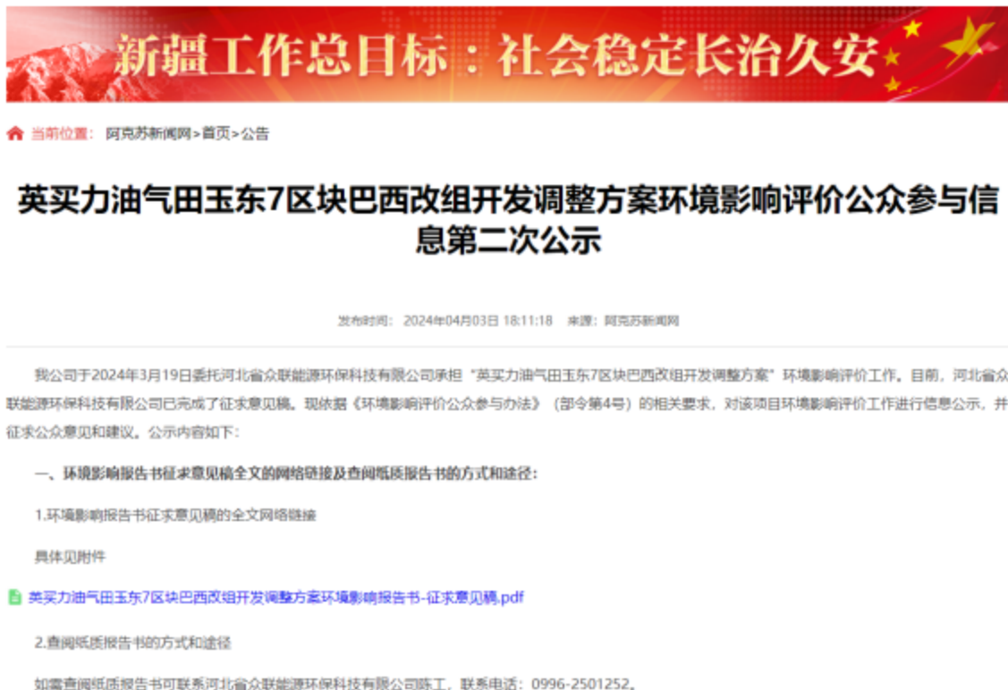
图 3-1 第二次信息公示情况

我公司在《阿克苏新闻网》( http://www.aksxw.com/sy/gg/202404/t20240403_20181535.html )上发布了征求意见稿公示信息,对环境影响报告书征求意见稿全文进行公开,公示时限为10个工作日,网站第二次公示网络截图见图3-1。