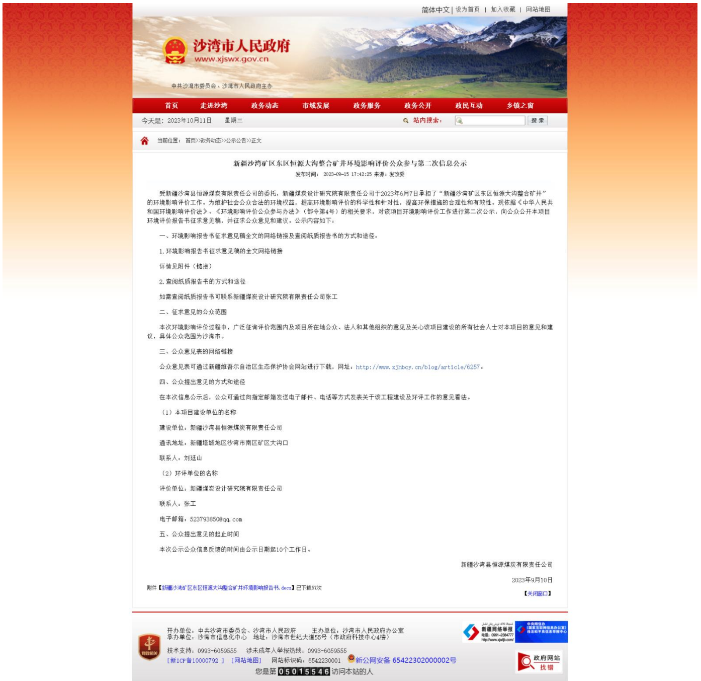
图 3.2-1 征求意见稿网上公示截图