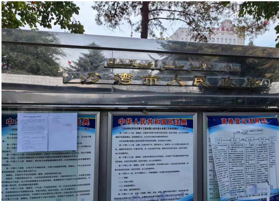
沙湾市政府公告栏

张贴地点选在沙湾市政府公告栏、东湾镇和倭什窑村公告栏。现场张贴时间为2023年9月15日，公示时限为自公示之日起10个工作日。征求意见稿环评信息现场张贴情况详见图3.2-4。