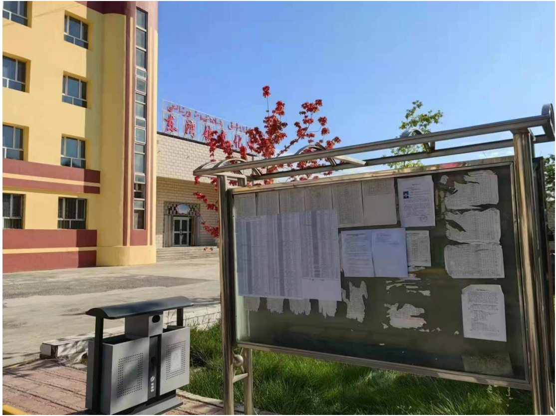
东湾镇政府公告栏