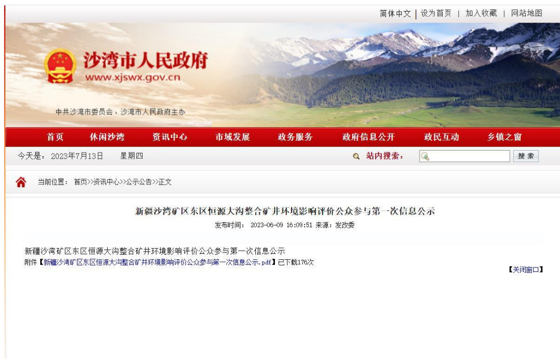
图 2.2-1 第一次公众参与网络公示截图