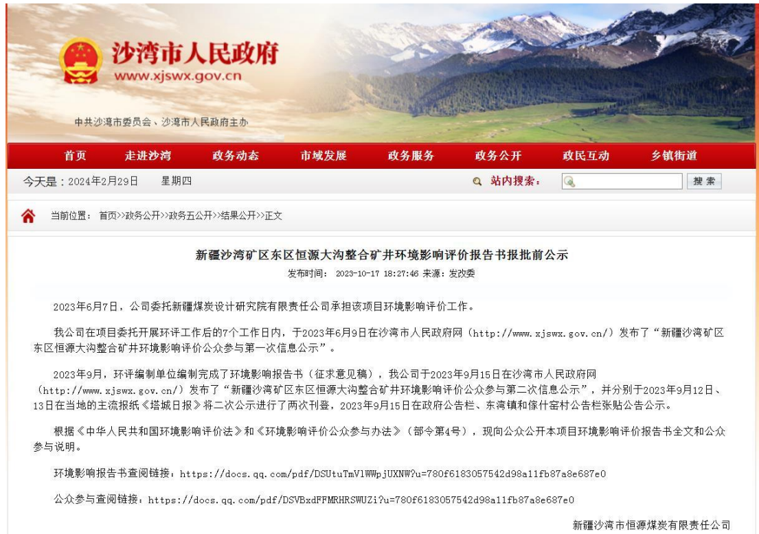
图 6.2-1 报批前公示截图

在沙湾市人民政府网（ http://www.xjswx.gov.cn/ ）进行了项目报批前公示，项目所在地及其他所在个人或团体均可查阅，载体选择合理可行。网络公开时间、网址及截图见图 6.2-1。