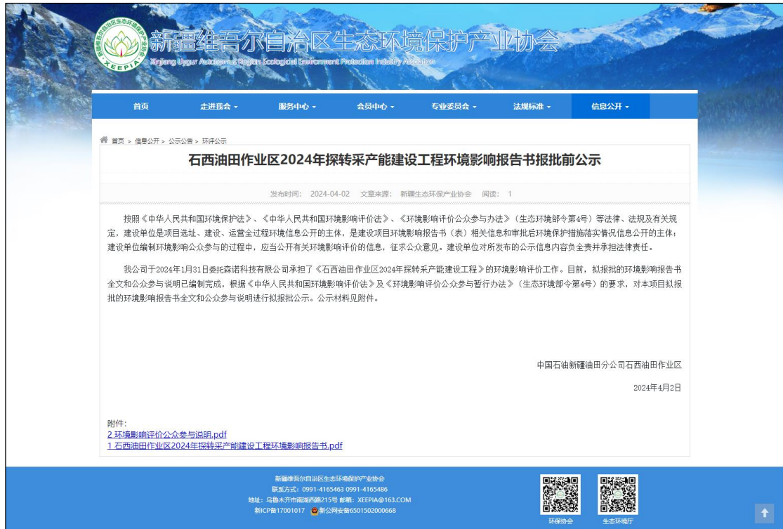
图 6 环境影响评价报批前公示