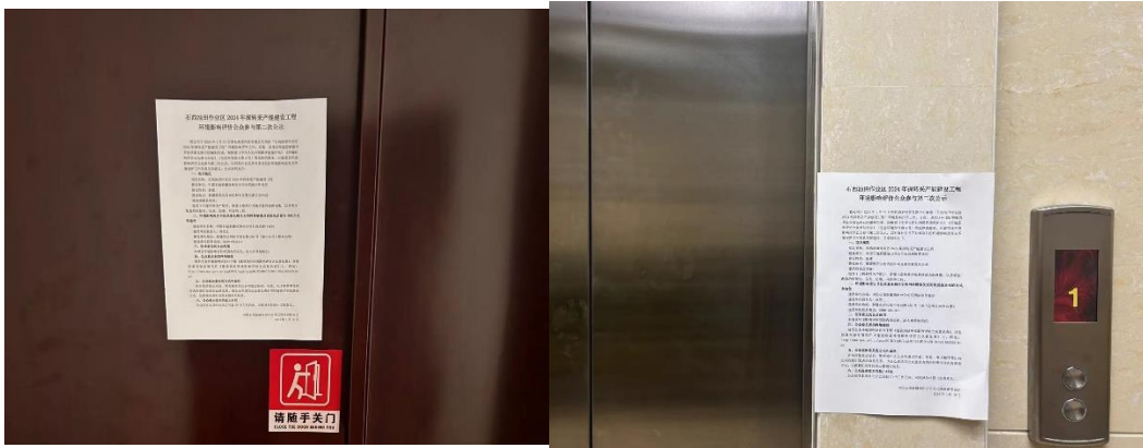
图 3 环境影响评价第二次信息张贴公示