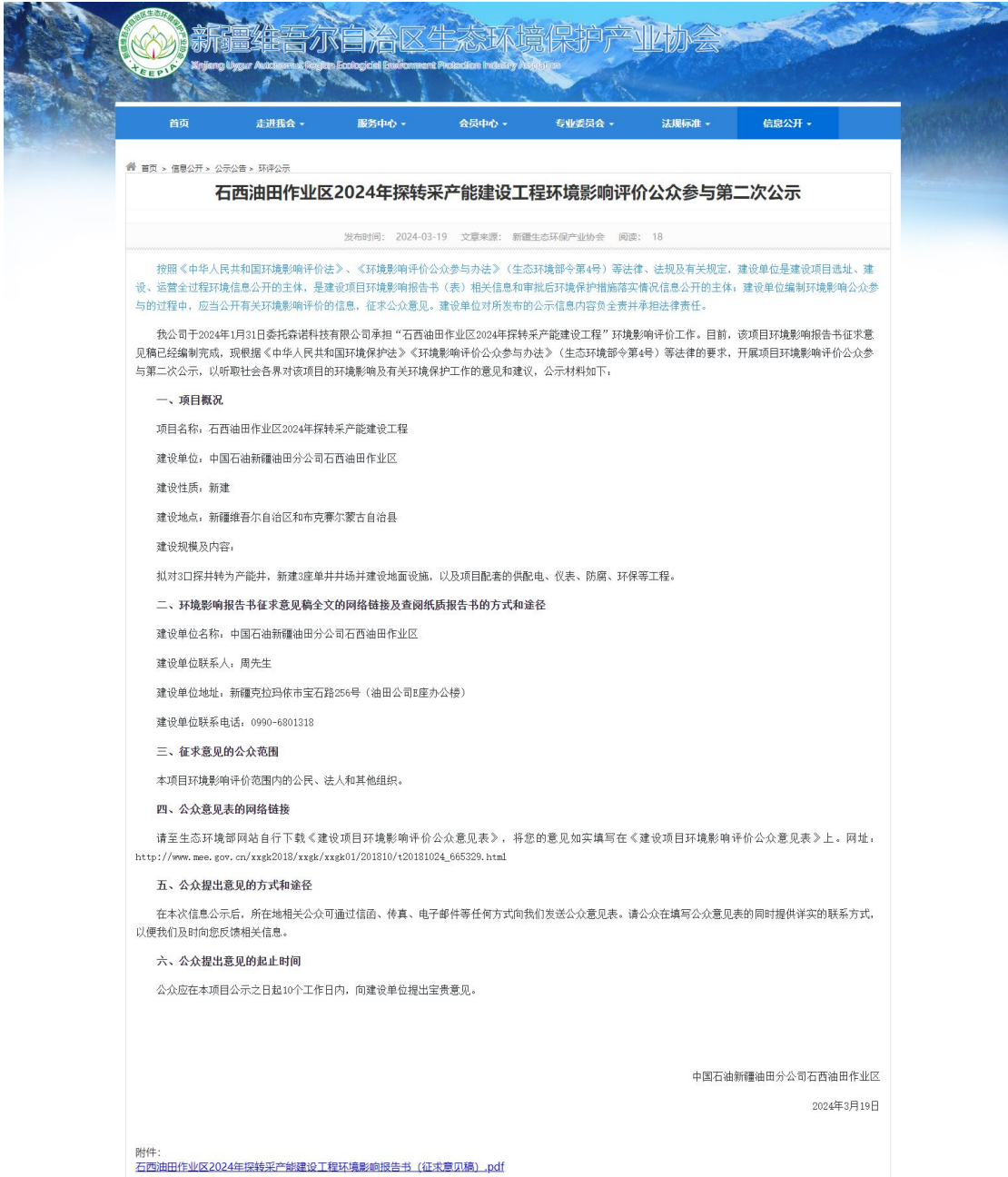
图 2 环境影响评价第二次信息网络公示截图