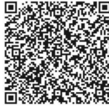
巴州慈善总会(捐款二维码)