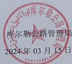
图 3.2.3 征求意见稿信息张贴公开照片