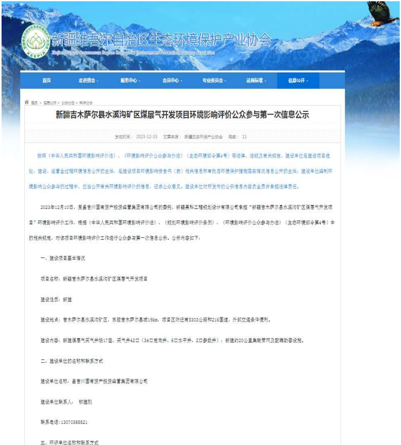
图 2-1 第一次网络公示截图