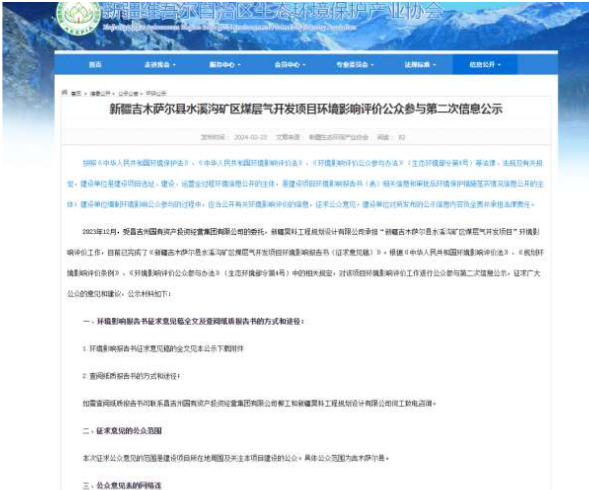
图 3-1 第二次网络公示截图