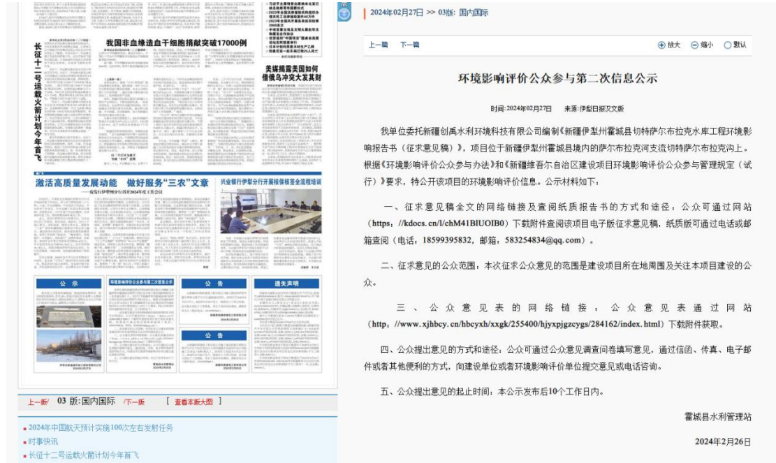
图3 2023年11月9日报纸公示

在网络公示的同时，我单位在伊犁日报（2024年2月27日和2024年2月29日）、发布了项目环境影响报告书公示信息，报纸公示照片件图3、图4。