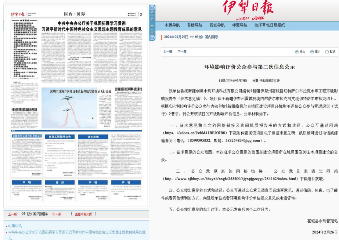
图4 2023年11月10日报纸公示