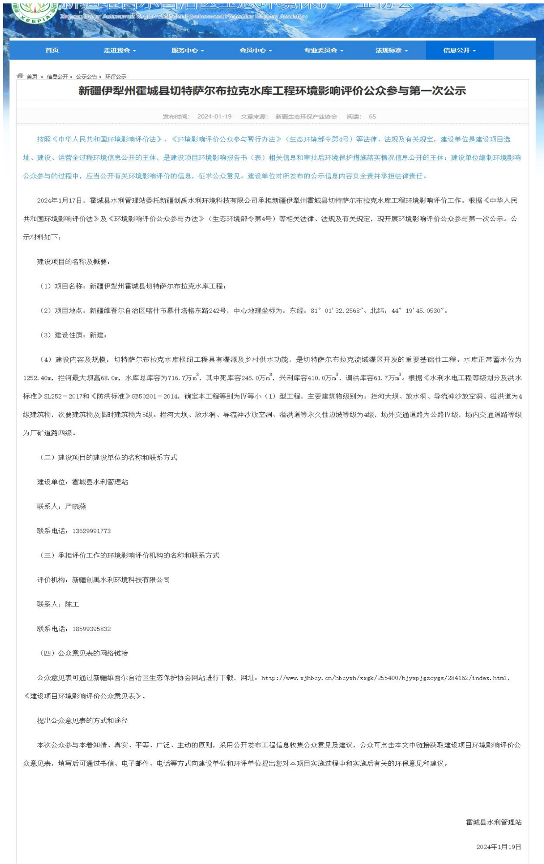
图 1 第一次网络公示截图(新疆维吾尔自治区生态环境保护产业协会网)