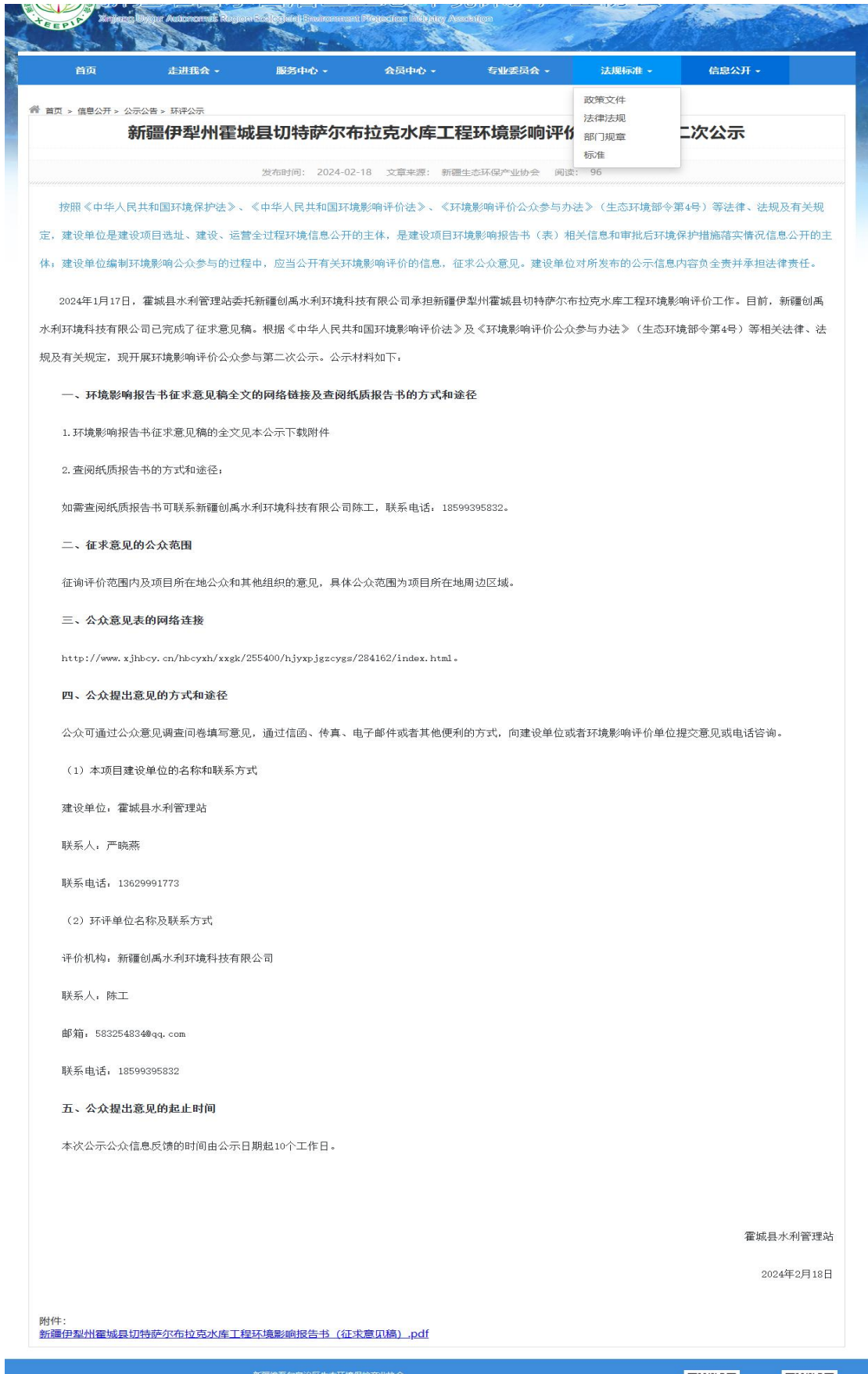
图2 第二次网络公示截图