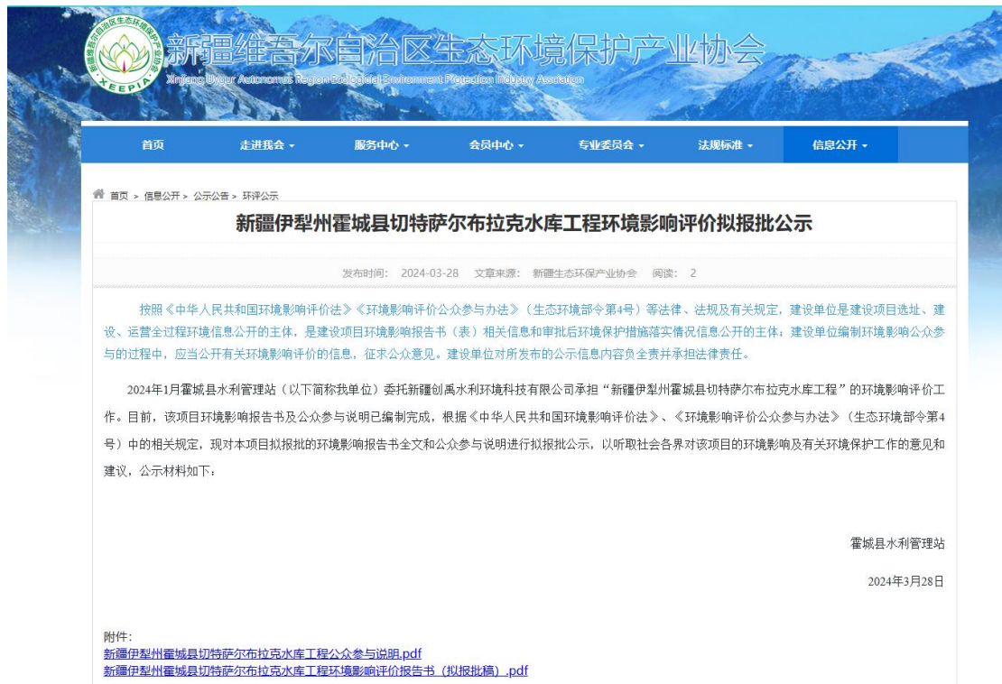
图 6 拟报批公示网络截图

公开网站为新疆维吾尔自治区生态环境保护产业协会 ( http://www.xjhbcy.cn/blog/article/13168 ),该网站在当地有较大的知名度,访问流量较大,上传并公开了项目环境影响报告书全本及公众参与说明,选择该网站进行公示符合《环境影响评价公众参与办法》要求。