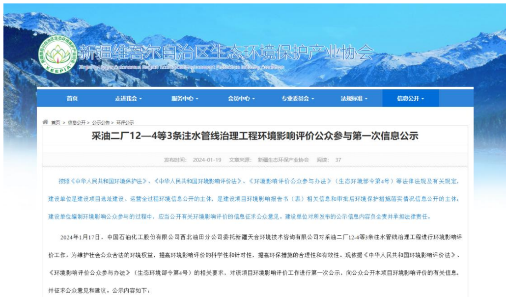
图2.2-1 本项目第一次网络公示截图

中国石油化工股份有限公司西北油田分公司在新疆维吾尔自治区生态环境保护产业协会网站开展网络公示，载体选择符合《环境影响评价公众参与办法》要求。公示链接： http://www.xjhbcy.cn/blog/article/12812 ，网络公示截图见图2.2-1。