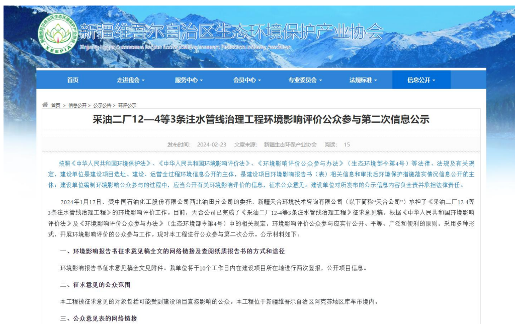
图3.2-1 本项目征求意见稿网络公示截图