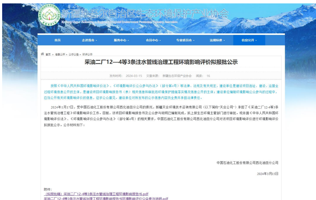
图6-1 环境影响评价报批前公示截图

公告网址： http://www.xjhbcy.cn/blog/article/13095 ；报批前网络公示截图见图6-1。