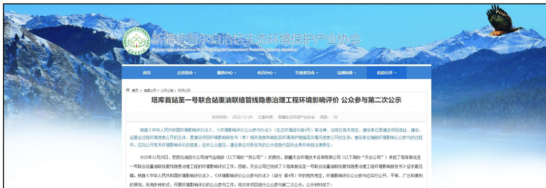
图 2 本项目征求意见稿网络公示截图