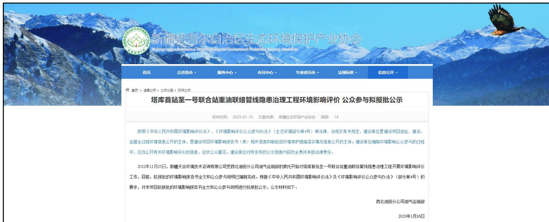
图 6 征求意见稿网络公示截图