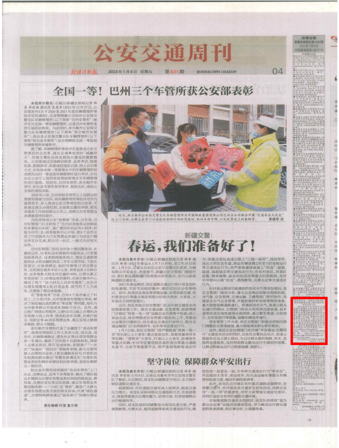
图3 第一次报纸公示——新疆法制报公示页面

在第二次网络公示期间，西北油田分公司油气运销部分别于2023年1月6日及2023年1月11日，在新疆法制报对项目的环评评价信息进行了两次公告。