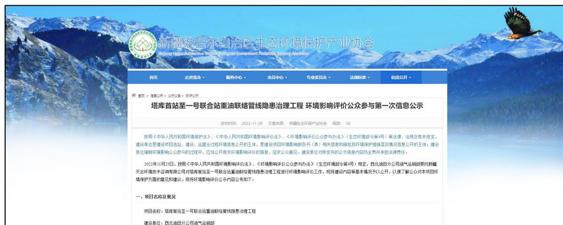
图 1 本项目第一次网络公示截图