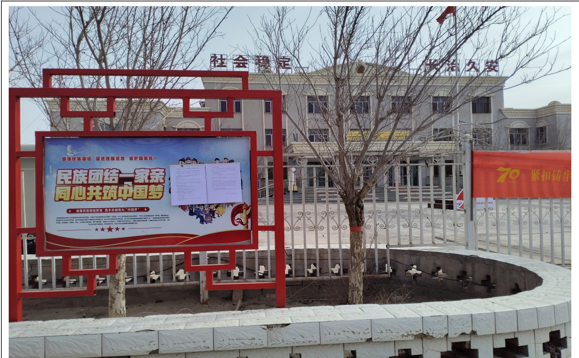
伊州区南湖乡人民政府张贴

在第二次公示期间，我在项目所在地的伊州区南湖乡人民政府、伊州区二堡镇人民政府张贴了项目第二次公众参与信息公示，载体选择符合《环境影响评价公众参与办法》要求。