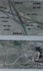
图4 本工程第二次登报公示截图

致广大群众及司机朋友: 因G30连霍高速公路改扩建 项目建设,涉及骆驼圈子互通A 匝道和G匝道拆除移位新建,需 要封闭A、G匝道,给您出行带来 的不便,敬请谅解,请您提前合 理规划出行路线。 一、施工项目: 骆驼圈子互通A匝道、G匝道 拆除重建。 二、封闭路段: 1.骆驼圈子互通A匝道,星星 峡至S328方向; 2.骆驼圈子互通G匝道, S22至哈密方向。 三、绕行提示: 1.星星峡至S328方向下高 速公路路口处封闭,车辆由星星峡 向明水方向行驶,在骆驼圈子收 费站处掉头通行; 2.S22上G30高速公路路口 处封闭,车辆由S22直行向明水方 向,至骆驼圈子收费站处绕行,经 骆驼圈子互通立交上高速; 3.其余方向车辆正常通行。 四、封闭期限: 自2026年3月24日零时至 2026年6月30日24时。 中交第二公路工程局有限公司 G30连霍高速公路星星峡至哈密段 改扩建工程XHGJ-4标项目经理部 2026年3月19日