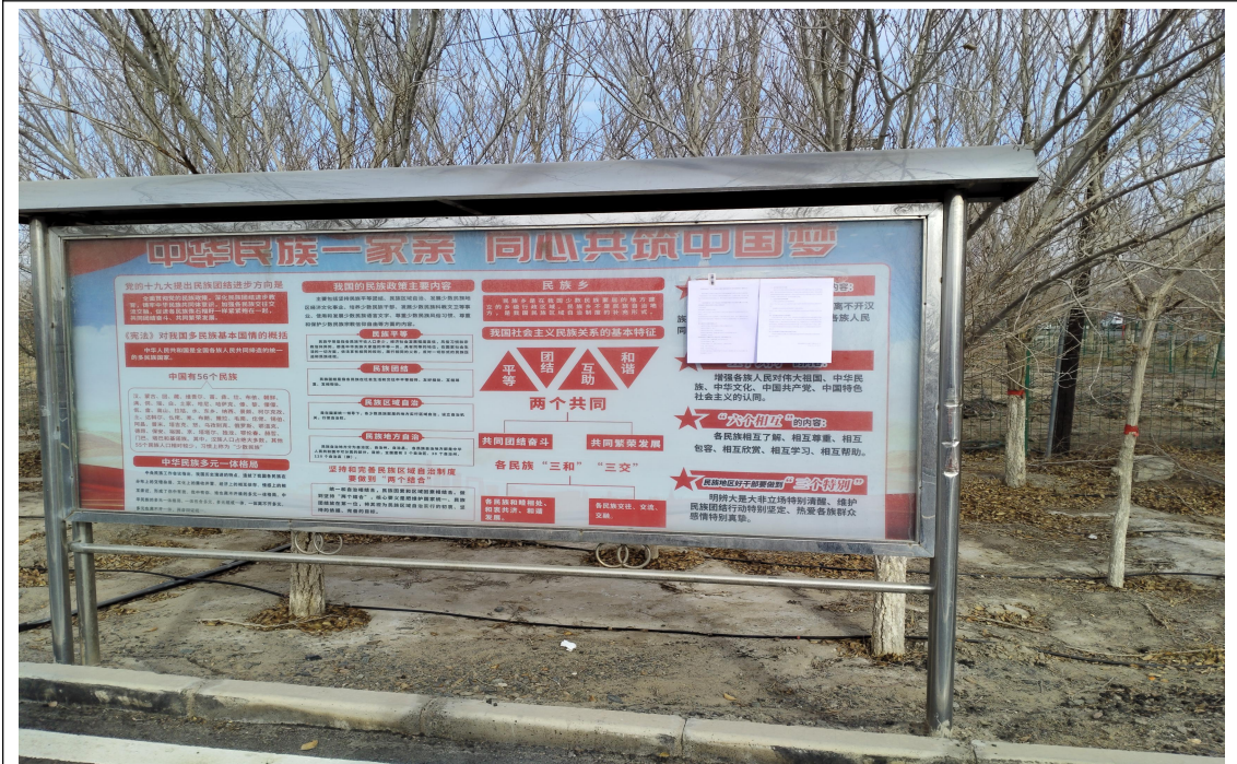
伊州区二堡镇人民政府张贴