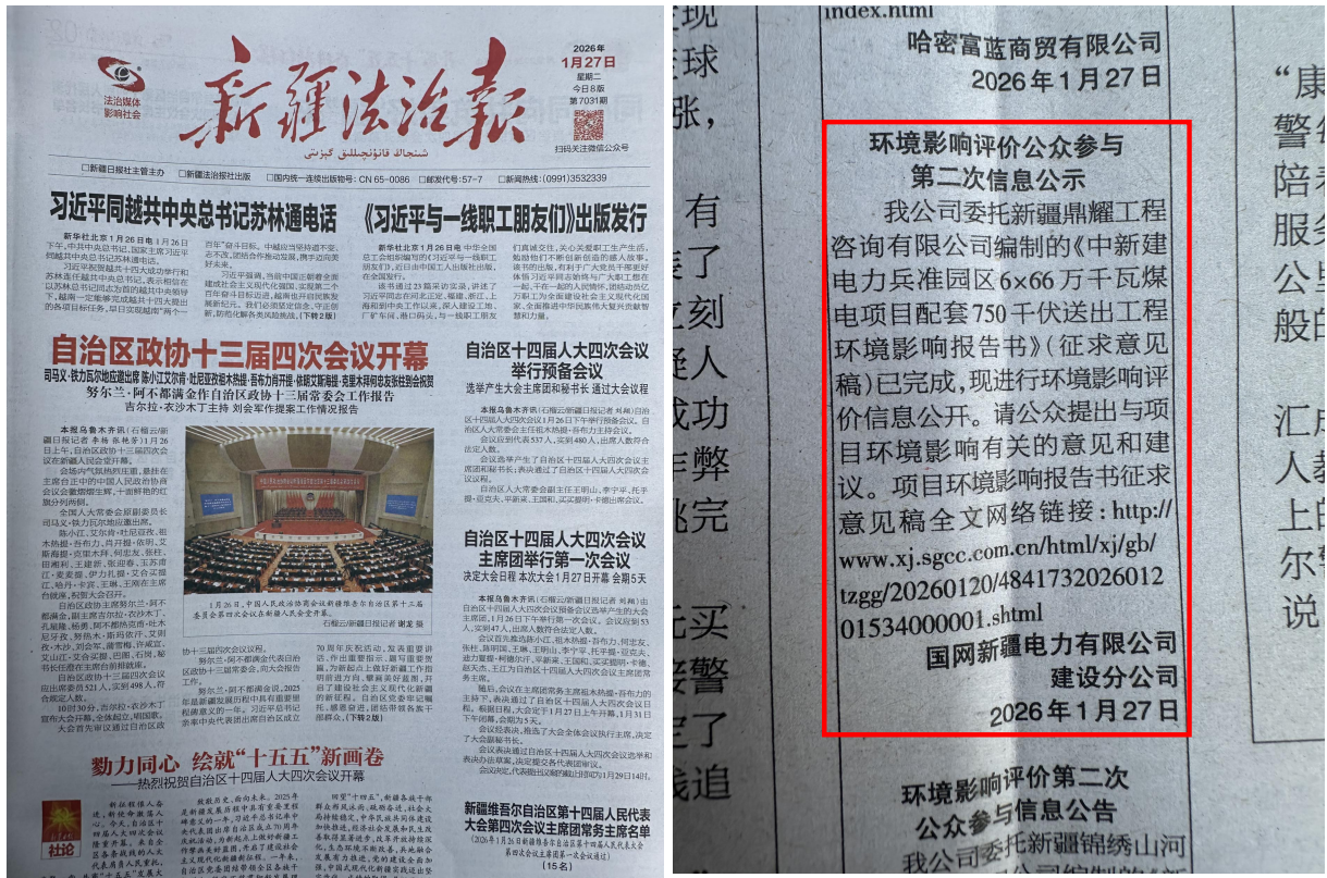
图3-3 《新疆法治报》公示图片（2026年1月27日）