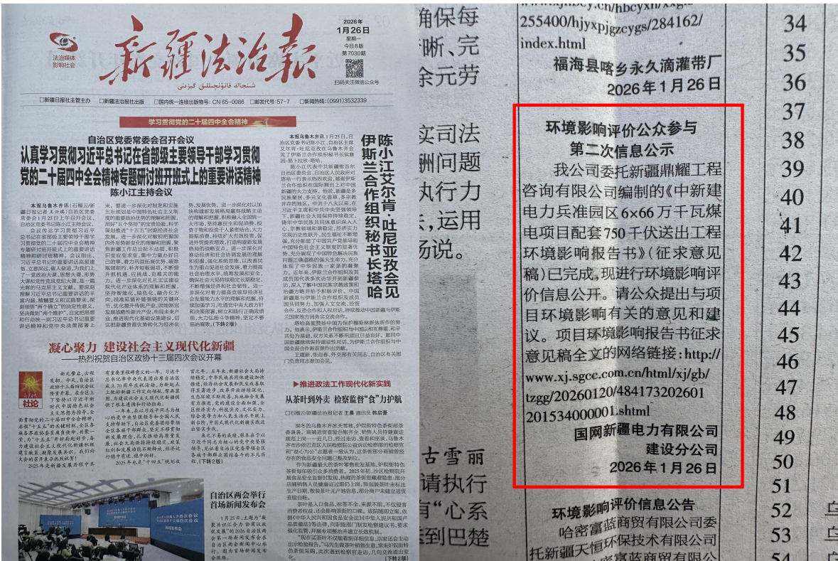
图3-2 《新疆法治报》公示图片（2026年1月26日）