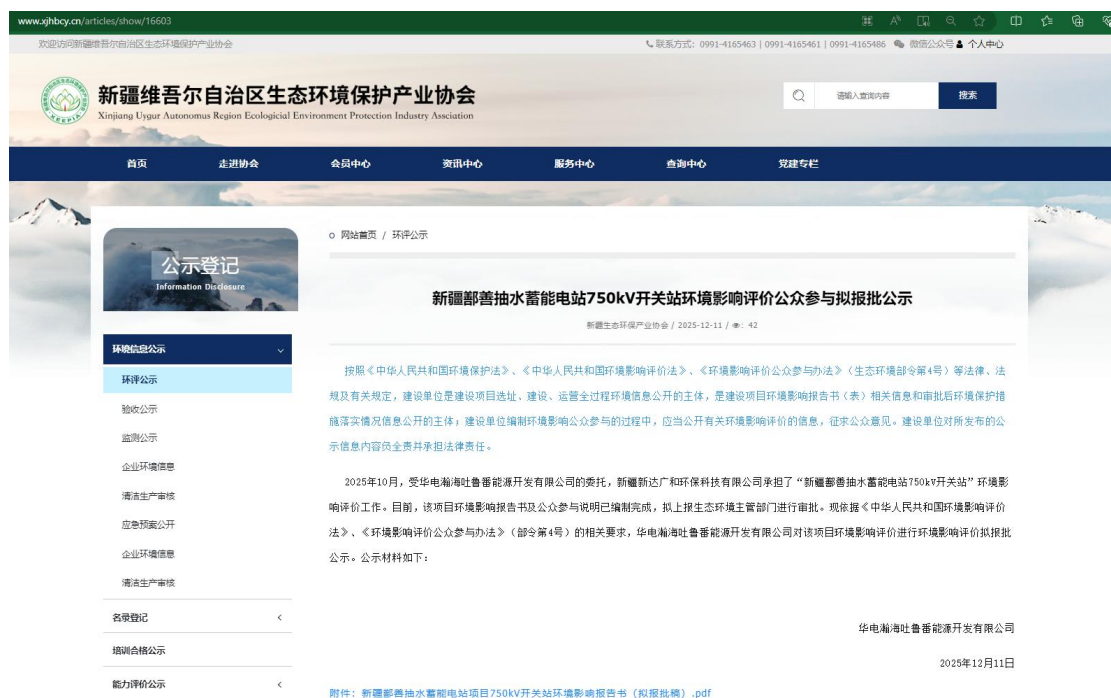
图 6 报批前网上公示截图