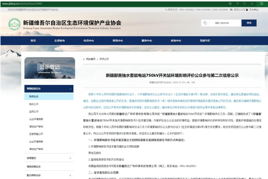
图2 征求意见稿网上公示截图

我公司分别于2025年11月28日及2025年12月1日，在新疆法制报对项目的环境影响评价信息进行了两次登报。