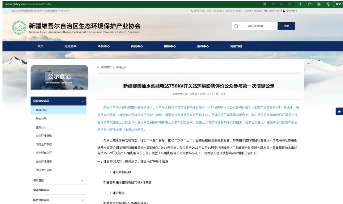
图 1 第一次公众参与网络公示截图

我公司于 2025 年 10 月 17 日在新疆维吾尔自治区生态环境保护产业协会官网进行第一次信息公开（公示网址为： http://www.xjhbcy.cn/articles/show/16316 ），网站公示截图见图 1。