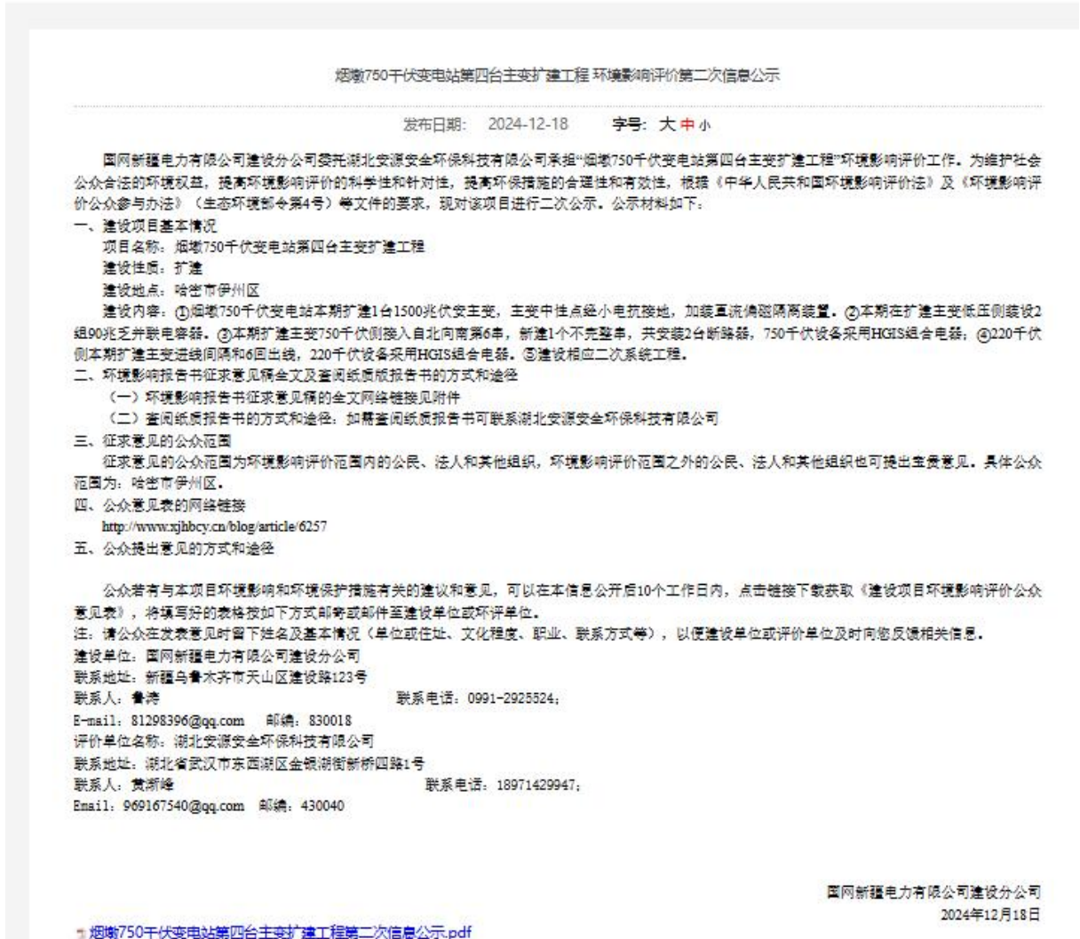
图2 征求意见稿网上公示截图