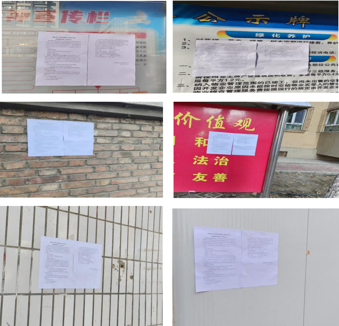
图5 本工程张贴公告照片

在第二次公示期间，我公司在项目所在地的哈密市、伊州区及附近乡镇村庄张贴了项目第二次公众参与信息公示，载体选择符合符合《环境影响评价公众参与办法》要求。