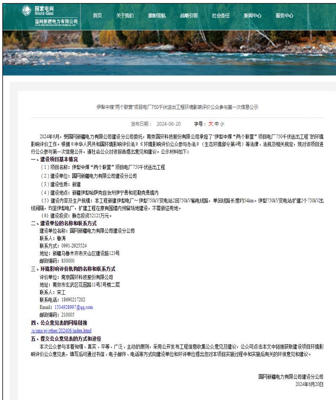
图 2.2-1 第一次网络公示