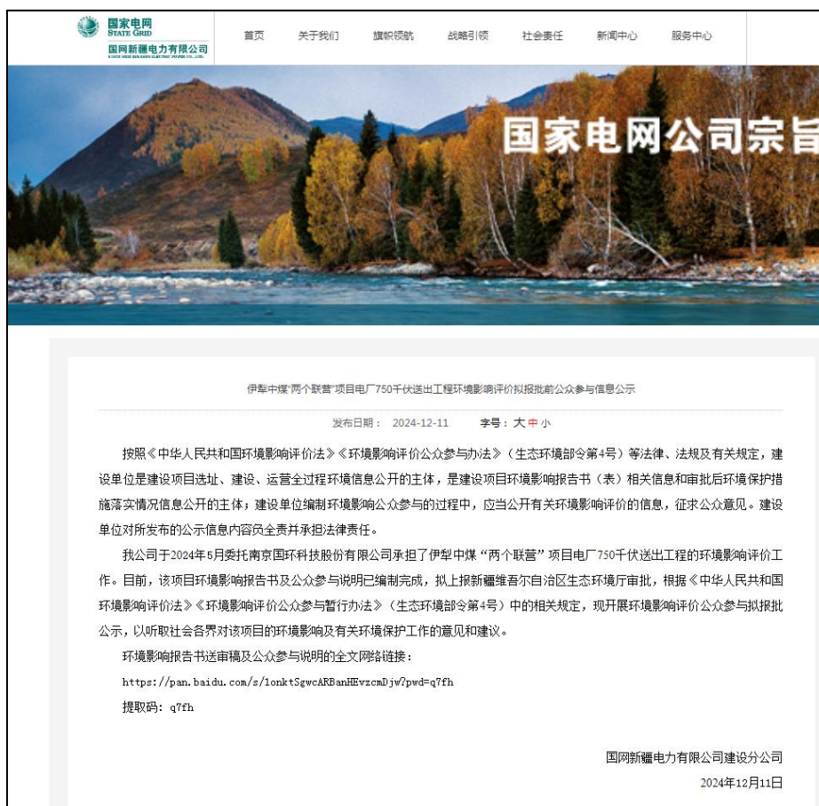
图 6.2-1 报批前公示网络公示截图