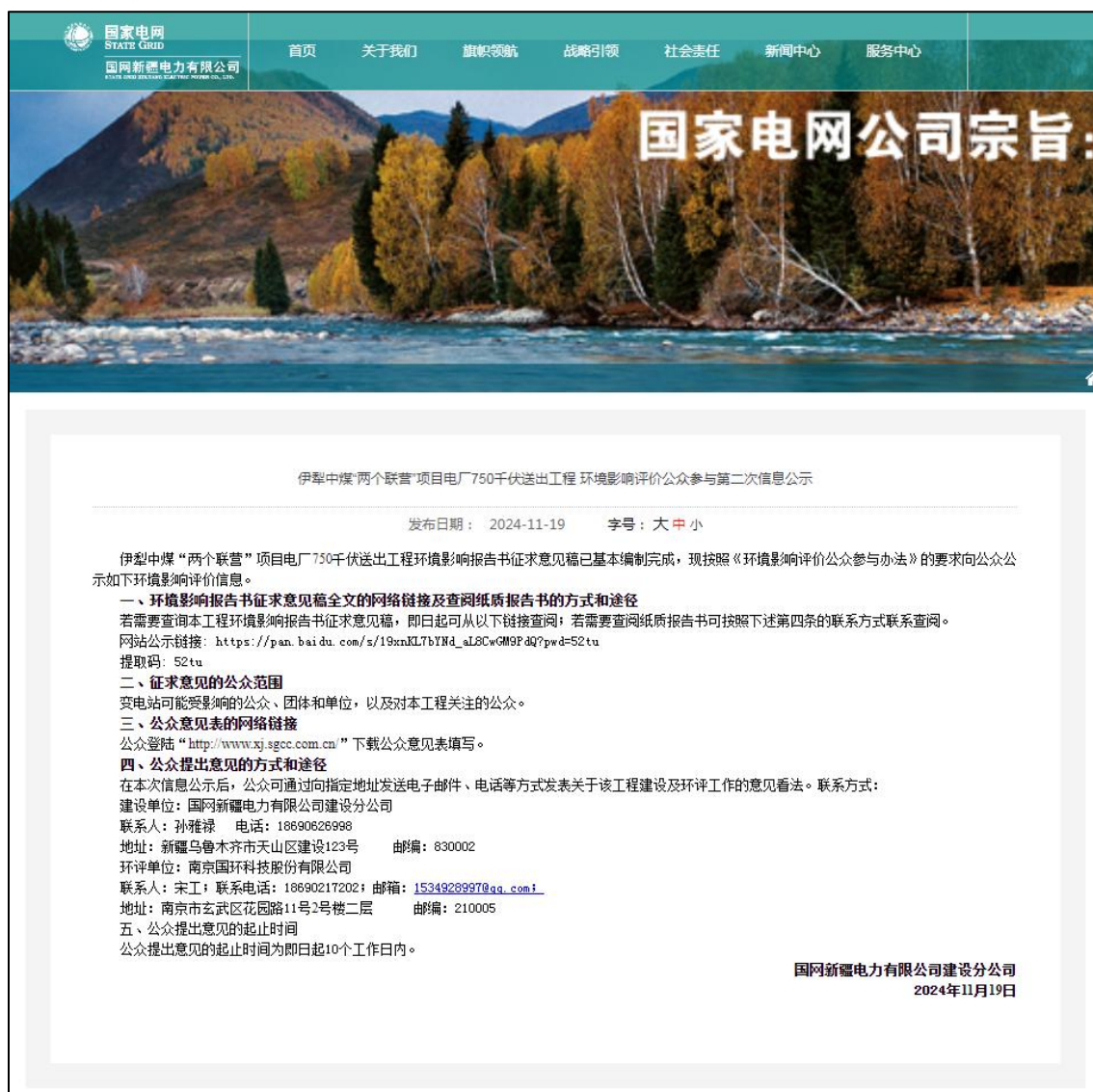
图 3.2-1 第二次网络公示