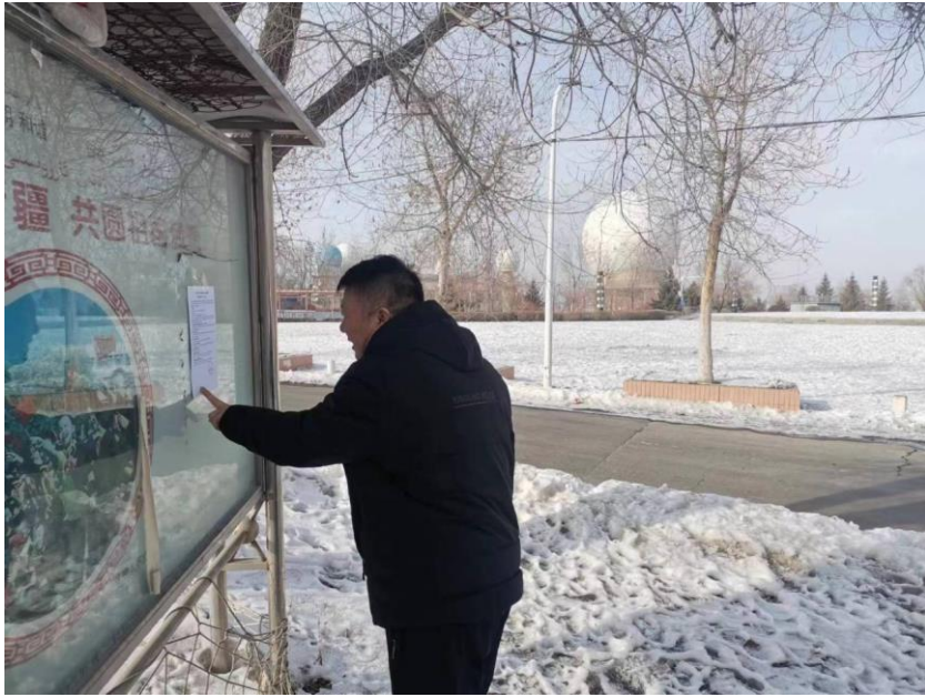
图 4 拟建天线处公告张贴