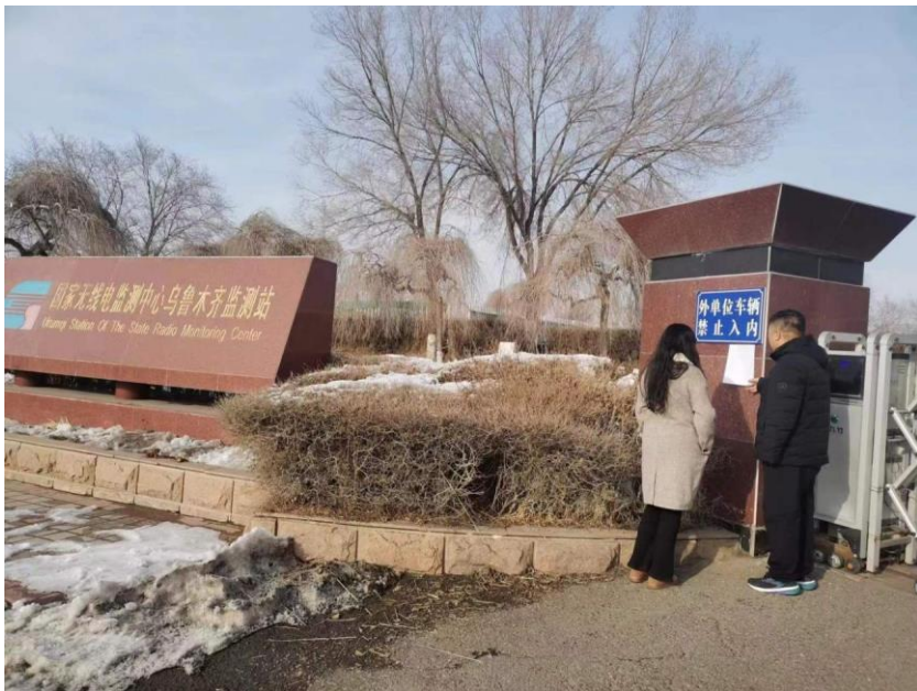
图 5 敏感目标处公告张贴