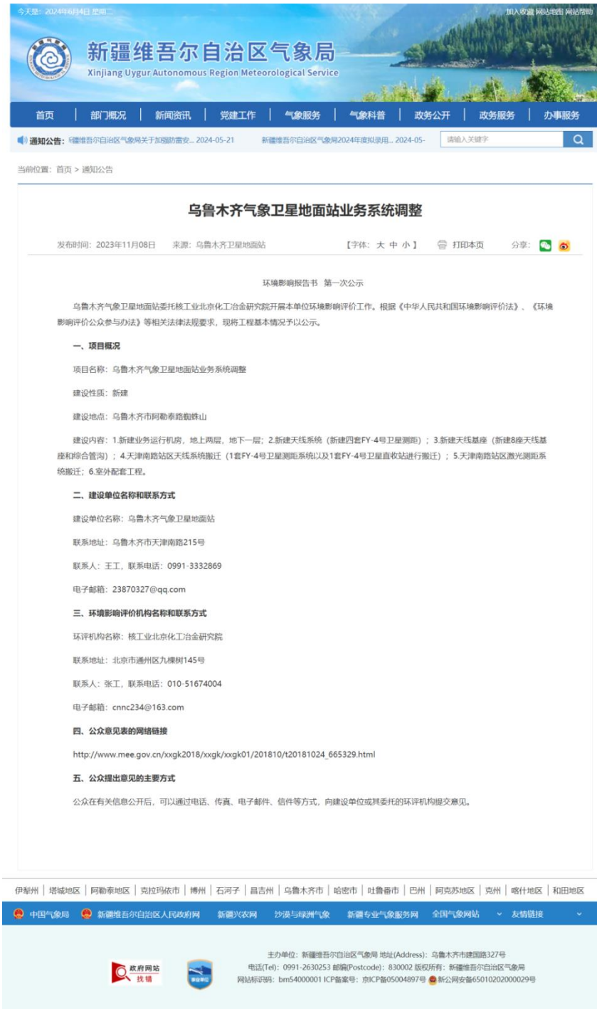
图1 首次信息网络公示截图

2023年11月8日在新疆维吾尔自治区气象局网站( http://xj.cma.gov.cn/xwzx/zxgg/ )公开了环境影响评价信息，公示截图见图1。