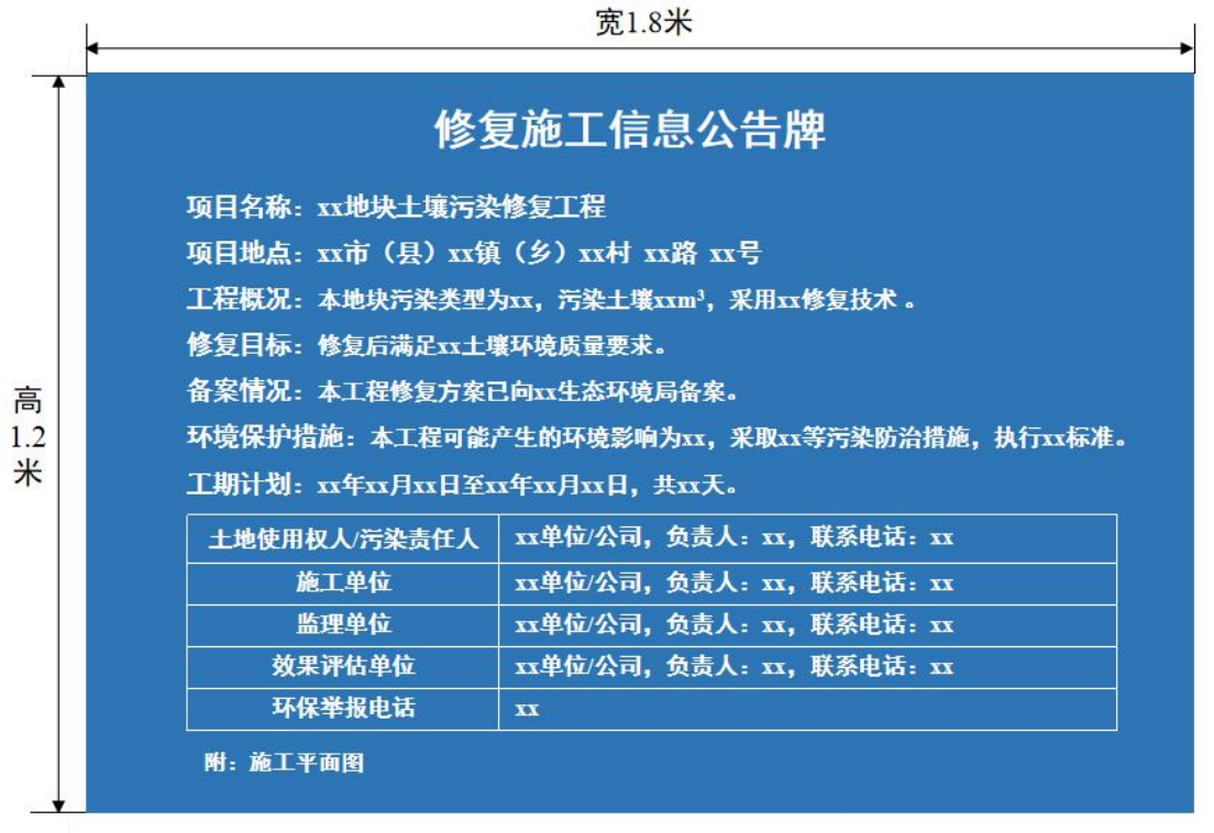
样式 1 (施工平面图另设牌公告)