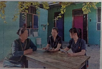
图 4 征求意见稿第二次报纸公示照片(2024年9月23日)

最终,双方达成协议,潘某承诺于今年12月15日前一次性向原告支付剩余货款,并主动承担了本案的诉讼费用。