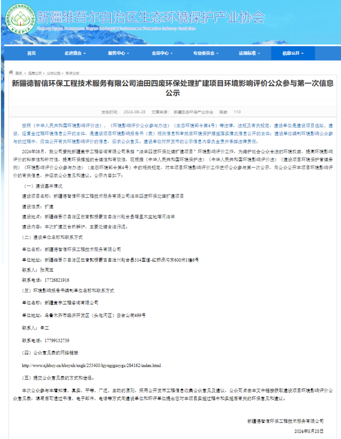
图1 首次环境影响评价信息网络公示截图