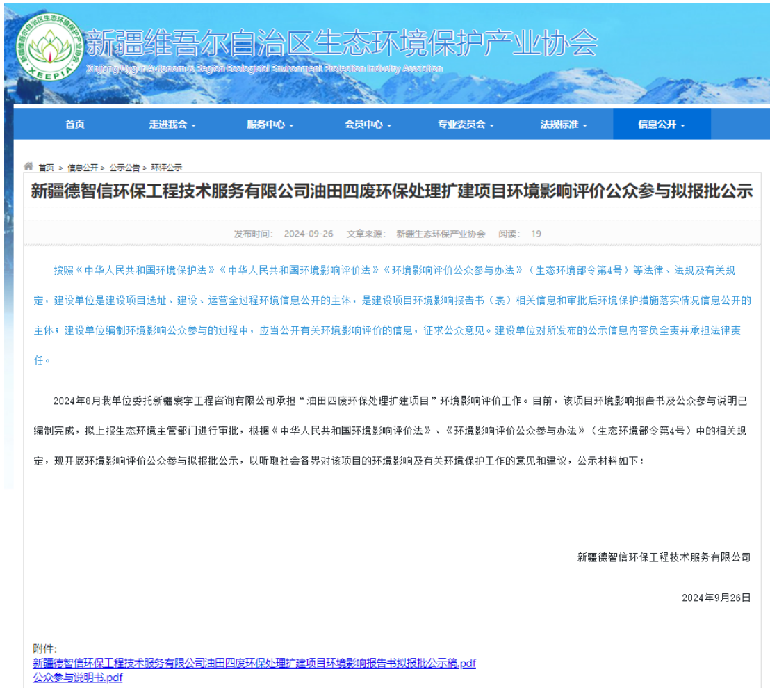
图 6 报批前网络公示截图