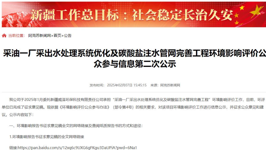
图 3-1 项目第二次公众参与公示截图

中国石油化工股份有限公司西北油田分公司于 2025 年 2 月 7 日在阿克苏新闻网刊登了项目第二次公众参与公示信息 ( https://www.aksxw.com/sy/gg/202502/t20250207_26579759.html )，载体选择符合《环境影响评价公众参与办法》要求。公示截图详见图 3-1。