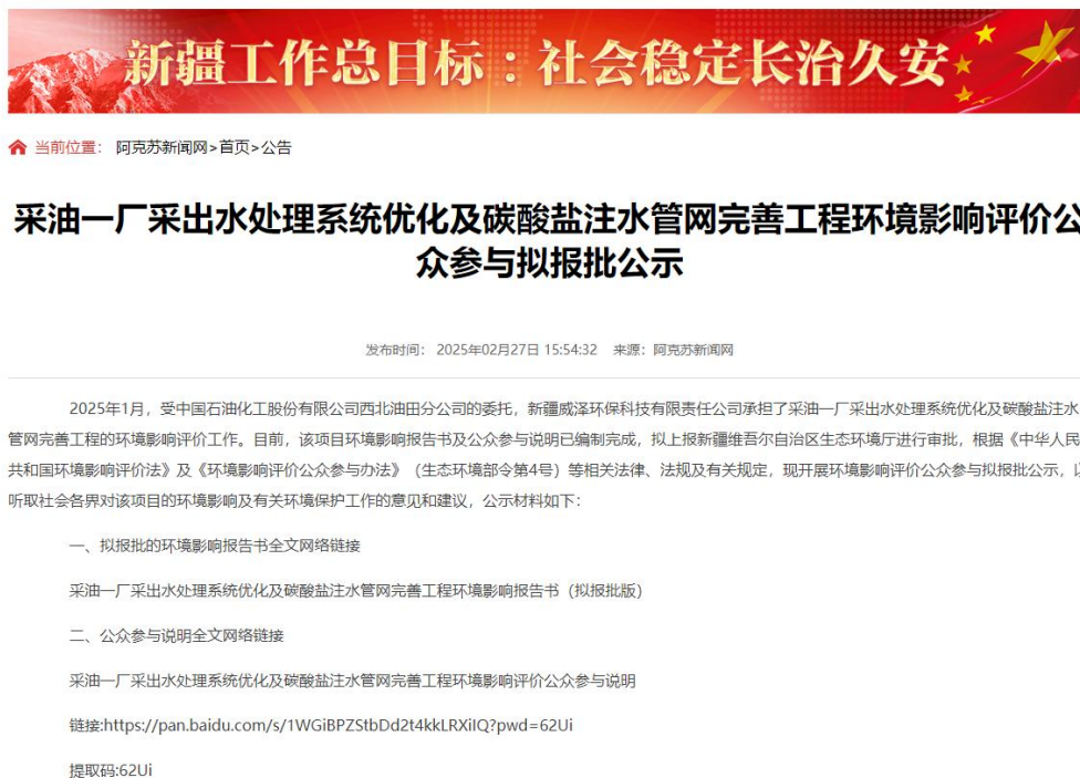
图 6-1 拟报批稿第三次报公示截图

中国石油化工股份有限公司西北油田分公司 2025 年 2 月 27 日在阿克苏新闻刊登了项目第三次公众参与公示信息 ( https://www.aksxw.com/sy/gg/202502/t20250227_26967302.html )，载体选择符合《环境影响评价公众参与办法》要求。公示截图请见图 6-1。