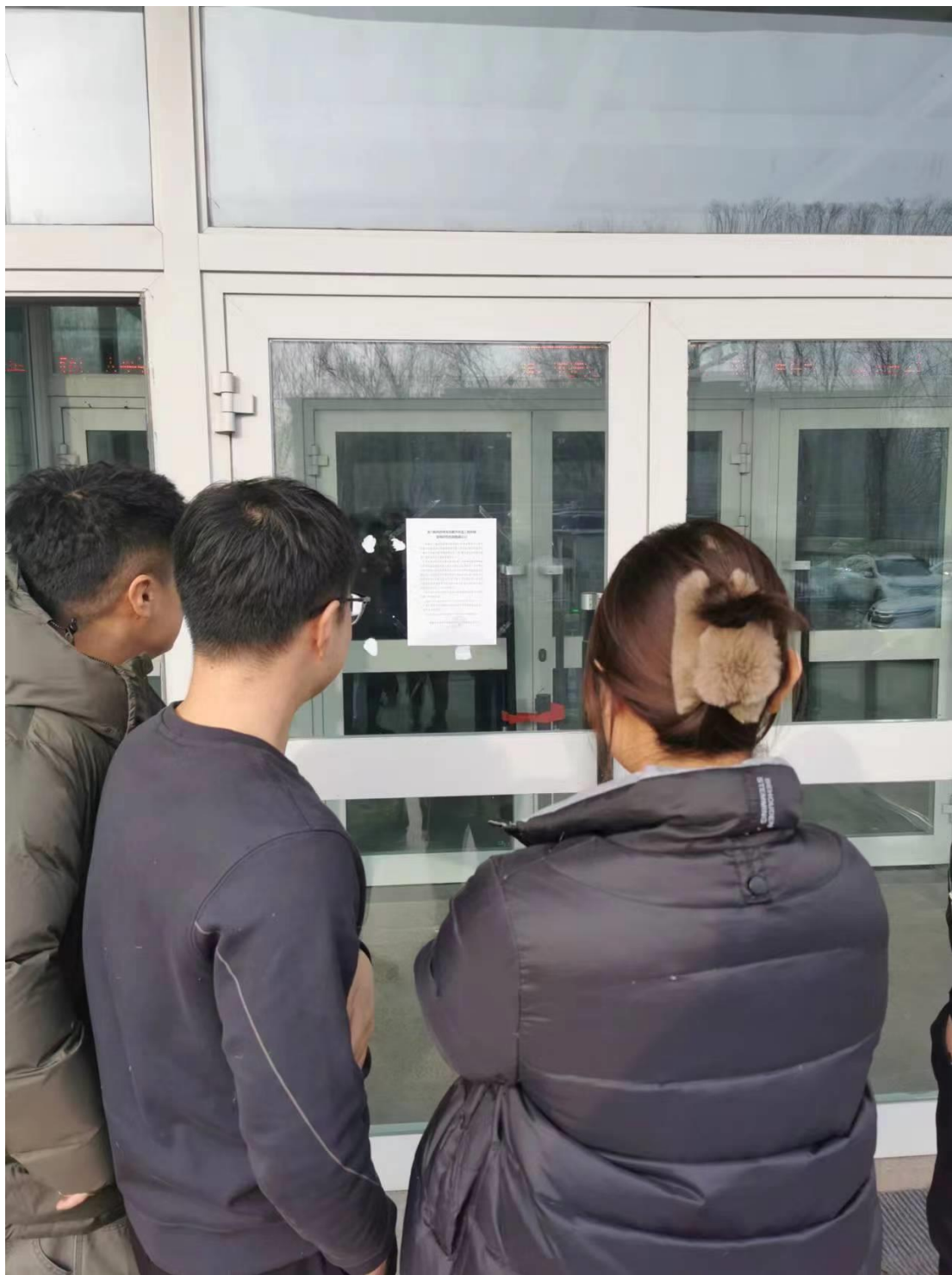
图 4 公示照片