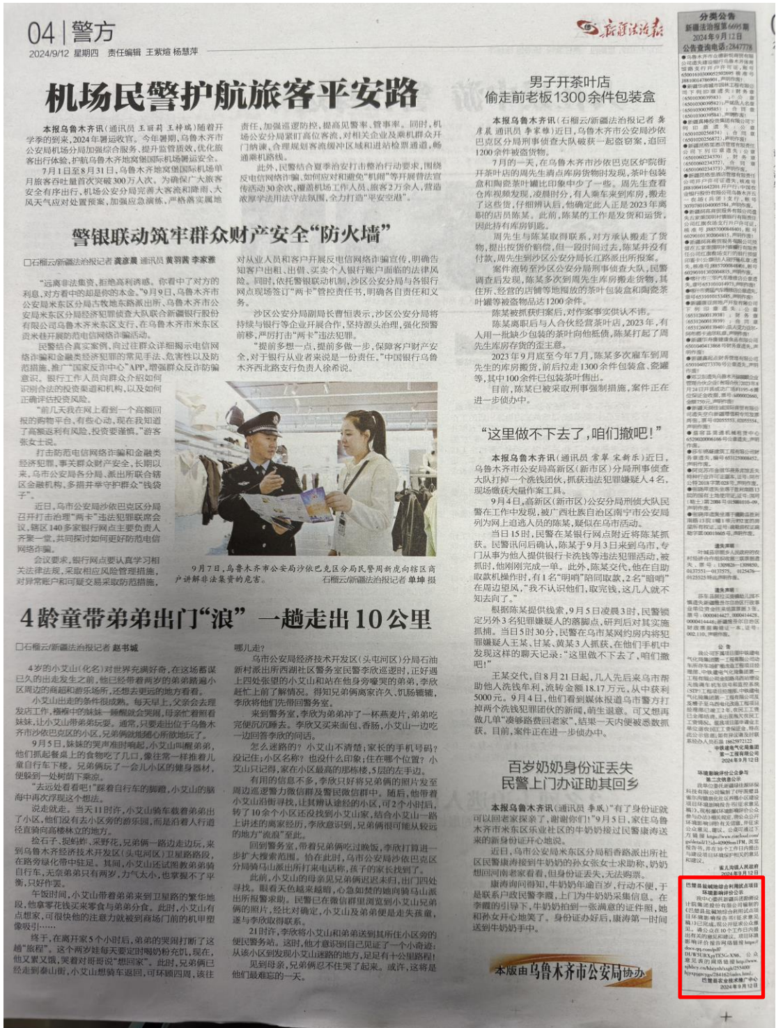
图3 征求意见稿第一次报纸公示照片