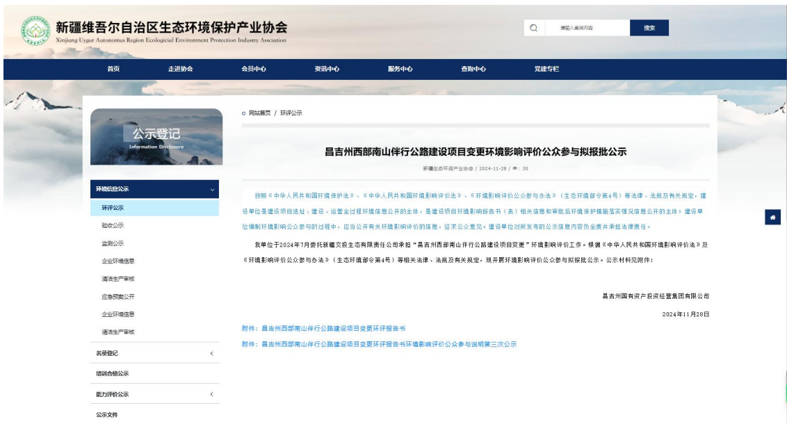
图 6-1 拟报批稿网络公示截图