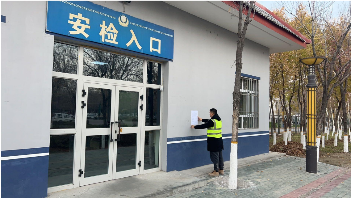
图 3-4 本项目张贴公告照片