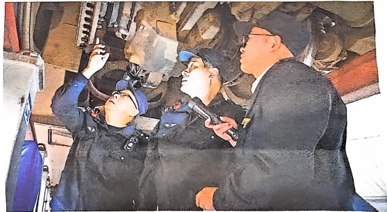
图 3-2 本项目第一次报纸公示照片

当日,该所民警来到乌鲁木齐动车运用所,对客车基地、检修库进行消防安全大检查,逐一排查安全出口是否堆放杂物、应急照明设备能否正常使用,全力确保铁路运输生产安全。