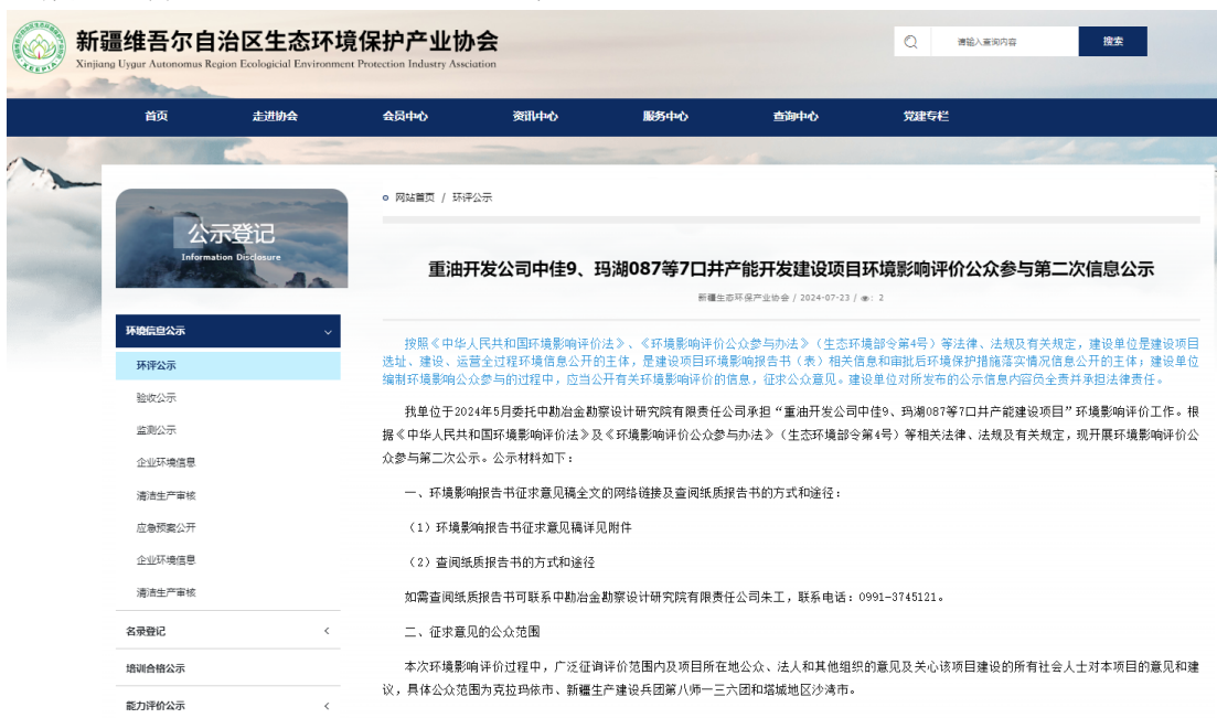
图 3-1 项目公众参与第二次信息公示截图

中国石油新疆油田分公司重油开发公司于 2024 年 07 月 24 日在新疆维吾尔自治区生态环境保护产业协会网站刊登了项目第二次公众参与信息公示 ( http://www.xjhbcy.cn/articles/show/13794 ), 载体选择符合《环境影响评价公众参与办法》要求。公示截图请见图 3-1。