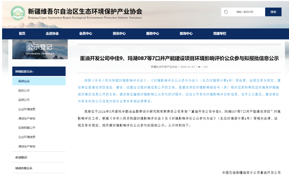
图 6-1 拟报批报公示截图