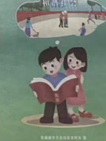
图3 第一次报纸公示——克拉玛依日报公示页面