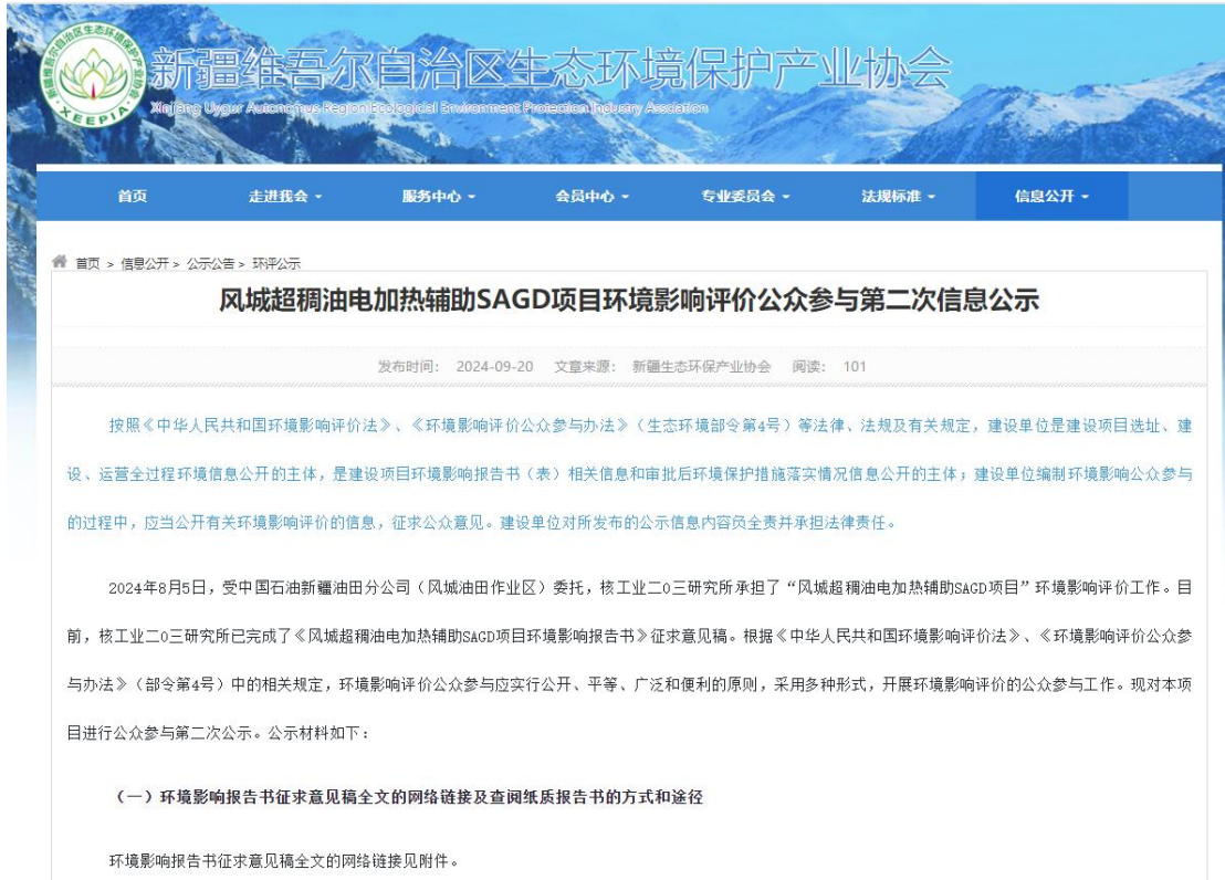
图2 本项目征求意见稿网络公示截图