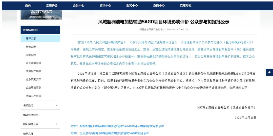
图6 本项目拟报批稿网络公示截图