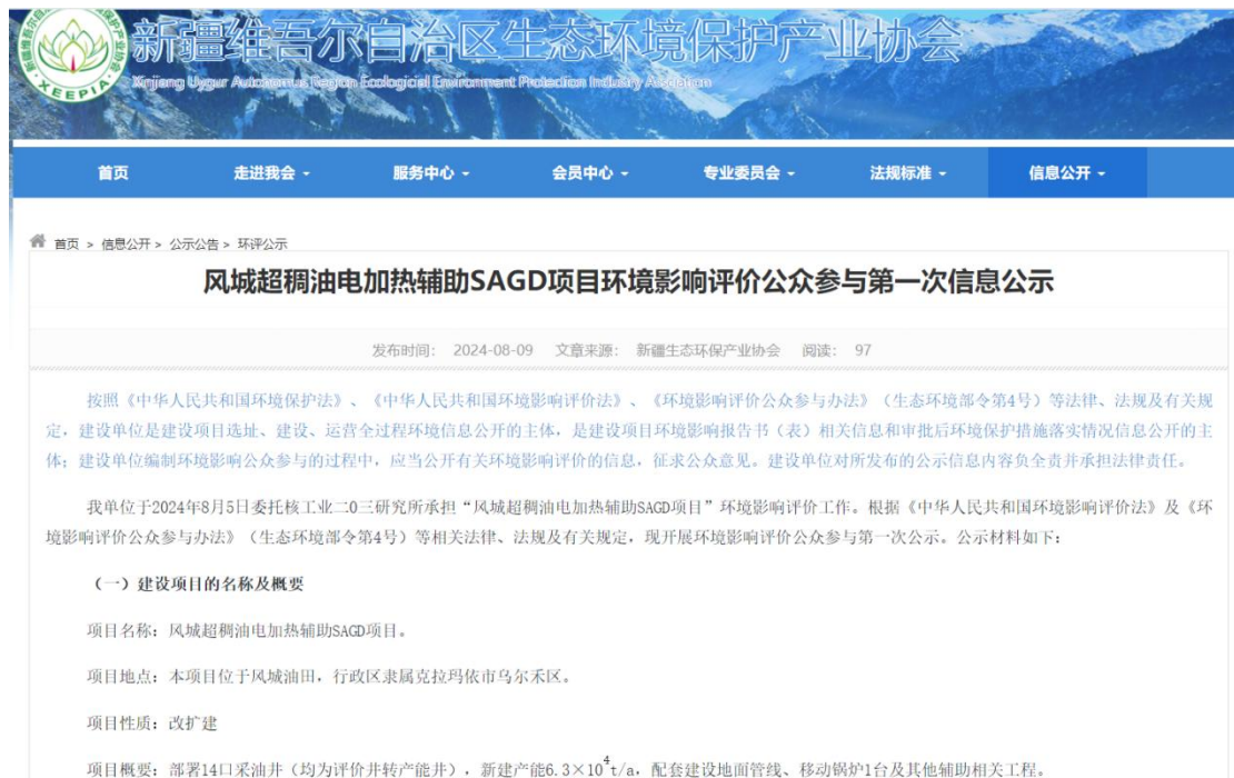
图 1 本项目第一次网络公示截图