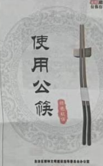
图4 第二次报纸公示——克拉玛依日报公示页面