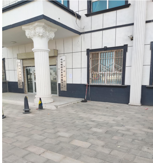
图 3-4 2024 年 10 月 28 日村庄张贴公示情况

我公司于 2024 年 10 月 28 日在周边村庄张贴了项目环境影响报告书公示信息，现场公示照片见图 3-4。