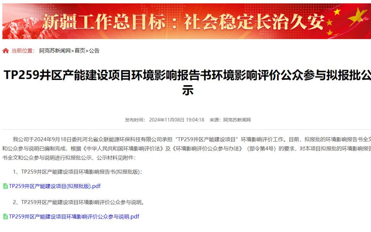
图 6-1 报批前网络公示截图

本次报批前公开方式为网络公开，公开时间为2024年11月8日，公开网站为阿克苏新闻网网站( http://www.aksxw.com/aksxw/content/ )，该网站可以上传并公开项目环境影响报告书全本，选择该网站进行公示符合《环境影响评价公众参与办法》要求。报批前网络公示截图见图6-1。