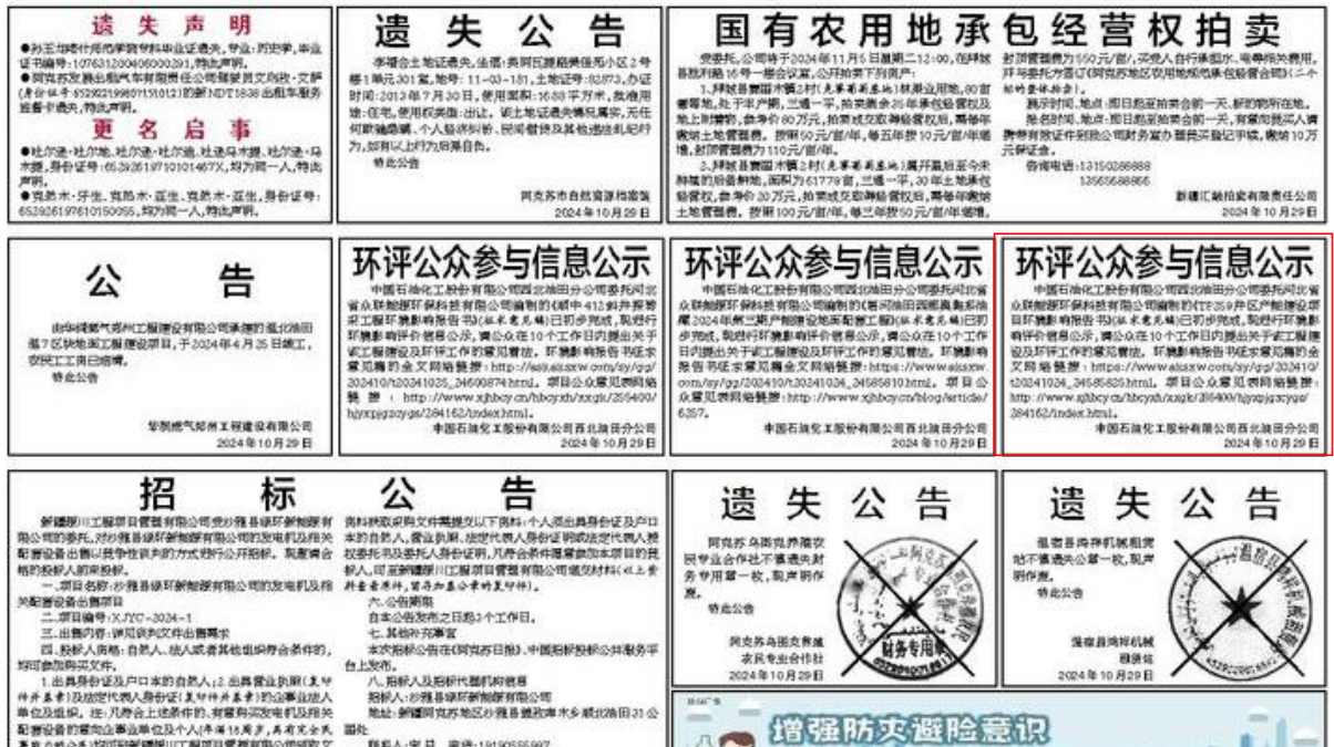
图 3-3 2024 年 10 月 29 日报纸公示情况